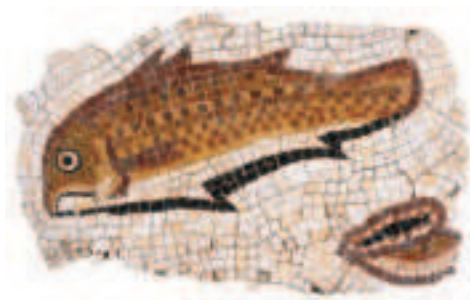
FIG.6 FRAGMENTO DA COMPOSIÇÃO MUSIVA QUE DECORAVA O PODIUM DO TEMPLO DE MILREU. MEADOS DO SÉC. IV D.C. MUSEU NACIONAL DE ARQUEOLOGIA.