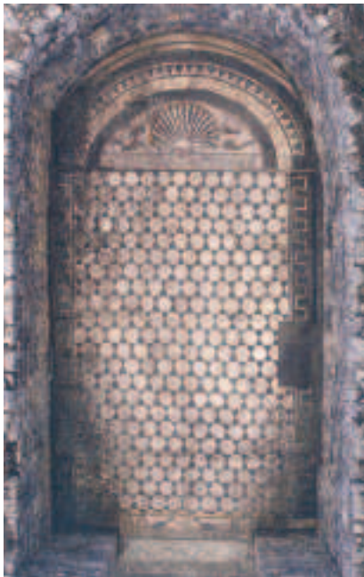
FIG.10 MOSAICO COM CONCHA E GOLFINHOS. CALCÁRIO POLICROMO. SÉC. III D.C. PAVIMENTO DE UMA PEQUENA ÊXEDRA A NORTE DE UM PERISTILO. IN SITU .