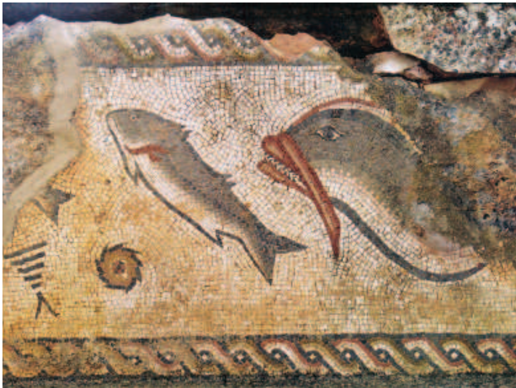
FIG.5 MOSAICO COM FAUNA MARINHA. CALCÁRIO POLICROMO. MEADOS DO SÉC. IV D.C. PAREDES DO PODIUM DO TEMPLO. MILREU. IN SITU .