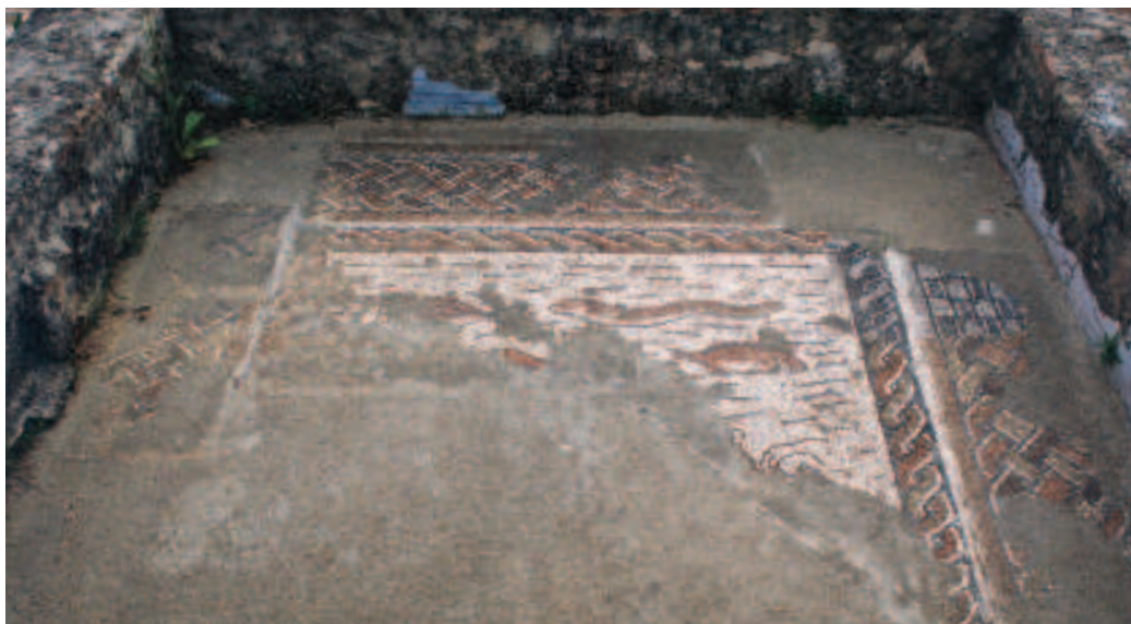
FIG.2 MOSAICO COM FAUNA MARINHA. CALCÁRIO POLICROMO E CERÂMICA. MEADOS DO SÉC. IV D.C. FUNDO DE UM TANQUE DOMÉSTICO. PISÕES. IN SITU .

4. Embora classificado como Monumento Nacional por decreto 42.692 de 30-11-1959, a estação arqueológica da Fonte do Milho permanece aterrada desde 1939, altura em que terminou a primeira – e única até à actualidade – campanha de escavações, conduzida por Carlos Teixeira. Vide TEIXEIRA, 1939, p. 58 et seq, CORTÊZ, 1946, sep. e MOURÃO, 2008, p. 7-8 e 108-111.