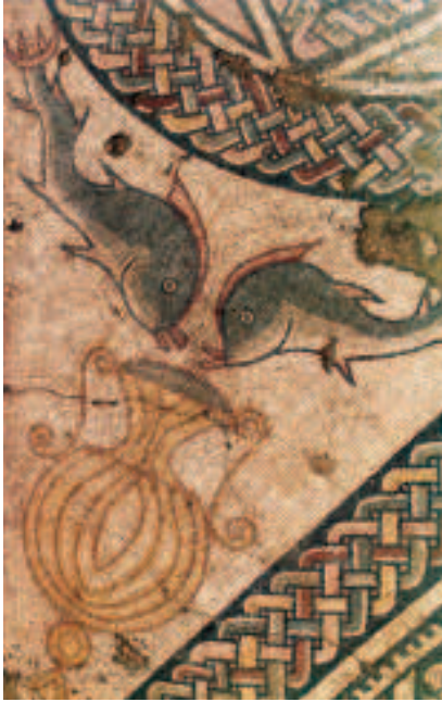
FIG.12 PORMENOR DE MOSAICO COM GOLFINHOS BEBENDO DE UM VASO. CALCÁRIO POLICROMO. MEADOS DO SÉC. IV D.C. CANTOS DO CORREDOR SUL DO PERISTYLUM. IN SITU . RABAÇAL.

krater representa a taça onde gregos e romanos misturavam vinho com água para beber em Symposia e bacanais, acreditando que tal mistura inebriante provocaria a metamorfose das bacantes em grandes felinos (tal como figurava no desaparecido mosaico de Santa Vitória do Ameixial) 24 . Este vaso da transformação, da mutação e da iniciação nos Mistérios de Dioniso e Baco, foi integrado na liturgia cristã como símbolo da comunhão com a Divindade, ou seja, como Graal da eterna aliança. 25 Enquanto a conjugação dos círculos encadeados com o ovo adquire um sentido unitário ligado à origem da vida, a ligação da concha ao krater evoca a liturgia dos Mistérios. Numa leitura de conjunto, é possível considerar a existência de um sentido iniciático neste painel musivo que «simbolicamente decorava o pavimento de uma dependência da casa onde a vida era assegurada e renovada pela alimentação.» 26