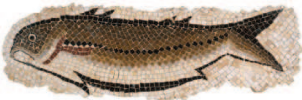
FIG.7 FRAGMENTO DA COMPOSIÇÃO MUSIVA QUE DECORAVA O PODIUM DO TEMPLO DE MILREU. MEADOS DO SÉC. IV D.C. MUSEU NACIONAL DE ARQUEOLOGIA.