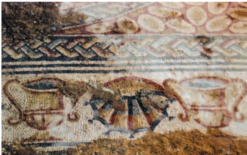
FIG.11 PORMENOR DO MOSAICO COM CÍRCULOS ENCADEADOS, CONCHAS E CRATERAE . CALCÁRIO POLICROMO. SÉC. III D.C. PAVIMENTO DO TRICLINIUM . CONIMBRIGA. DOMUS DOS ESQUELETOS . IN SITU .

e flores). Nesta lógica, se cada registo representar três dos elementos da natureza (água, ar e terra), o conjunto adquire um sentido cosmológico que poderá revelar uma função de culto (talvez panteísta ou cosmogónico) do local decorado, em possível consonância com uma eventual devoção pessoal do dominus .