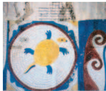
FIG.13 PORMENOR DO MOSAICO COM TARTARUGA. CALCÁRIO POLICROMO. FINAIS DO SÉC. VI D.C. PAVIMENTO DE UMA BASÍLICA PALEOCRISTÃ. DESTRUÍDO. DESENHO DE ESTÁCIO DA VEIGA.

As escavações até hoje efectuadas em solo nacional revelaram uma maior quantidade de representações aquáticas em mosaicos de zonas ribeirinhas e litorais, dentro de uma lógica influência dos rios e do mar nas economias e nos cultos colectivos das populações locais. Decorando êxedras, templos, tanques, implúvios e piscinas, os motivos ictiográficos assumem, nessas regiões, um duplo valor decorativo e simbólico. Mais esporádicos no interior do País, os elementos ictiológicos registam-se aí essencialmente em revestimentos de estruturas destinadas à utilização hídrica, como as termas e os implúvios, manifestando, por conseguinte, uma função sobretudo decorativa, e mais ocasionalmente em contextos devocionais privados, traduzindo, pois, um culto individual e aparentemente isolado dos encomendantes. Para além de reflectirem o grau de aculturação do imaginário romano sobre a água nas várias zonas das Províncias mais ocidentais do Império Romano, os exemplares musivos com motivos aquáticos espelham também as principais linhas do percurso evolutivo da arte do mosaico antigo, caracterizadas na época imperial (essencialmente desde o século II até ao século IV d.C.) pela mimesis de inspiração grega, pela