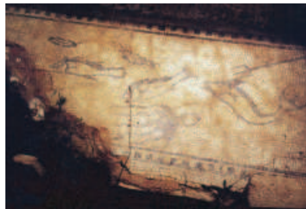
FIG.1 MOSAICO COM FAUNA MARINHA. CALCÁRIO BICROMO. SÉC.III D.C. FUNDO DE UM TANQUE. CERRO DA VILA. IN SITU .

3. Tal como se verifica nos cantos do painel conimbricense com representação de Actéon devorado pelos seus cães. Vide MOURÃO, 2008, p. 53-55.