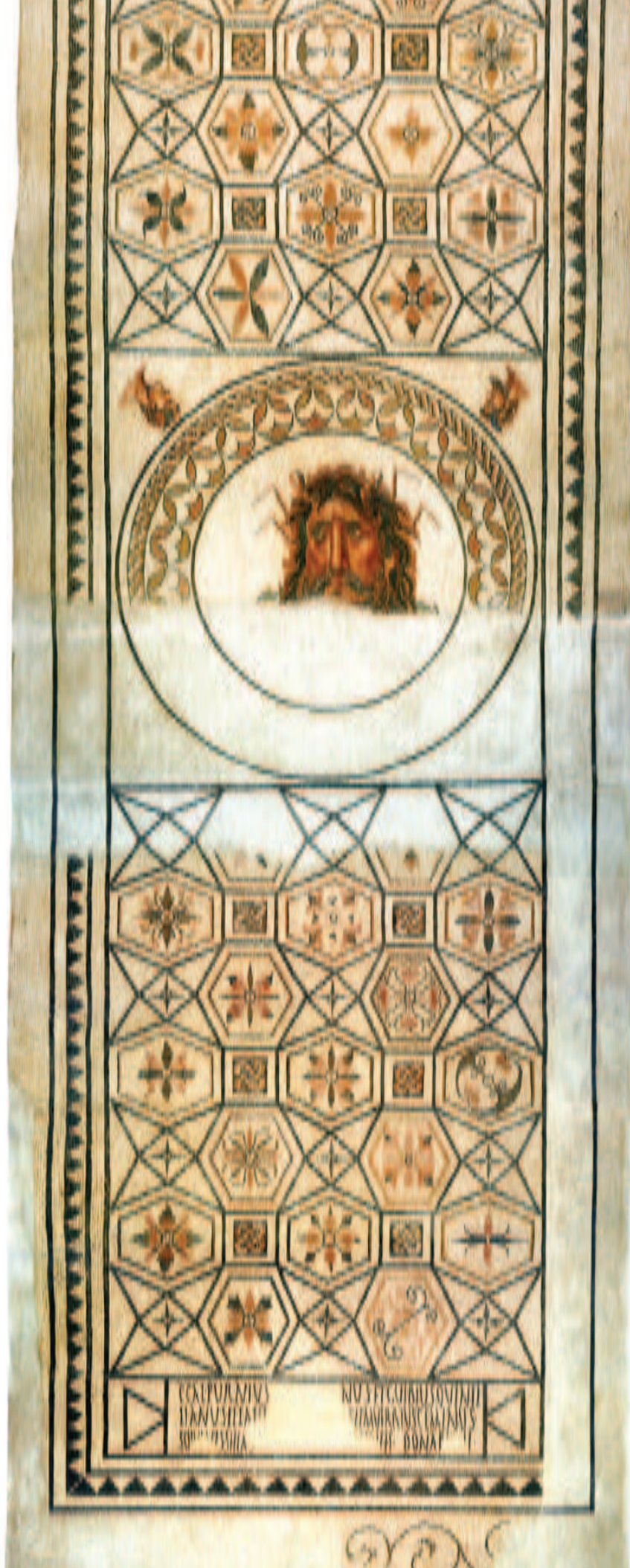
FIG.9 MOSAICO COM CABEÇA DO DEUS OCEANO E BUSTOS EM PERFIL DOS QUATRO VENTOS. CALCÁRIO, MÁRMORE E VIDRO POLICROMOS. SEGUNDO QUARTEL DO SÉC. III D.C. MUSEU MUNICIPAL DE FARO.