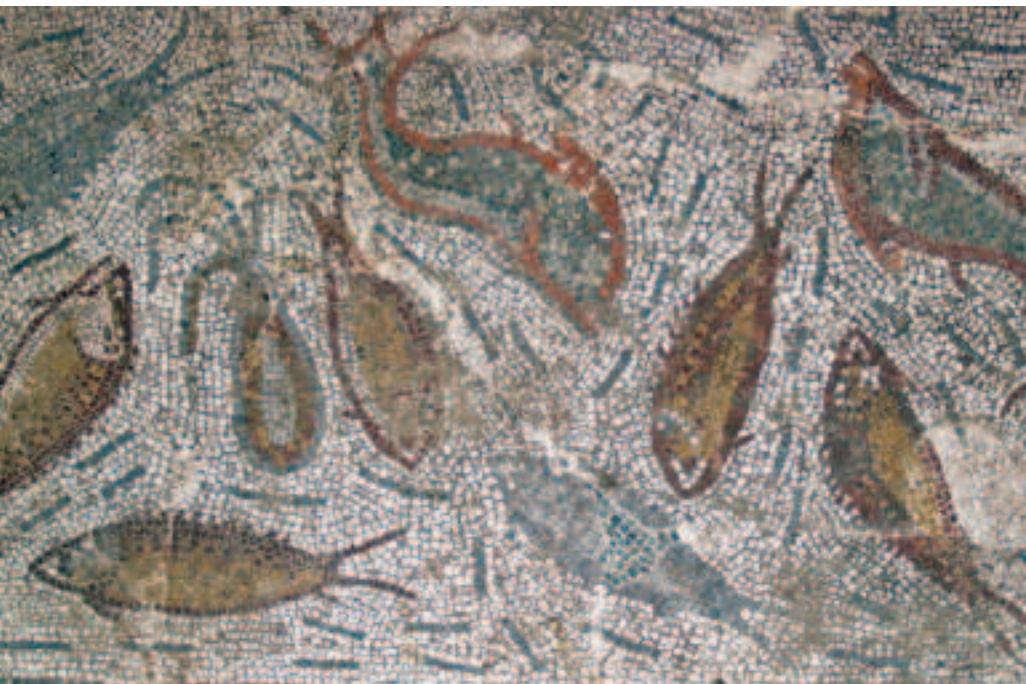
FIG.3 MOSAICO COM FAUNA MARINHA. CALCÁRIO POLICROMO. MEADOS DO SÉC. IV D.C. FUNDO DE UM TANQUE DOMÉSTICO. PROVENIENTE DA HERDADE DA TORRE DO CABEDAL. © CÂMARA MUNICIPAL DE ELVAS.