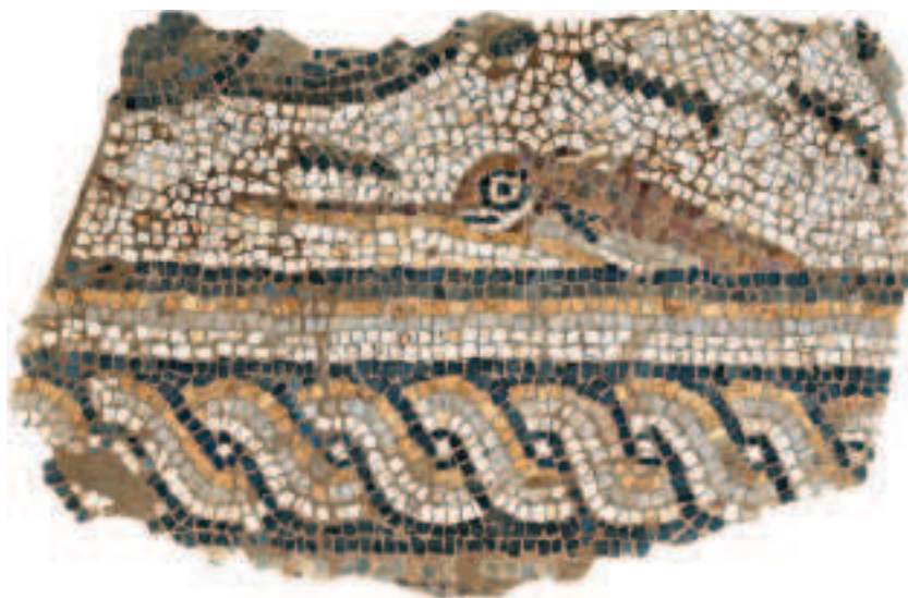
FIG.14 FRAGMENTO DE MOSAICO COM ESPADARTE (OU PEIXE-AGULHA). MONTINHO DAS LARANJEIRAS, ALCOUTIM. CALCÁRIO POLICROMO E XISTO. FINAIS DO SÉC. VI D.C. PROVENIENTE DO PAVIMENTO DE UMA BASÍLICA PALEOCRISTÃ. MUSEU NACIONAL DE ARQUEOLOGIA.