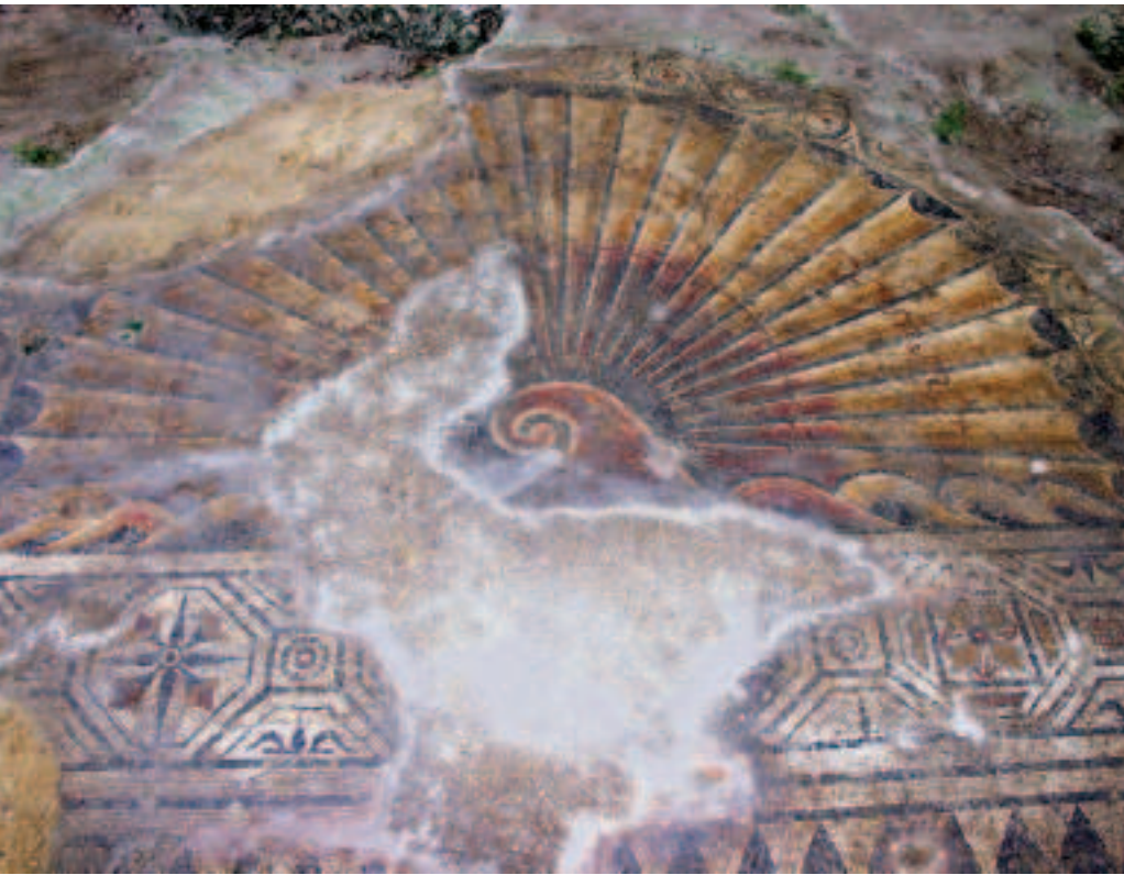
FIG.4 MOSAICO COM CONCHA. CALCÁRIO POLICROMO. MEADOS DO SÉC. IV D.C. PAVIMENTO DE UMA ABSIDE NO CORREDOR ORIENTAL. RIO MAIOR. IN SITU .

de um possível culto local das águas, cuja probabilidade toma consistência perante a expressão viva do afluente do Rio Tejo na toponímia (Rio Maior), na estatuária (ninfa náide fontenária que poderá ser tomada como divindade tutelar da nascente do Rio Maior) e, eventualmente, na economia romana. 5