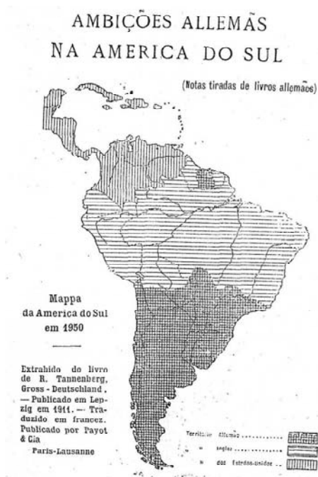
Mapa de Tannenberg

Fonte: Graça Aranha. "Prefácio". In: André Chéradame. O plano pangermanista desmascarado . Rio de Janeiro: Livraria Garnier, 1917, p. XXXIII.