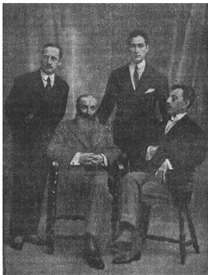
Guerra Junqueiro, Olavo Bilac, Pedro Bortaldo Pinheiro e João de Barros (Última fotografia do grande Poeta, inteiramente inédita, tirada em Lisboa)

Seu conteúdo privilegiava majoritariamente o domínio das letras – poesia e prosa. Os artigos, ensaios e biografias, sempre em menor número, além de contemplar temas ligados à problemática das relações luso-brasileiras, costumavam versar sobre assuntos culturais variados. Os colaboradores não percebiam remuneração e, no que respeita à sua nacionalidade, as fontes levantadas apontam a preeminência dos portugueses. Porém, a constatação não pode ser tomada como sinal de desprestígio do periódico, apesar de a sua proposta não contar com o apoio unânime da intelectualidade brasileira, como já se sublinhou. O predomínio dos conterrâneos de Camões, em larga medida, deve ser atribuído ao estado de guerra, que tornava bem mais difícil a comunicação e o transporte regular entre o Rio de Janeiro e Lisboa 43 .