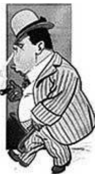
Caricatura de João do Rio