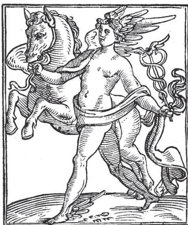
FAMA CHIARA Nella medaglia d'Antinoo

Uma belíssima figura nua de Mercúrio com as asas talares nos pés e caduceu, significa a clara fama devido à qual os antigos o fizeram mensageiro de Júpiter, e por ele se entende o falar, ou seja, a eficácia da voz e do grito que se expande e difunde por toda a parte. As talares e as asas que tem na cabeça significam as palavras velozes. O cavalo Pégaso entende-se pela clara fama de Antínoo, velozmente transportada e espalhada pelo universo.