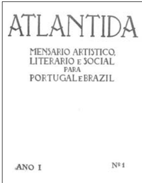
Folha de rosto da Atlântida

Na verdade, é necessário erguer, sobre o vasto Atlântico, um continente moral que nos ligue de vez. 27