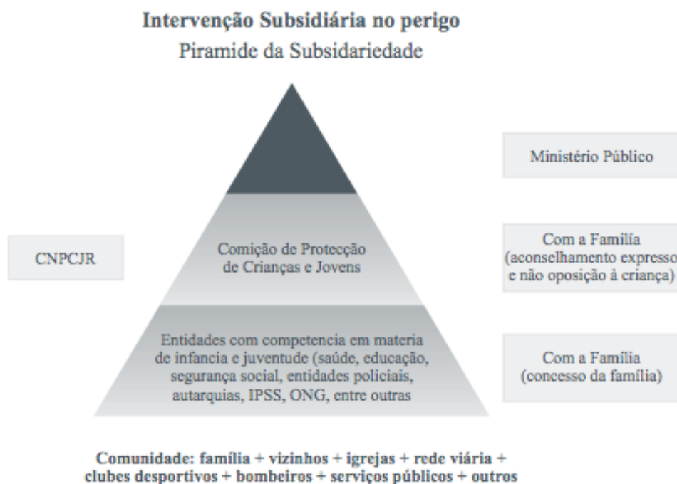
Figura: Intervenção subsidiária do perigo. Promoção e Protecção dos Direitos das Crianças. Guia de Orientações para os profissionais da acção social na abordagem de situações de perigo. 12

A Lei de Protecção de Crianças e Jovens em perigo traçou um Sistema baseado no princípio da subsidiariedade (Artigo 4.º, al. k LPCJP) ou sucessividade, como Dr.º Paulo Guerra defende, através de quatro níveis de intervenção: a família e comunidade (base da intervenção, corresponde ao meio onde a criança se encontra inserida), as Entidades com competência em matéria de infância e juventude, as Comissões de Protecção de Crianças e Jovens (ponto intermédio da intervenção), com base no consentimento das pessoas previstas no Artigo 9.º da LPCJP), e no topo da pirâmide os tribunais (Artigo 6.º). A intervenção deve seguir esta lógica progressiva de modo a que seja possível proteger-se a criança.