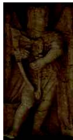
3 - Anjo com harpa