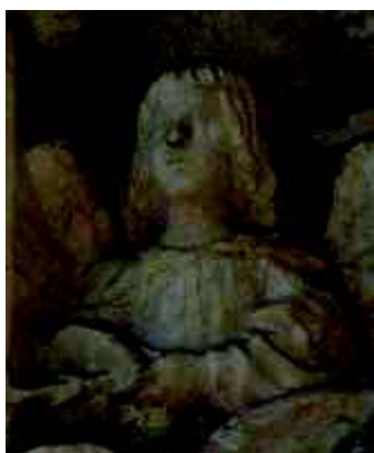
1 - anjo com sarronca (?)

direita; não se regista qualquer indício que aponte para um instrumento de cordas e o modo como o anjo segura a vareta não parece ser para percutir o instrumento, pelo que também não deverá tratar-se de um membranofone; assim, apesar de persistirem bastantes dúvidas, a nossa proposta é que se trata de uma sarronca, ou ronca, um membranofone de fricção, bastante popular em algumas regiões de Portugal e usado sobretudo durante o ciclo do Natal (OLIVEIRA 2000: 286). Regista-se ainda a presença de outro instrumento popular neste conjunto, a sanfona 18 , como referido atrás (fig. 2, n.º 8). Este cordofone friccionado gozou, é certo, de prestígio durante alguns séculos, sendo usada nos meios aristocratas, pelo menos até ao século XIII, conforme podemos testemunhar, por exemplo, numa das iluminuras das Cantigas de Santa Maria, de Afonso X (Escorial, Codex E, iluminura da cantiga 160), mas a partir do século XIV surge mais frequentemente relacionado a contextos populares, muitas vezes associado a mendigos e cegos (OLIVEIRA 2000: 215).