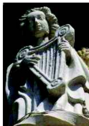
Fig. 1C e 1D – Pormenor dos anjos músicos com harpas.

Por fim, numa localização mais exterior, relativamente às anteriores, a citação de instrumentos da época, referentes da música instrumental tardo-medieval e renascentista: uma viola de arco (?) e um cordofone de mão (fig. 1E e 1F). Não são fixados pormenores que permitam a sua identificação com mais segurança; no caso da viola de arco, pode observar-se, precisamente, o arco com que o anjo a executa, assim como a posição em que se encontra; parte do braço, no entanto, apresenta uma configuração curiosa, diríamos mesmo errada, pois forma um ângulo quase recto com a caixa harmónica e com outra parte do mesmo braço. Poderemos pensar numa dificuldade ou constrangimento técnico, relativamente