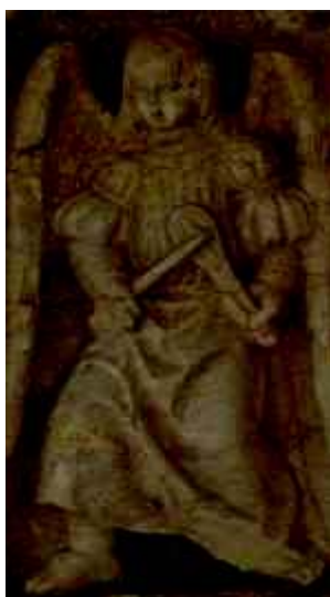
4 Anjo com rebec

Os restantes instrumentos são recorrentemente associados aos anjos, como referentes do conceito de harmonia ou símbolos de poder, como no caso das trombetas. Uma delas apresenta uma configuração fantasiosa (fig. 2, n.º 7), mas que não deixa de ser reconhecida como um instrumento desta tipologia, talvez a procura de evocar instrumentos antigos ou simplesmente para conferir variedade total, uma vez que todos são distintos. O segundo anjo toca uma trompeta (fig. 2, n.º 2) segundo um modelo que se terá fixado nas primeiras décadas do século XV, no qual o tubo se encontra já enrolado como nos instrumentos modernos deste tipo (SACHS 2003: 385), conforme no-lo apresenta já um tratado de Sebastian Virdung de 1511 19 .