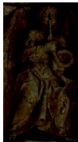
7 - Anjo com trombeta