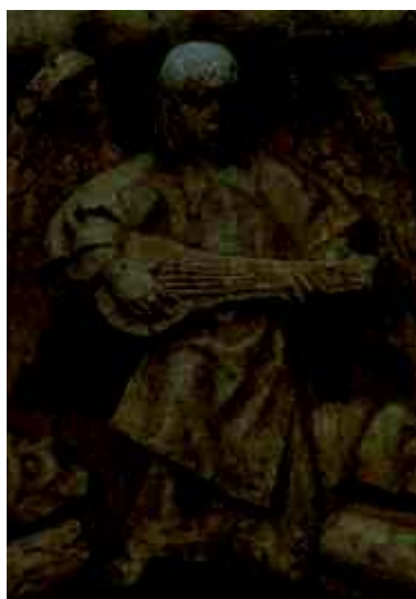
5 - Anjo com alaúde