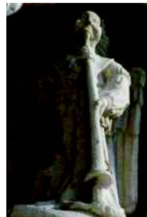
Fig. 1A e 1B). - Pormenor dos anjos músicos com trombetas.