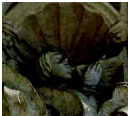
9 - Anjo com aerofone (?)

A localização é um dos aspectos que se revelam fundamentais para a leitura iconográfica deste conjunto; aqui, no local de entrada e passagem dos fiéis em direcção ao interior do templo, lugar de grande simbolismo, imagem, à dimensão terrena, do macrocosmos onde habita Deus 20 . Lembramos as palavras que se proferem aquando da sagração de uma igreja: « Hic domus Dei est et porta caeli... » (Gn 28, 17) 21 , as palavras de Jacob em Bethel, após despertar do seu sonho, no qual havia visto uma escada que subia até Deus, no céu, pela qual desciam e subiam anjos. Assim, o percurso para o seu interior é também uma caminhada simbólica, uma via de acesso, «porta» para o encontro com a divindade (CONNOLLY 1993: 52).