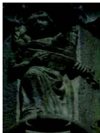
Fig. 1E e 1F - anjos músicos com viola de arco e cordofone de mão (?).

Apesar de se tratarem sempre de anjos músicos, a diferenciação instrumental sugere ter havido uma deliberada intenção de hierarquizar os elementos musicais referidos. As trombetas como símbolos de poder, instrumentos divinos, prescritos a Moisés (Nm 10, 1-10), surgem no registo mais elevado, as harpas e restantes cordofones, convocados como forma de expressão de louvor e meio de visualizar um universo musical teórico, a perfeita harmonia do mundo celestial, segundo o conceito de «música das esferas», surgem em registos mais próximos do terreno. Nos três pares de anjos, as representações dos instrumentos não seguem modelos rigorosos, como vimos, figurando apenas os elementos necessários para que se identifiquem, inequivocamente, como instrumentos de determinada tipologia.