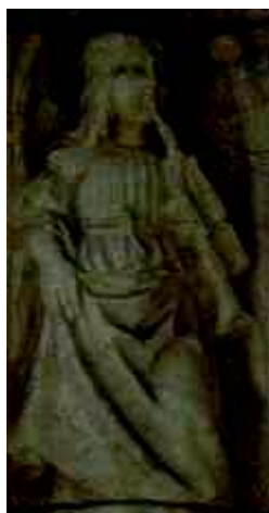
2 - Anjo com trompete