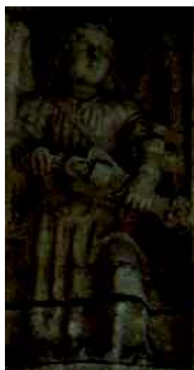
8 - Anjo com sanfona