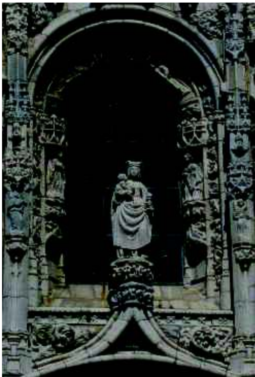
Fig.1 - A Virgem com o Menino e anjos músicos. Portal sul da igreja do Mosteiro de Santa Maria de Belém

É interessante a disposição deste conjunto de seis anjos e a simbologia dos instrumentos que foram escolhidos para ali figurarem. Assim, na localização superior e no interior do arco da janela, inseridos em nichos com mísula e baldaquino, surgem os dois anjos com trombetas, símbolos de poder, como acontece noutros contextos ou temáticas, nomeadamente de carácter escatológico. Mensageiros divinos, por isso aparecem no alto, em lugar de destaque e, simbolicamente, num registo superior, tal como noutras obras coevas, como a Custódia de Belém, por exemplo, conferem e contribuem para a construção de uma imagem de majestade e domínio (fig. 1A e 1B). Os instrumentos representados são muito simples: tubo recto, sem orifícios para digitação, ligeiramente cónico, apresentando um bocal onde o instrumentista apoia os lábios. A imagem pretendida é, inequivocamente, a de dois aerofones tipo trombetas, como as que é comum encontrarem-se nos temas apocalípticos.