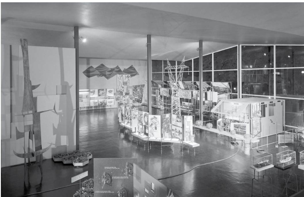
FIG. 3 Vista do interior do pavilhão de Portugal na Exposição Universal de Bruxelas com escultura de Jorge Vieira ao centro, 1958