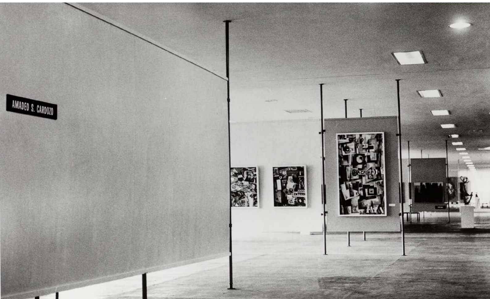
FIG. 6 Sala dedicada a Amadeo de Souza-Cardoso na V Bienal de São Paulo. Museu de Arte Moderna de São Paulo, 1959

De facto, a redescoberta de Souza-Cardoso surgiu num contexto muito específico que terá, quanto a mim, não só tornado possível mas também condicionado a apresentação do seu trabalho interna e externamente. Assim, em 1959, ano da grande retrospectiva organizada pelo SNI, a representação portuguesa na V Bienal de São Paulo voltou a exibir obras do pintor, mas agora dedicando-lhe uma sala especial [FIG. 6]. O papel de Souza-Cardoso na arte portuguesa clarificara-se