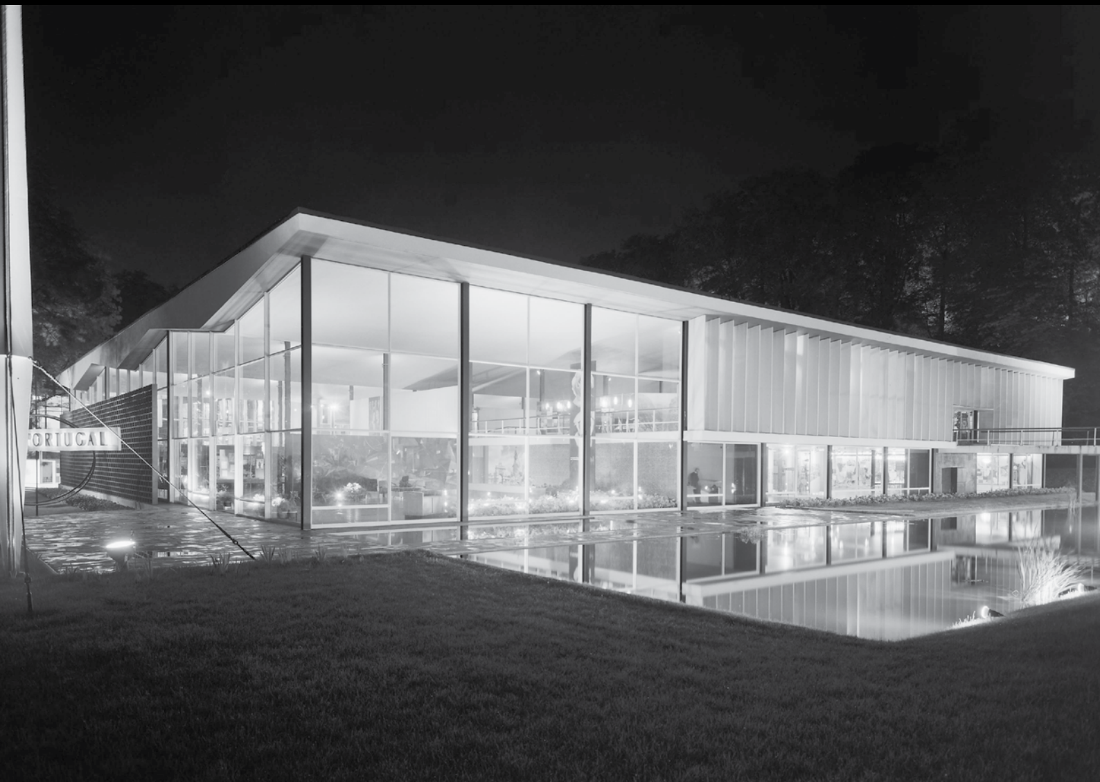
FIG. 1 Pavilhão de Portugal na Exposição Universal de Bruxelas, 1958 Arquiteto: Pedro Cid