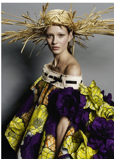
Figura 15 - Look 15 da coleção Van Gogh Girls de Viktor&Rolf (2015)

A relação da dupla Viktor Horsting e Rolf Snoreen com a arte é muito peculiar e acompanhou todo o percurso tanto dos designers como da própria marca. Contudo, entre os anos 2015 e 2016, os designers levaram esta relação mais longe, em três coleções que exploravam cada vez melhor os limites da arte vestível: Van Gogh Girls , coleção de alta-costura de primavera/verão de 2015; Wearable Art , coleção de alta-costura de outono/inverno de 2015; e Performance of Sculptures , coleção de alta-costura de primavera/verão de 2016. De acordo com Lorient (2018), estas três coleções diferem das restantes, porque nelas existem referências diretas à arte, que até então nunca tinham sido feitas. Neste sentido, e ainda que abordando temas diferentes, cada uma delas, individualmente e em conjunto, trazem uma nova e inesperada forma de questionar os limites entre a moda e a arte.