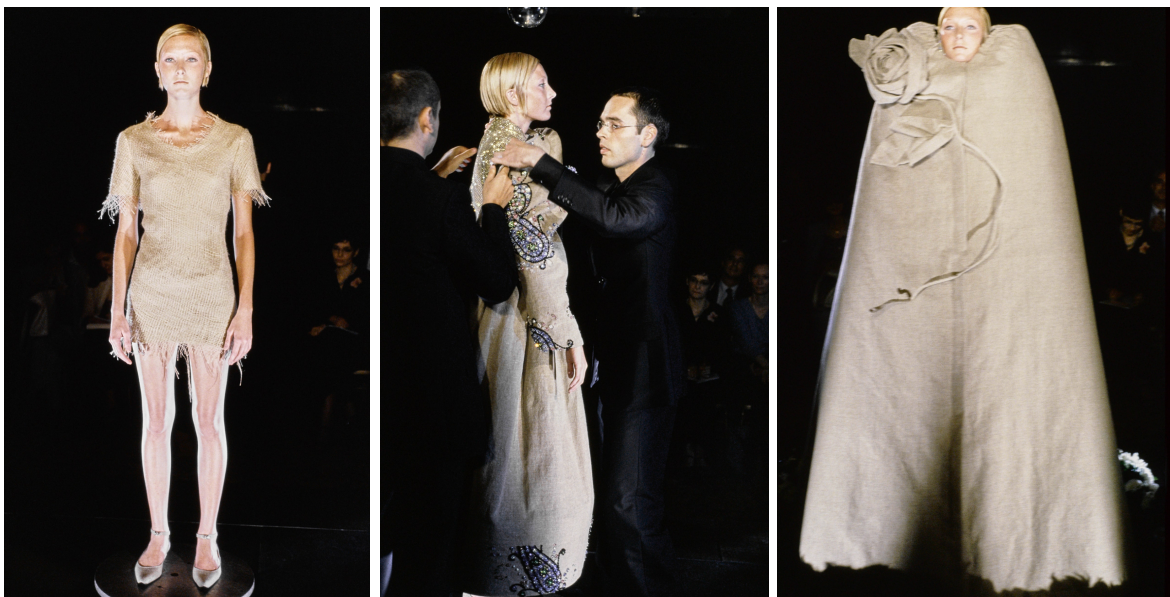
Figura 20 – Imagens do decorrer da apresentação da coleção Russian Doll de Viktor&Rolf (1999)

Rolf com mais um vestido, num total de nove camadas. De acordo com os designers, cada camada era uma preparação da camada seguinte, que completava ou espelhava a camada anterior, funcionando assim como uma espécie de puzzle e criando uma boneca russa invertida 83 . Resultando numa das apresentações mais irreverentes e originais da dupla esta performance pretendia, por um lado, mostrar a mão do designer na criação de moda e, por outro, fazer uma sátira ao ciclo rápido e contínuo da moda e do consumo; conferindo-lhes reconhecimento internacional.