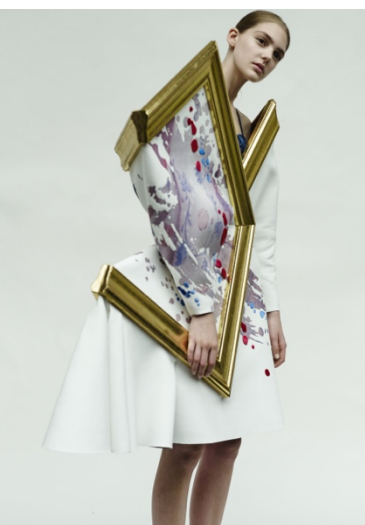
Figura 16 - Look 12 da coleção Wearable Art de Viktor&Rolf (2015)