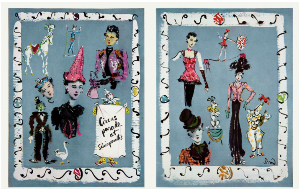
Figura 3 - Ilustração de Christian Bérard sobre a Circus Collection de Elsa Schiaparelli

considerada a coleção mais ambiciosa da designer até à data 47 . Esta ambição esteve fortemente presente tanto no design das peças e dos acessórios que as acompanhavam, como na própria forma como a designer pensou o desfile, que contou com dançarinos, acrobatas e malabaristas em constante movimento, dificultando a passagem dos próprios manequins que tinham de abrir caminho pelos salões, numa tipologia que se assemelhava à do espetáculo que lhe serviu de inspiração. Os seus desfiles eram extremamente cobiçados: a designer enchia salas enormes com celebridades, artistas, compradores de moda, críticos e até membros da realeza, que ansiavam ver as suas apresentações – e o desfile da Circus Collection não foi exceção 48 .