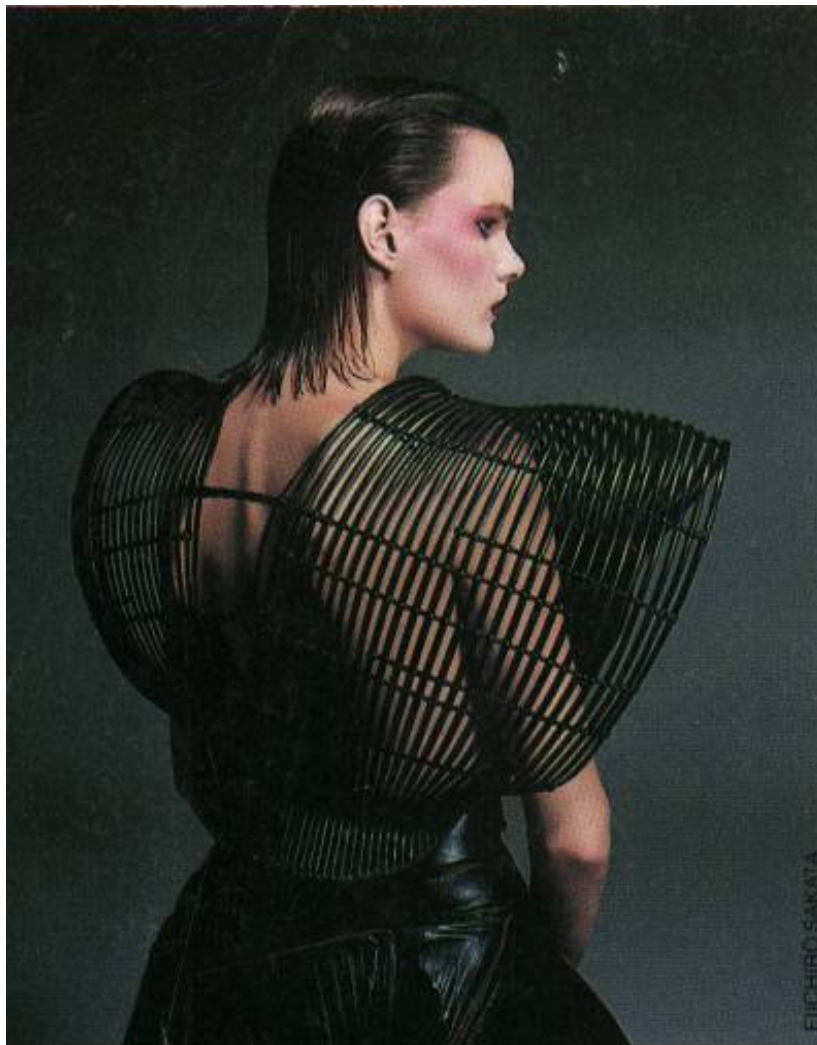
Figura 13 - Corpete de Vime de Issey Miyake (1982)

O Rattan Body – ou, em português, corpete de vime – é, como o próprio nome indica, uma peça toda ela construída em vime e bambu. Para isso, Miyake contou com a colaboração de Shochikudo Kosuge, um artesão especializado no trabalho destas matérias-primas, que o ajudou a aplicar os processos tradicionais na produção desta peça de roupa 65 .