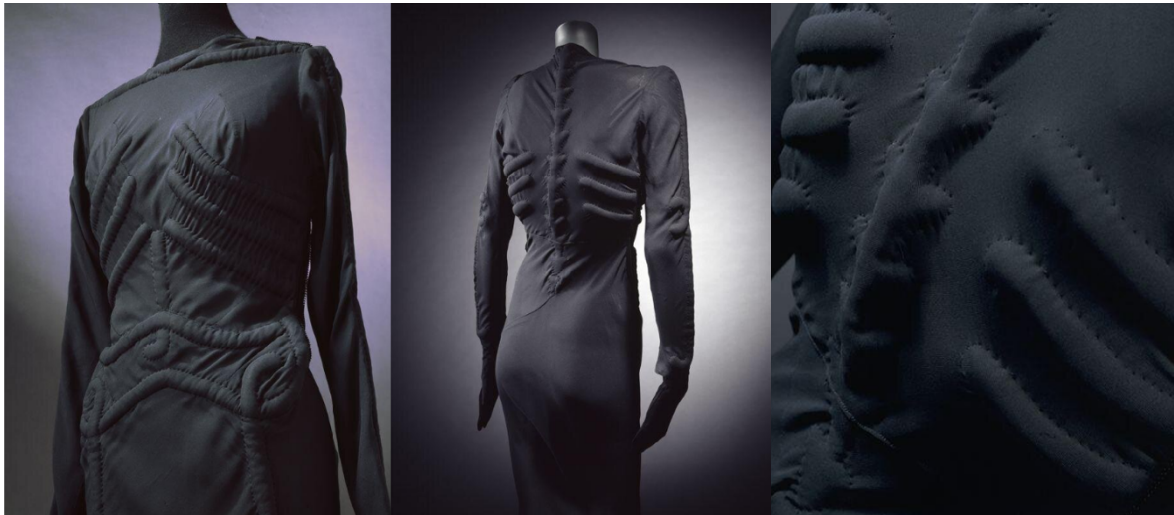
Figuras 9, 10 e 11 - Frente, costas e pormenor do Vestido Esqueleto de Elsa Schiaparelli

ver as saliências dos ossos, continuando a simulação das costelas da caixa torácica e apresentando, ao centro, a coluna vertebral, particularmente interessante pelo detalhe ao desenhar as vértebras individualmente. Na zona da bainha podemos ainda ver que o tecido está franzido, abrindo ligeiramente o vestido, o que facilita o andar e cria uma sensação de volume na zona, contrariando toda a restante dinâmica mais justa da peça.