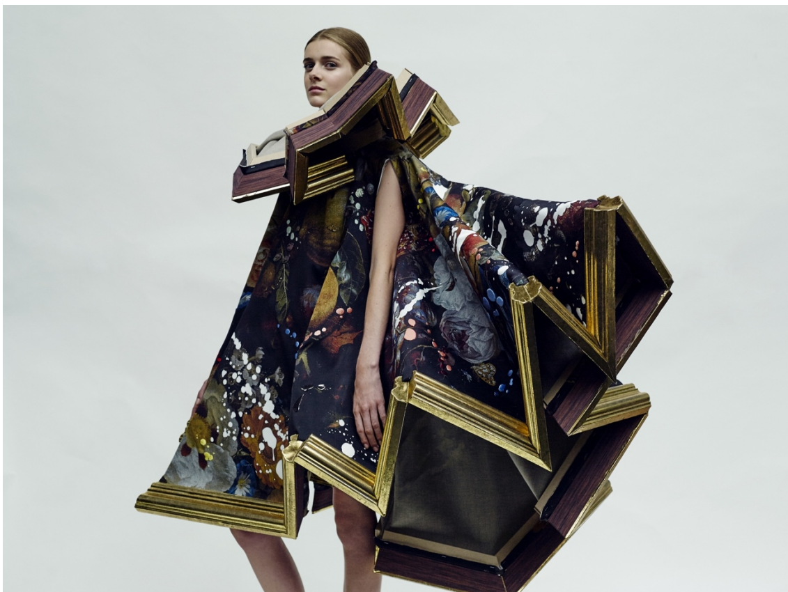
Figura 19 - Look 20 da coleção Wearable Art de Viktor&Rolf

O vestido que compõe o último look representa, assim, a construção mais extrema e a obra de arte mais completa de toda a coleção. Possui um colarinho gigante, revelando o interior bege da tela e o interior mais escuro da moldura, com o objetivo de reforçar a ideia do híbrido moda-arte; a partir do qual cai o vestido, exibindo o tecido “pintado” com uma natureza-morta. A bainha, feita pela moldura partida em forma de zig-zag, dá a estrutura à peça, que resulta em pregas e camadas soltas que se estendem e sobem para o lado direito, criando assim uma silhueta assimétrica e irregular. Esta estrutura amassada, salpicada e suspensa cria a ilusão – como acontece também nas outras peças da coleção, mas nesta em particular por ser a mais exagerada - de que se trata de uma obra de arte resgatada do lixo minutos antes do desfile começar.