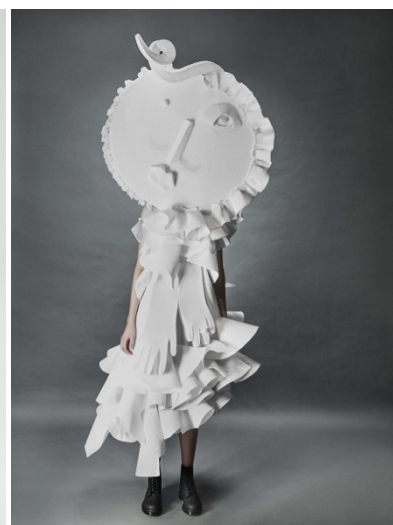
Figura 17 - Look 17 da coleção Performance of Sculptures de Viktor&Rolf (2016)