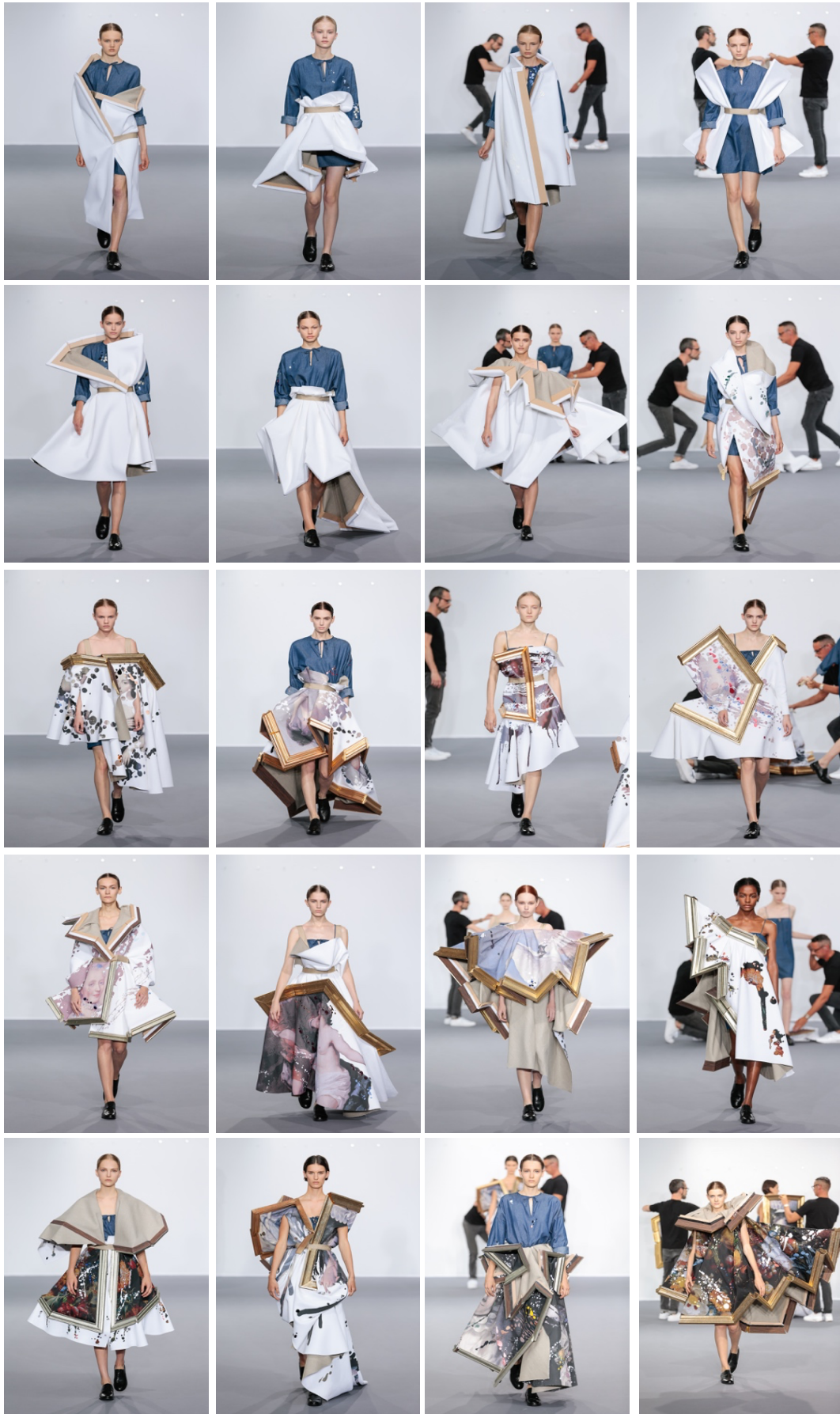
Figura 18 - Coleção Wearable Art de Viktor&Rolf (2015)