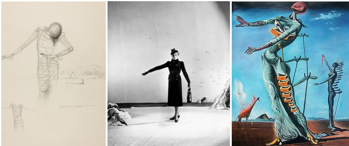
Figuras 4 e 5 - Desenho de Salvador Dalí do Armário Antropomórfico e Fato-gaveta de Elsa Schiaparelli, inspirado no primeiro (1936)

Por outro lado, no atual site da Maison Schiaparelli encontramos uma secção inteiramente dedicada ao percurso da designer e às suas colaborações com os vários artistas, na qual podemos inferir que a influência do artista nas criações da designer parece ser mais profunda. De acordo com o site (2016a), em 1936, Salvador Dalí terá enviado um desenho a Schiaparelli com uma descrição na qual o artista referia um possível fato com gavetas semirrígidas e macias. Este desenho não só deu origem a vários casacos e fatos com bolsos a simular as tais gavetas - alguns utilitários, outros apenas decorativos -, apresentados na coleção de alta-costura de 1936/1937 de Schiaparelli; como pode também ter servido de primeiro esboço ou inspiração para o quadro The Burning Giraffe , que Dalí produziu no ano seguinte.