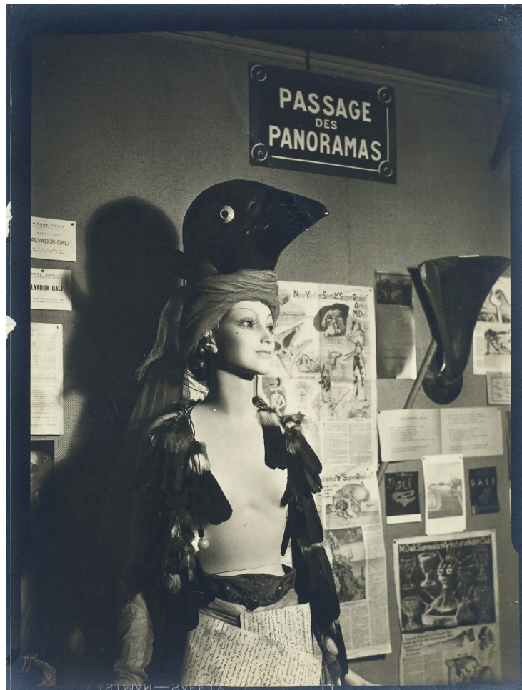
Figura 2 - Manequim de Salvador Dalí na Exposição Internacional do Surrealismo (1938)

Prudente (2017) mostra como esta exposição foi um marco importante na carreira da designer, que expõe as suas criações em conjunto com objetos artísticos pela primeira vez, colaborando com Dalí num manequim para a Rua dos Manequins, o espaço mais fotografado e falado da exposição 46 .