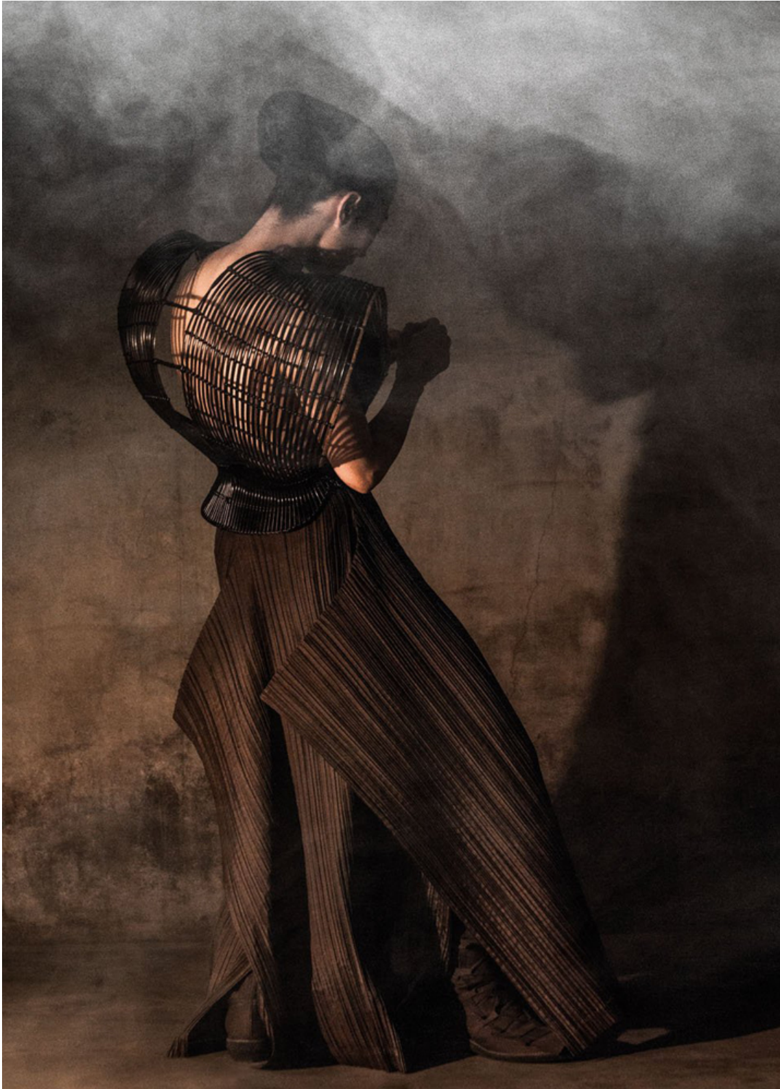
Figura 14 - Corpete de Vime e Saia de Nylon de Issey Miyake (1982)

cumulativa; estabelecendo, à semelhança de outras formas artísticas, um diálogo entre o passado e o futuro 66 .