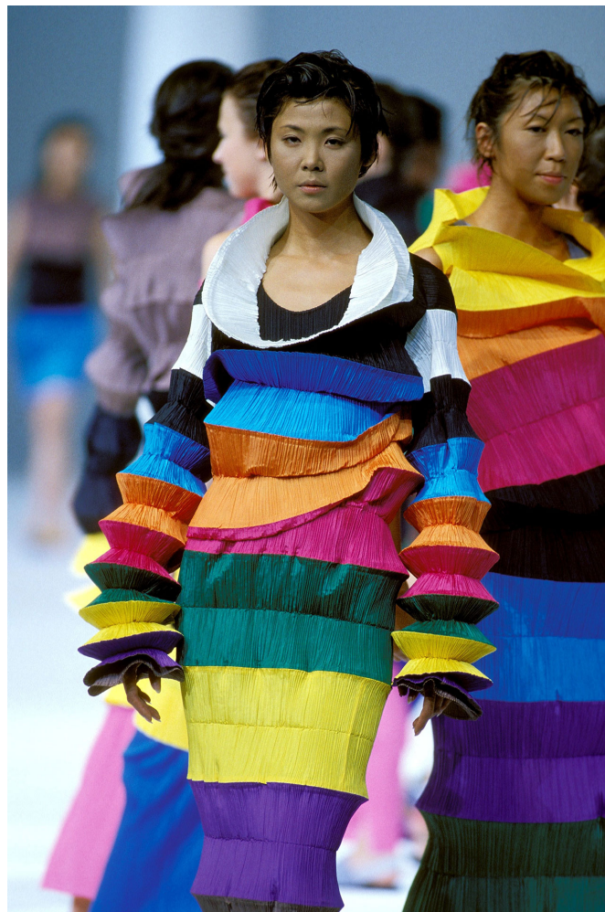
Figura 12 – Coleção de primavera/verão de 1994, Pleats, Please , de Issey Miyake

Um dos melhores exemplos da combinação da tradição com a tecnologia por parte do designer foi a coleção de primavera/verão de 1994, Pleats, Please , que deu início a um dos segmentos mais conhecidos do Miyake Studio e que continua a desenvolver-se até hoje. Nesta coleção, bem como no conseqüente segmento da marca, Issey Miyake recriou a técnica do plissado grego, continuando o estudo que Mariano Fortuny 60 tinha feito no início do século XX. De acordo com English (2011), contudo,