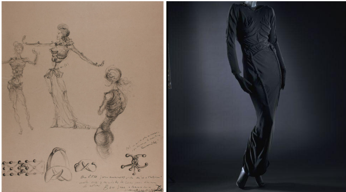
Figuras 7 e 8 - Desenho da Mulher Esqueleto de Salvador Dalí e Vestido Esqueleto de Elsa Schiaparelli, inspirado no primeiro (1938)

O vestido esqueleto é todo ele feito num crepe de seda fino, flexível, elegante e quase transparente. A escolha do material tornou-se particularmente importante pela modelagem do próprio vestido que, por ser tão justo ao corpo, requer uma certa elasticidade que o torne mais confortável e contribua para a silhueta comprida, esguia e sensual da peça.