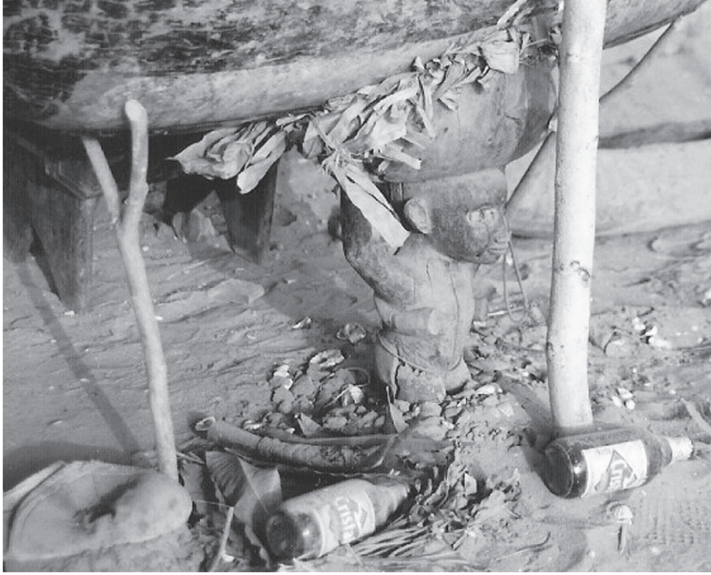
↑ Fig. 2. Le kumbonki sur l'oreté (Bijante, Bubaque)