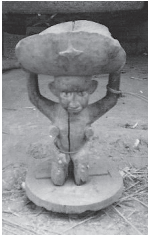
→ Fig. 3. L'oreté kumbonki (Bijante, Bubaque)