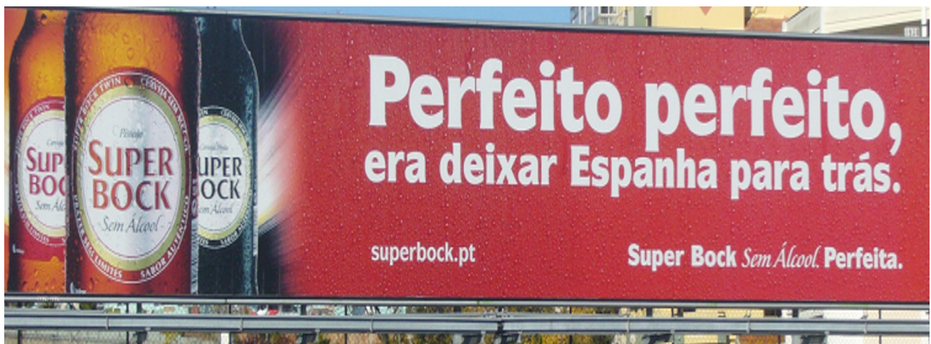
Figura 3 - Fotografia de um grande outdoor que esteve colocado apenas na Avenida dos Combatentes (onde está situada a Embaixada espanhola) enunciando «Perfeito, perfeito, era deixarmos Espanha para trás».