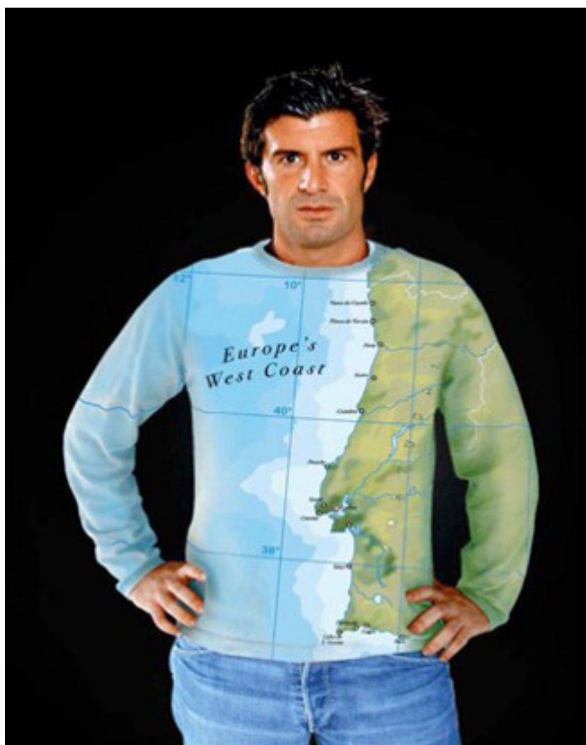
Figura 7 - Imagem do internacionalmente conhecido jogador de futebol português, Luís Figo, usando uma t-shirt em que aparece a representação da costa portuguesa como a "Europe's West Coast".