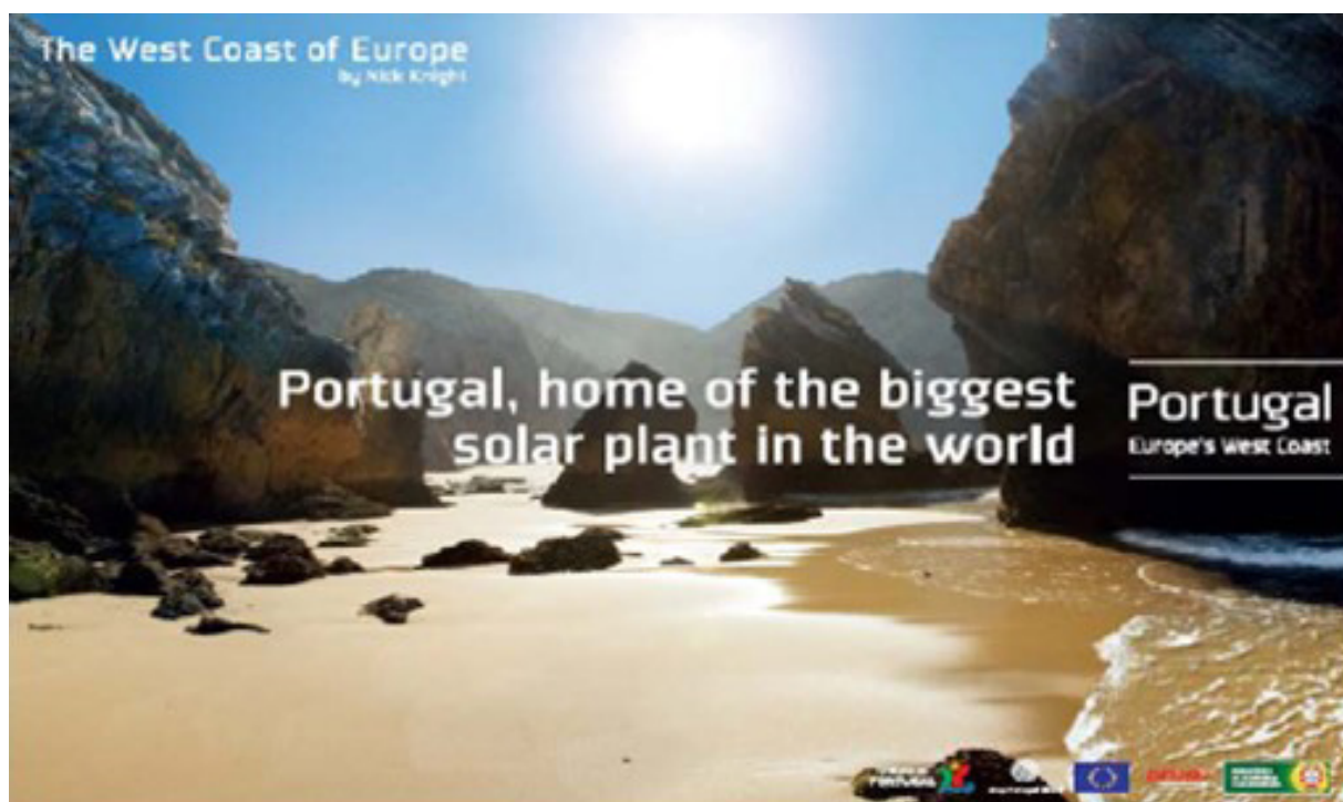
Figura 5 - Cartaz que apresenta Portugal como a “ Europe’s West Coast ” e que usa como imagem de fundo uma das maravilhosas praias da costa portuguesa.