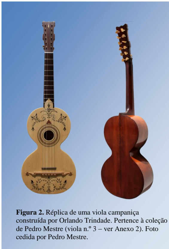
Figura 2. Réplica de uma viola campaniça construída por Orlando Trindade. Pertence à coleção de Pedro Mestre (viola n.º 3 – ver Anexo 2).

peça em madeira colada ao braço ou integrada neste, geralmente com 12 orifícios para colocar as cravelhas; as cravelhas são de madeira e estão inseridas na parte anterior do cravelhal, podendo variar em número (10 ou 12); o cavalete fixo é construído com madeira rija, de pereira, noqueira ou pau-santo, com entalhes na base por onde passam as cordas e tem na parte superior parafusos de metal (5 ou 6 parafusos), que servem para prender as cordas (dos dois lados do cavalete, e colados a este, estão os «bigodes», com função decorativa, finalizados geralmente por uma estrela); o cavalete móvel é feito em madeira rija ou em osso e tem a função de regular a distância entre as cordas e os trastes; a pestana é feita em madeira rija ou osso, tem como função guiar as cordas entre