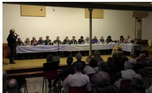
Figura 6 - XXVI Encontro de Tocadores de Viola Campaniça e Cantadores de Despique e Baldão durante a Feira de Castro 2016

O auditório do Fórum Municipal foi preparado para receber o evento da seguinte forma: foi colocada uma mesa composta pela junção de várias mesas juntas, encostada ao fundo da sala, estendida sob o comprimento desta e que ocupava a quase totalidade da parte elevada do auditório (Fig. 6). Sob a mesa, coberta com uma toalha aos quadrados azuis e brancos, estavam seis jarros com vinho, vários pratos com petiscos, garrafas de água, cerca de 20 copos de vinho e alguns guardanapos e/ou pratos. No canto direito da mesa, e à frente desta, foi colocado um sofá, coberto por uma manta, com uma viola campaniça (modelo antigo), um chapéu preto e um lenço vermelho por cima. Ainda do lado direito, estão duas ovelhas e entre elas está uma manta no chão e uma viola campaniça (modelo antigo) em cima. Foi colocada mais uma viola campaniça nos degraus do “palco” ao centro da sala. O espaço remanescente (a maior parte da sala) está ocupado pelo público, sentado em cadeiras e virado para a mesa (ver DVD filme 2).