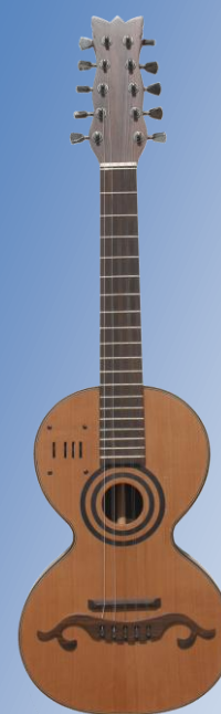
Figura 4. Viola campaniça semiacústica, construída por João Pessoa, de Olhão. Pertence à coleção de Pedro Mestre (viola n.º 23 – ver Anexo 2).