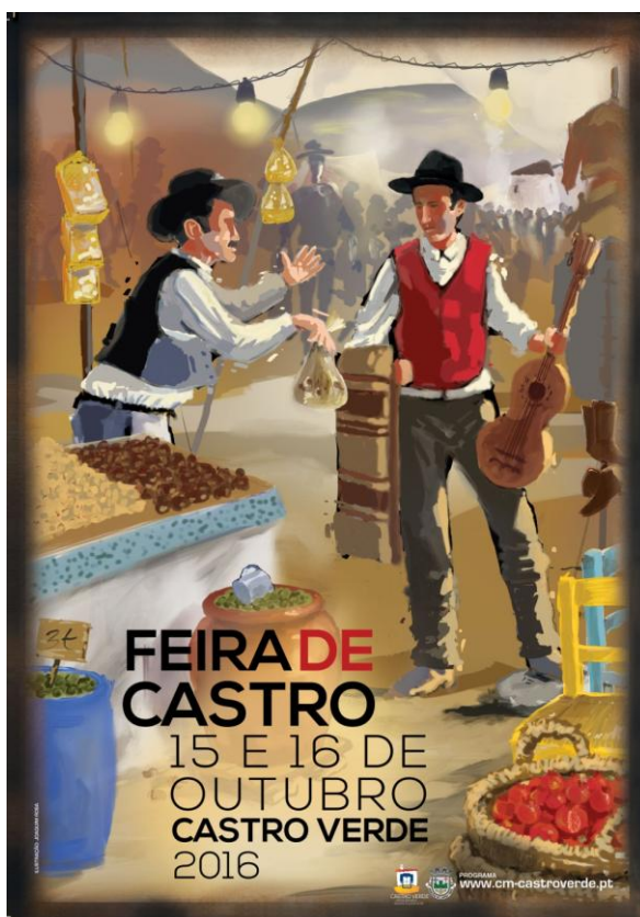
Figura 5 - Cartaz da Feira de Castro 2016 da autoria de Joaquim Rosa

Castro 2016”) na noite do dia 14 (sexta-feira), às 21h30, no Cineteatro Municipal de Castro Verde, com entrada livre. Os momentos performativos aqui em análise consistem nas atuações do Grupo de Violas Campaniças e do grupo “3 Vozes à Campaniça – Vitorino, Janita Salomé e Pedro Mestre” no Espetáculo da Feira de Castro 2016 e no XXVI Encontro de Tocadores de Viola Campaniça e Cantadores de Despique e Baldão.