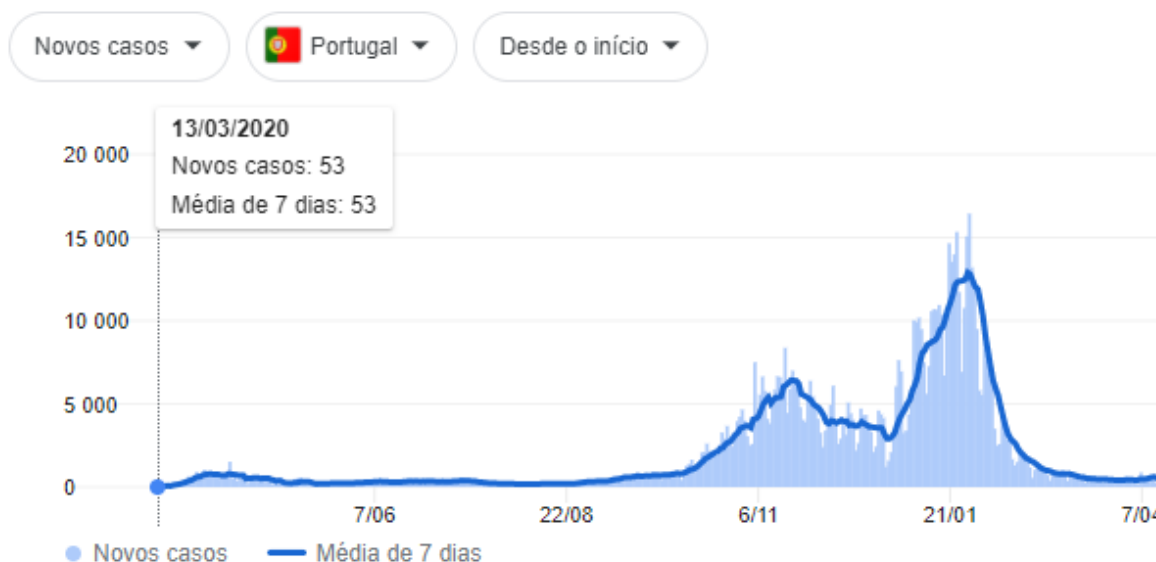
Figura 2 Gráfico de casos COVID-19 em Portugal

Como o gráfico brasileiro não apresenta muitas nuances, é difícil usar apenas esta informação como parâmetro para dividir as fases. Também não há como sobrepor um gráfico ao outro porque os dois países adotaram medidas distintas na contenção da pandemia. Então, recorri aos três principais objetos de estudos do meu trabalho: “The Spectacular Cabaret Fest 2020” (estreou em 07 de maio de 2020), “Beco da Serpente” (estreou em 28 de junho de 2020) e “Cabaré Voltei: A grande revista eletrônica” (estreou em 16 de agosto de 2020). Este último projeto utilizou recursos diferente dos dois primeiros trabalhos e aproximou-se muito da experiência de um cabaré ao vivo 23 . Portanto, utilizei este projeto como parâmetro para dividir o surgimento do cibercabaré em duas fases: