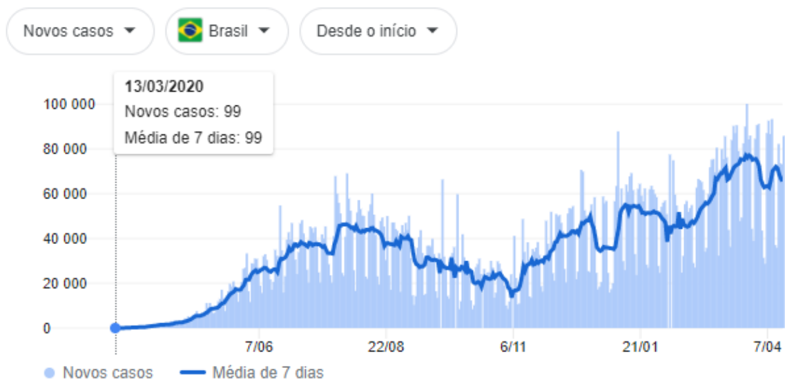
Figura 1 Gráfico de casos COVID-19 no Brasil

mas seguiu-se sempre uma crescente conforme o gráfico a seguir (Johns Hopkins University, s.d.).