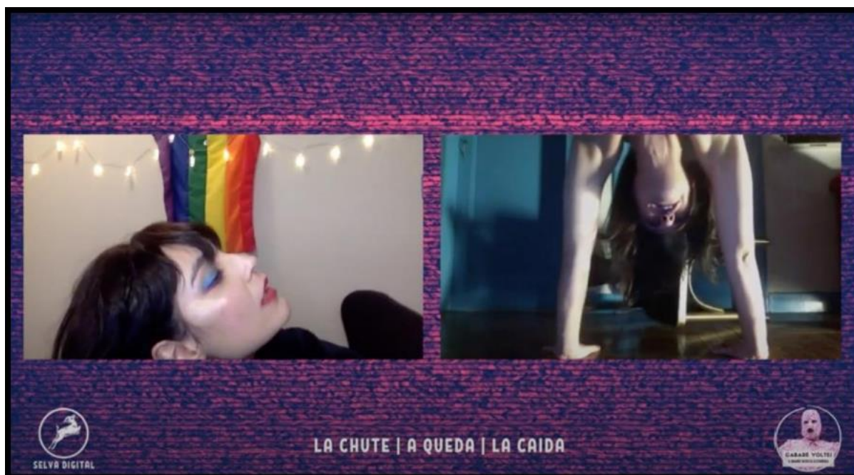
Figura 5 Espetáculo Cabaré Voltei

mais uma apresentação. Durante todo o cabaré, o público e os performers interagiam pelo chat do Youtube .