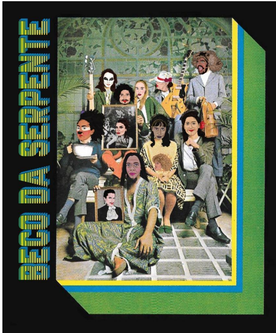
Figura 3 Capa podcast “Beco da Serpente”

A ideia da apresentação no ciberespaço surgiu devido a dois estímulos: primeiro, o grupo queria fazer alguma performance no dia 28 de junho para celebrar um ano da estreia do Beco da Serpente; e segundo, havia uma série de questões contemporâneas que precisavam de reflexão crítica, como os desastres ambientais 30 e as crises políticas causadas pela pandemia 31 . A motivação de fazer um cabaré em formato de podcast surgiu de um dos integrantes do grupo, Filipe Félix, que recordava o seu pai a ouvir teatro no rádio. Além disso, Thiré é crítica ao