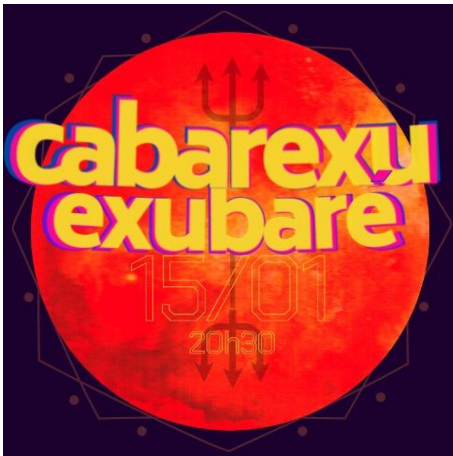
Figura 8 Divulgação Cabarexú exubarÉ

leram as declarações enviadas. A performance aconteceu no dia 15 de janeiro de 2021 (xuxu, 2021) e foi gratuita.