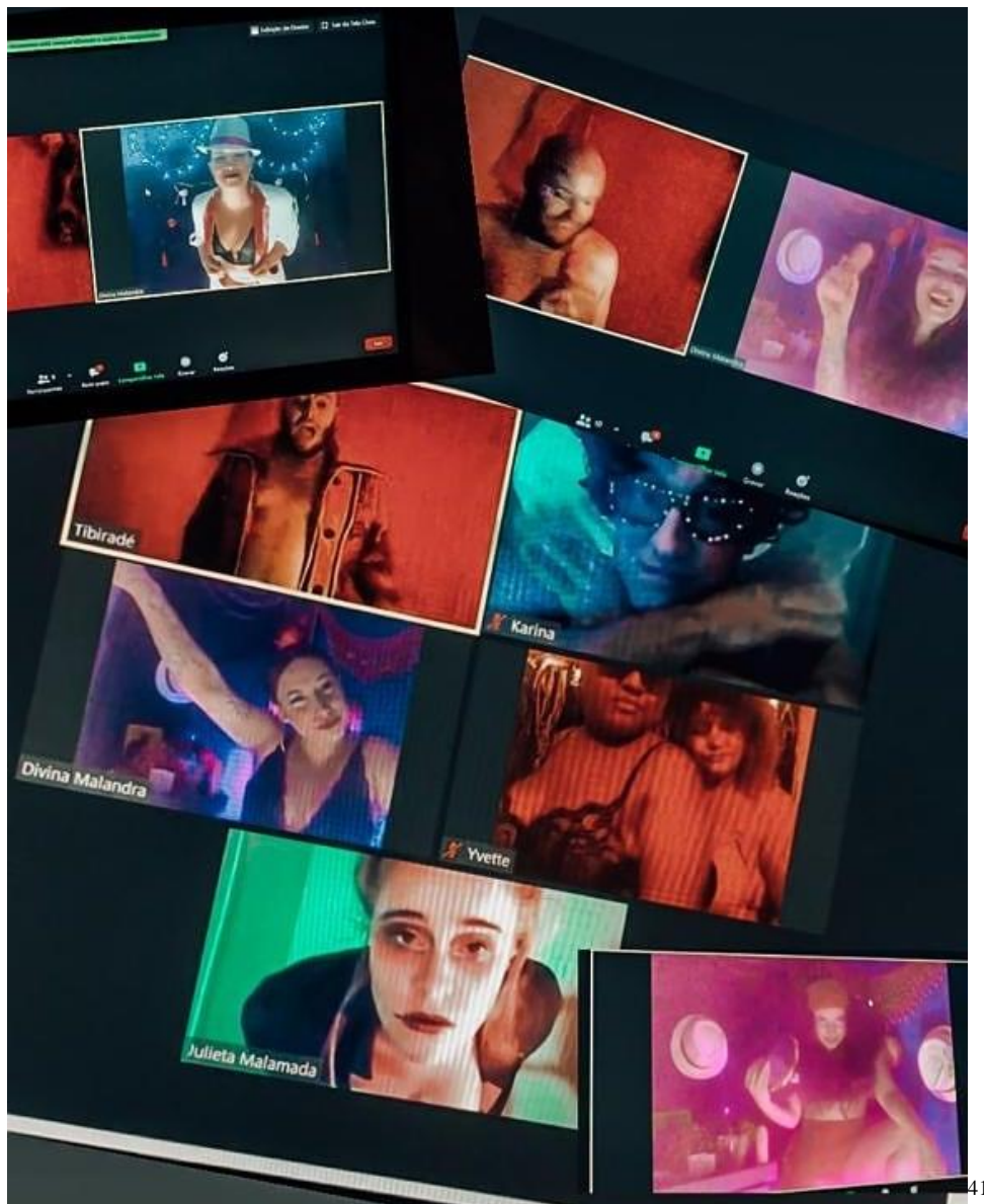
Figura 7 Publicação Instagram Cabaré Incoerente

Por fim, o terceiro e último destaque é “Cabarexu exubarÉ”, cabaré feito por artistas independentes da região conhecida como Baixada Fluminense, no Rio de Janeiro. As performances aconteceram no Zoom e durante toda a noite os mestres de cerimónia incentivavam o público a ligar a câmara. Assim como os outros exemplos, os performers apresentaram-se a partir das suas casas, também elas decoradas, para parecer um ambiente diferente. Foi feita uma performance chamada “Correio de amor”, em que o público enviava, durante o cabaré, mensagens aos mestres de cerimónia com declarações de amor para serem entregues a algum performer ou alguém do público. No fim do cabaré, os mestres de cerimónia