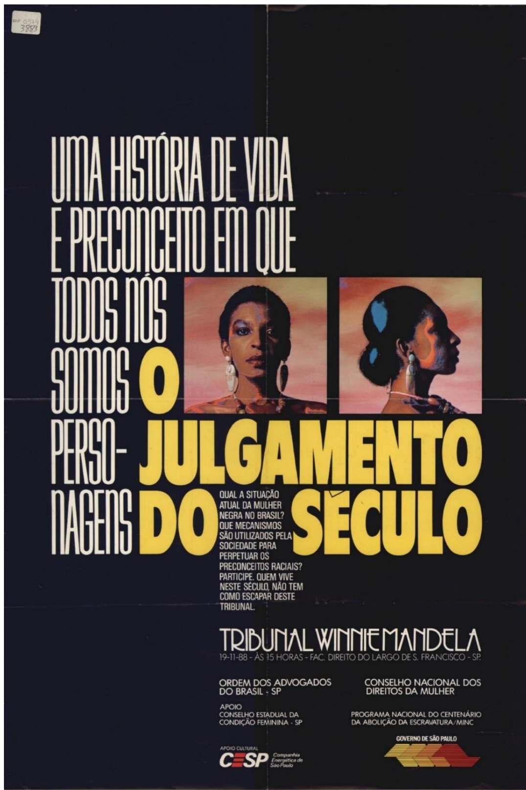
Figura 1 Cartaz informativo sobre o Tribunal Winnie Mandela.