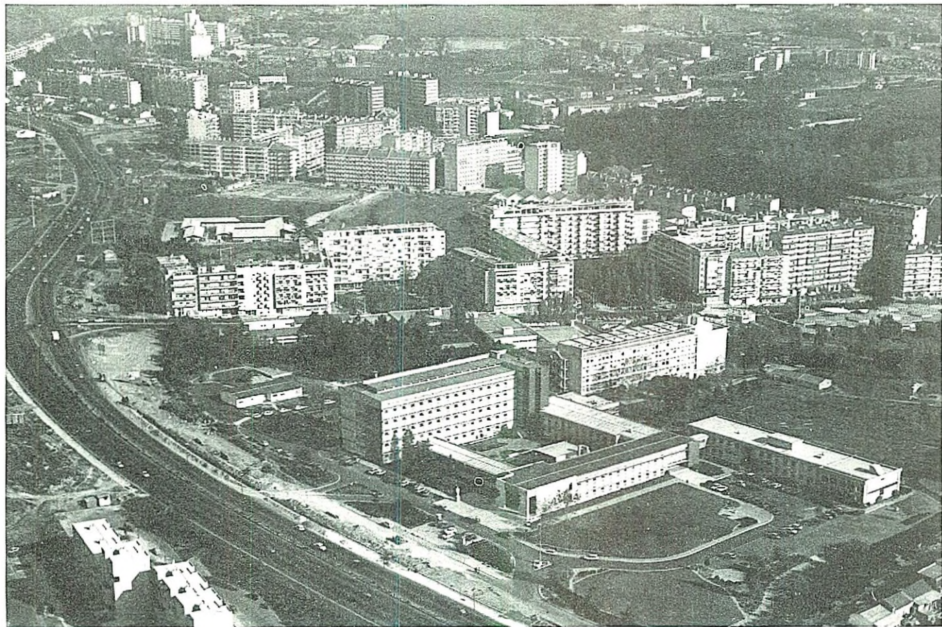
Vista aérea do conjunto do Instituto Nacional de Saúde, Dr. Ricardo Jorge e Escola Nacional de Saúde Pública.

10. Na segunda sessão plenária, a Assembleia Geral votou, por unanimidade, a proposta para que o Congresso de 1957 se realizasse em Lisboa, em data e com tema a fixar oportunamente.