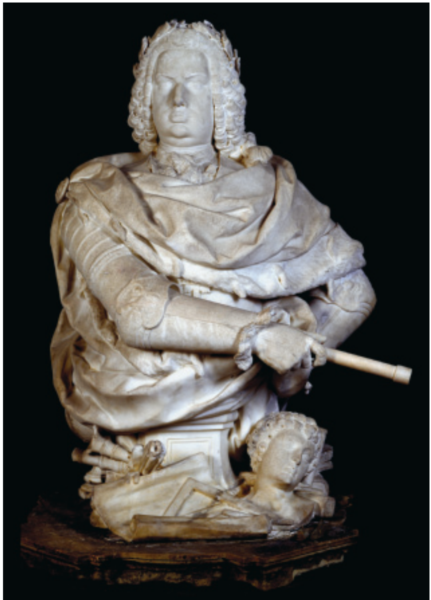
FIG.9 ALESSANDRO GIUSTI, BUSTO DE D. JOÃO V (MAFRA, PALÁCIO NACIONAL).

Mas que, simbolicamente, quis legar-se à posteridade no papel de protector das letras, artes e ciências, figuradas na panóplia que rodeia a base, em óbvia sintonia