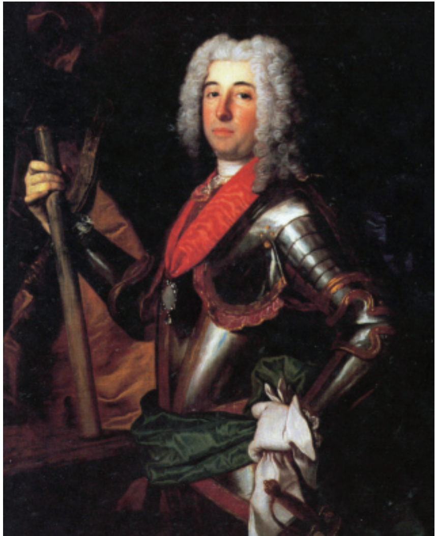
FIG.8 JEAN RANC, RETRATO DO INFANTE D. FRANCISCO DE BRAGANÇA (MADRID, PALÁCIO REAL).