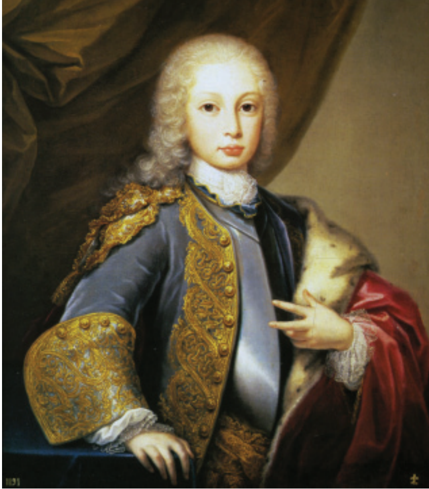
FIG.3 DOMENICO DUPRÀ, RETRATO DO PRÍNCIPE DO BRASIL, D. JOSÉ DE BRAGANÇA (MADRID, MUSEU DO PRADO).