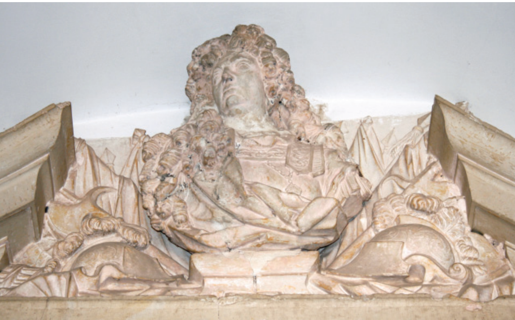
FIG.1 CLAUDE LAPRADE, BUSTO D. PEDRO II (COIMBRA, GERAIS DA UNIVERSIDADE).