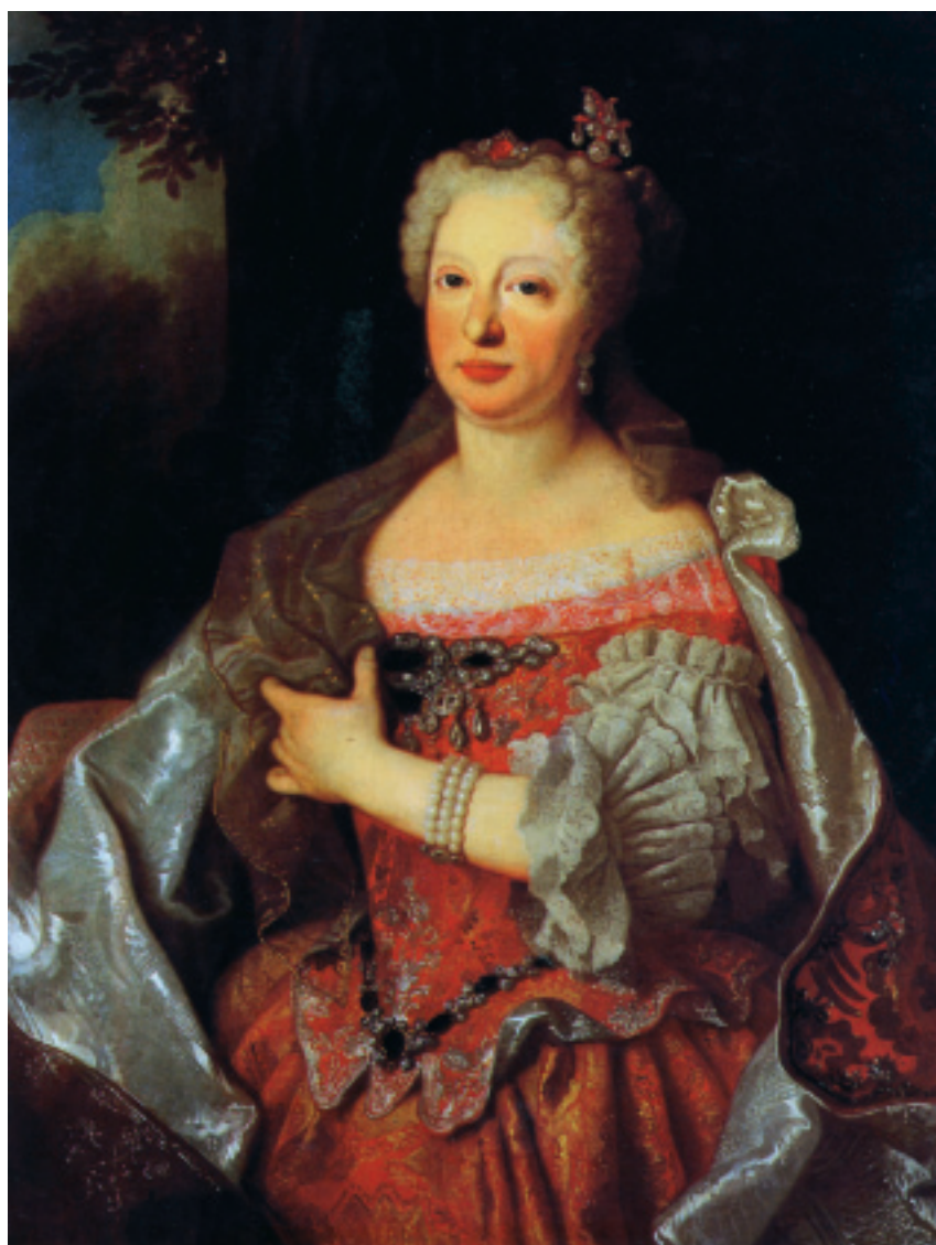
FIG.7 JEAN RANC (CÓPIA), RETRATO DE D. MARIA ANA DE ÁUSTRIA (LISBOA, MUSEU DOS COCHES).

sendo o do Magnânimo , em particular, nos anos que se seguem, convertido em vera efigie de uso oficial: seja em variantes de meio corpo (Torre do Tombo, Museu da Cidade de Lisboa, etc.), seja em adaptação de corpo inteiro, como o que incorpora a galeria régia da Sala dos Capelos da Universidade de Coimbra. Operação essa à qual, abalado Duprà em 1730 e morto Quillard em 33, não serão porventura estranhos, tanto a inexistência de alternativa eficaz local (que as sempre citadas palavras da nova Princesa do Brasil, D. Mariana Vitória, a sua mãe, desse ano, testemunham: ao responder, sobre o quesito de um pintor que fizesse o seu retrato, “não há ago-