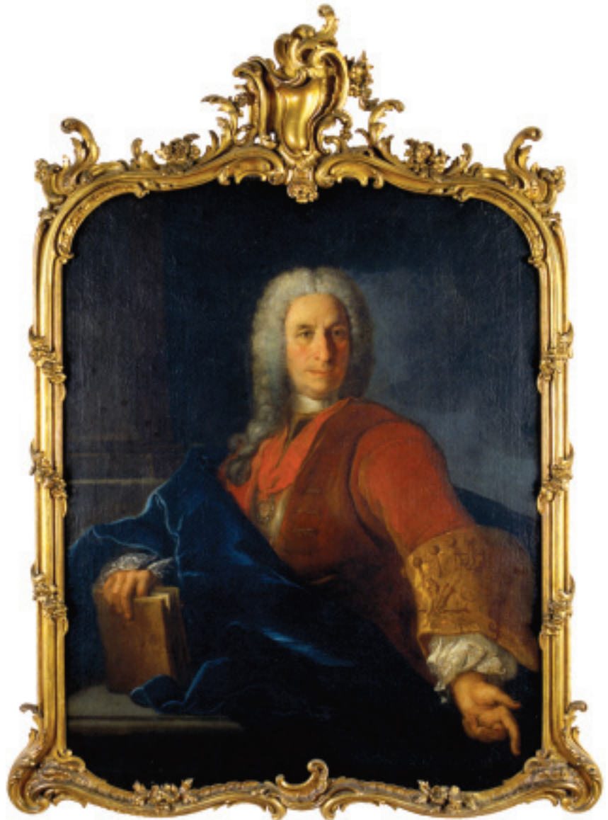
FIG.6 PIERRE-ANTOINE QUILLARD, RETRATO DO ENGENHEIRO-MOR MANUEL DE AZEVEDO FORTES (MAFRA, PALÁCIO-NACIONAL).