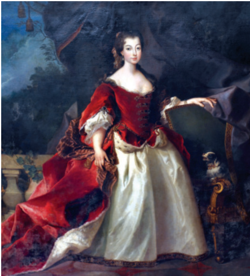
FIG.4 DOMENICO DUPRÀ, RETRATO DA INFANTA D. ISABEL LUÍSA JOSEFA DE BRAGANÇA (VILA VIÇOSA, PAÇO DUCAL, SALA DOS TUDESCOS).