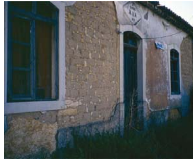
Fig. 2 – Degradação de parede de adobe após abandono de manutenção do revestimento

rapidamente os efeitos das acções climáticas. No extremo oposto encontram-se as construções militares que, quer pelo facto de usarem técnicas mais sofisticadas – como, por exemplo, a chamada taipa militar -, quer em consequência da geometria e espessuras das alvenarias, conseguem aguentar muito tempo mesmo sem manutenção adequada.