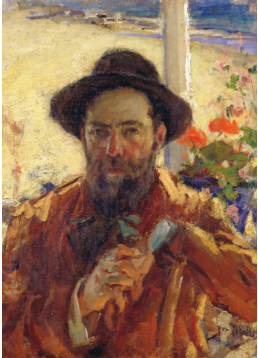
FIG.6 JOSÉ MALHOA - ROQUE GAMEIRO , 1904 (MUSEU JOSÉ MALHOA), © IMC/DDF.

é a do Luminismo, cujas origens remontam pelo menos a 1895, data do excelente retrato da sua discípula Zoé Wauthelet, aos 28 anos de idade.