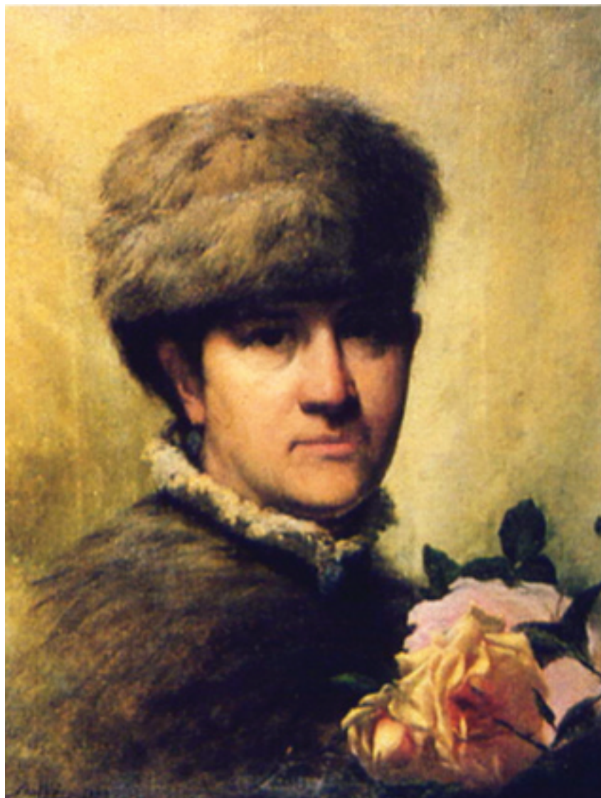
FIG.2 JOSÉ MALHOA - JÚLIA MALHOA , 1883 (MUSEU JOSÉ MALHOA), © IMC/DDF.

A sua primeira encomenda data de 1881, quando Malhoa é convidado, com Eugénio Cotrim, a decorar o tecto do Real Conservatório de Lisboa. Para além da deslavada alegoria que ocupa o medalhão central, figurando Euterpe, o pintor executa 4 medalhões circulares, “retratando” Almeida Garrett, (Fig.1) Domingos Bomtempo, Francisco Xavier Migoni, e Passos Manuel. Naturalmente fazendo recurso a gravuras que circulavam na época, quer na sua directa transposição ou servindo de modelo, estas pinturas pouco mais representam do que simples exercícios de academia.