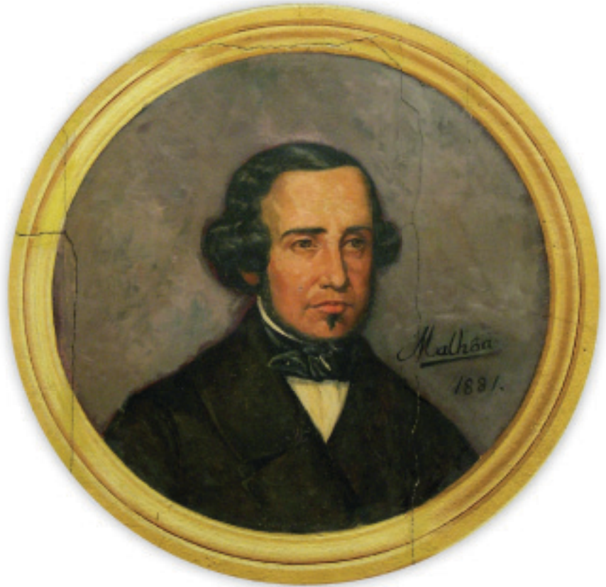
FIG.1 JOSÉ MALHOA - ALMEIDA GARRETT, 1881 (CONSERVATÓRIO NACIONAL)

sucessivas alterações que introduzia nos quadros, a pedido dos retratados. O caso do retrato de Palmira Feijão é um bom exemplo disso. Consoante referia o próprio artista, depois dos ditos “aformoseamentos” o retrato estava tal e qual ela era... “quando tinha 18 anos!” (Saldanha 2006, 403-404).