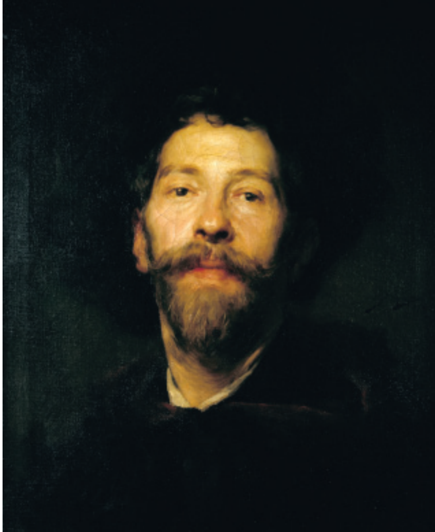
FIG.4 JOSÉ MALHOA - RETRATO DE NOVAIS , 1901 (MUSEU DO CHIADO), © IMC/DDF.