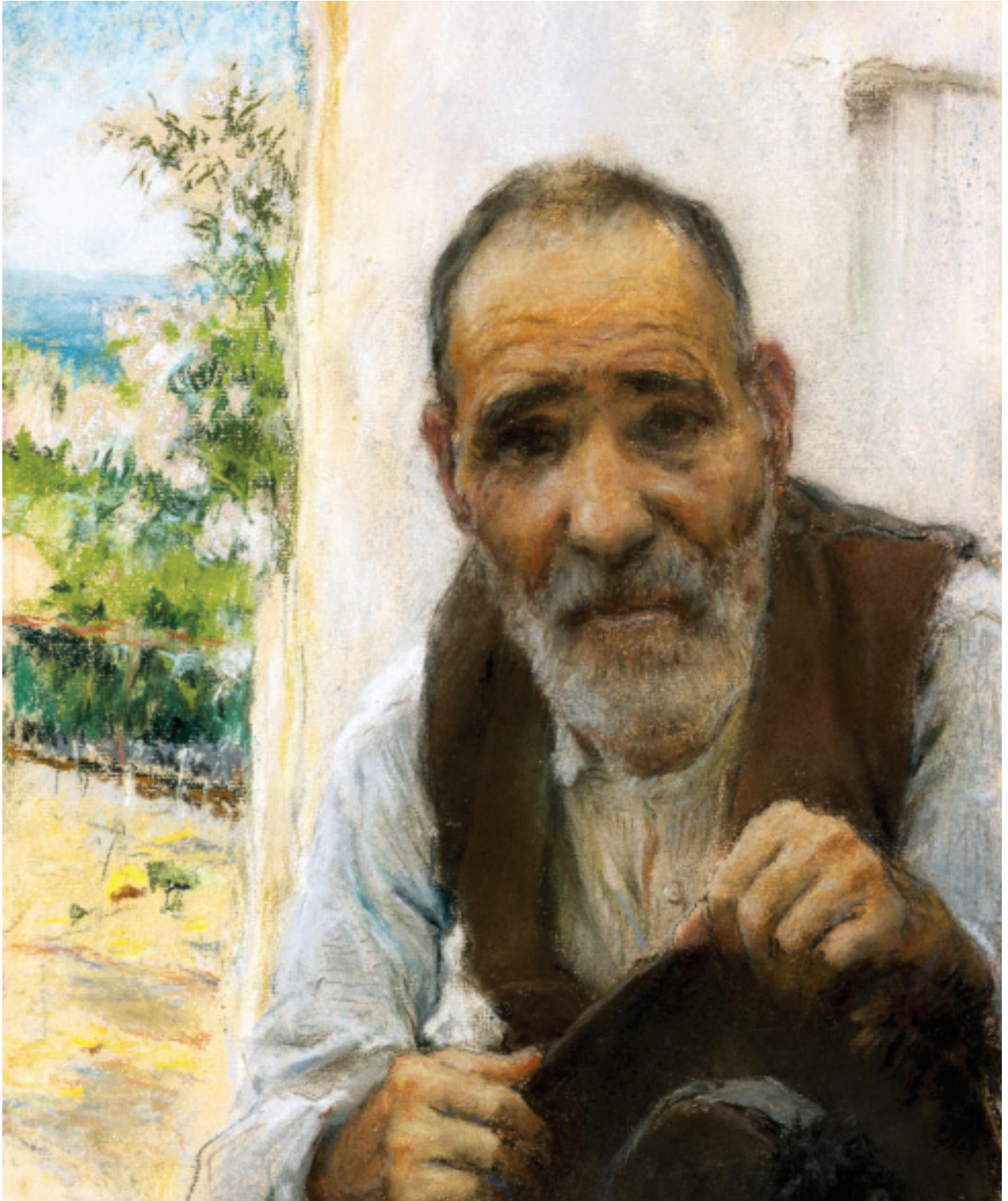
FIG.9 - JOSÉ MALHOA - O VENTURA, 1933 (MUSEU JOSÉ MALHOA), © IMC/DDF.