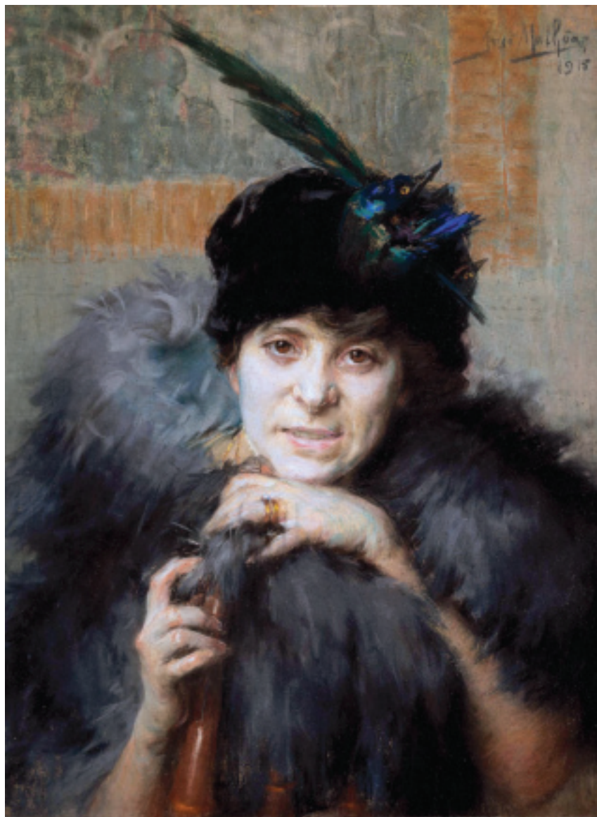
FIG.8 JOSÉ MALHOA - DESALENTO , 1915 (CASA MUSEU FERNANDO DE CASTRO, PORTO).

psicológico”, ou Leon Bonnat (1833-1922), e a sua pintura de introspecção, de influência espanhola.