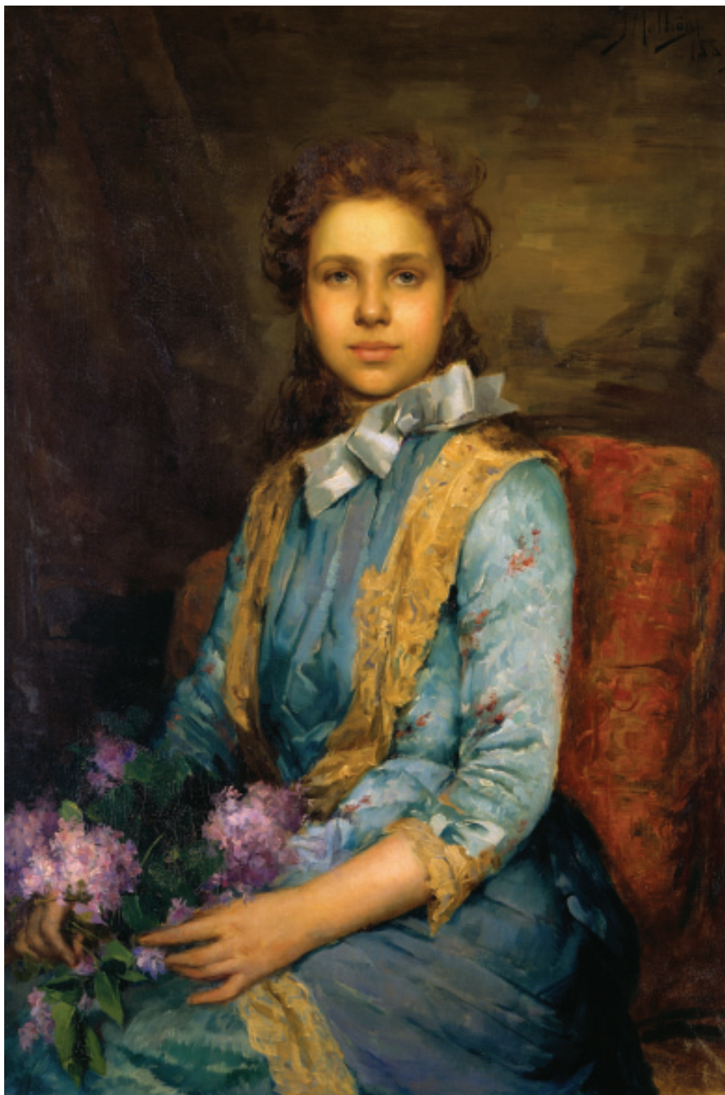
FIG.3 JOSÉ MALHOA - LAURA SAUVINET , 1888 (MUSEU JOSÉ MALHOA)