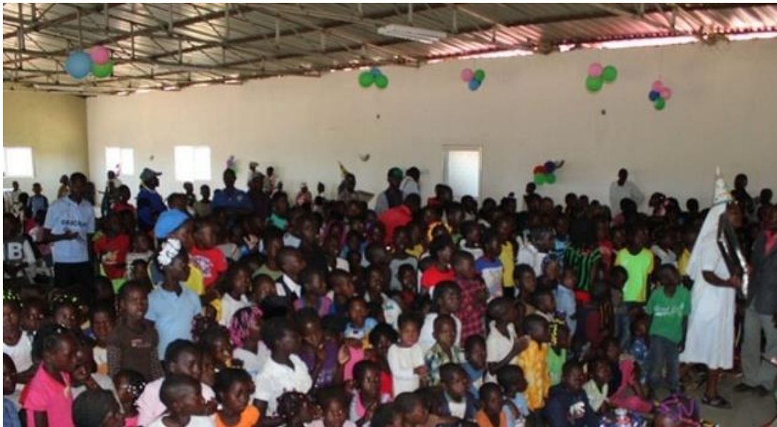
Imagem 04 24