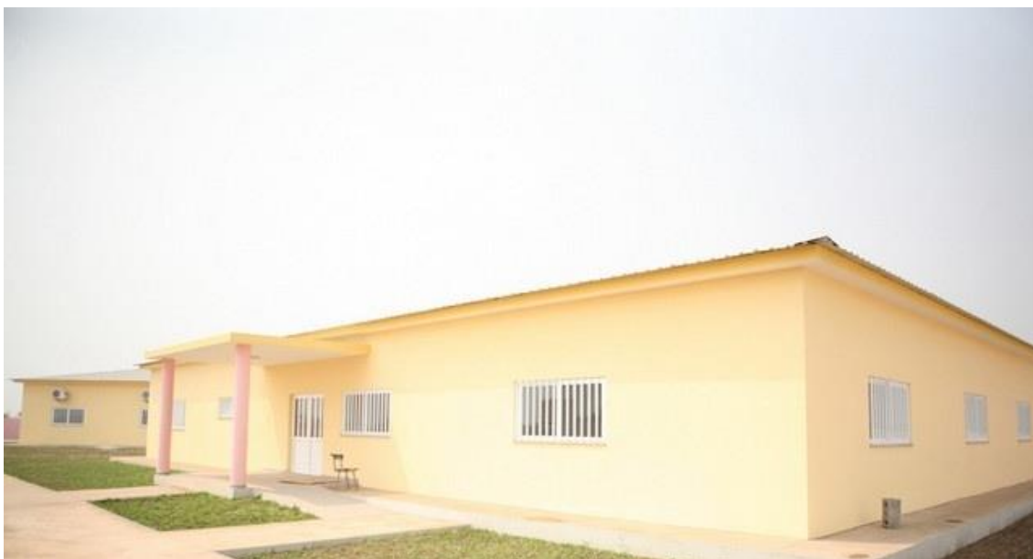
Imagem 08- Estrutura da Direção Provincial da Assistência e Reinserção Social no Lubango 28 .