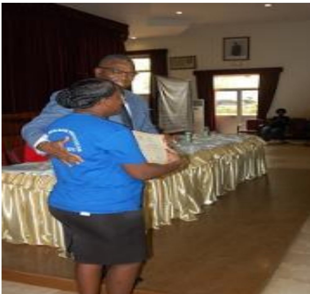
Imagem 09 29 - A imagem a baixo representa a entrega de certificado a um dos técnicos da Escola Nacional de Formação de Serviço Social em Luanda.