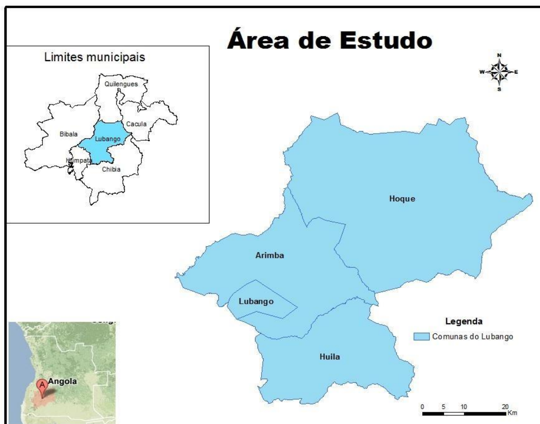
Figura nº1: Mostra a delimitação geográfica da cidade