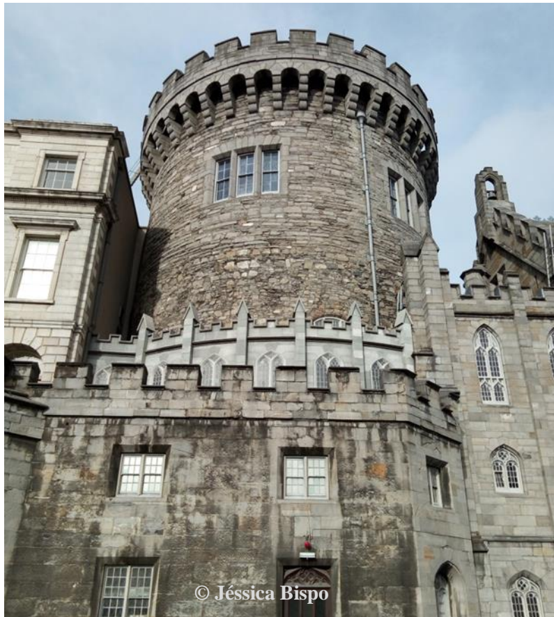
Figura 12 – Uma das torres do Castelo de Dublin, onde Bram Stoker trabalhou como funcionário público.