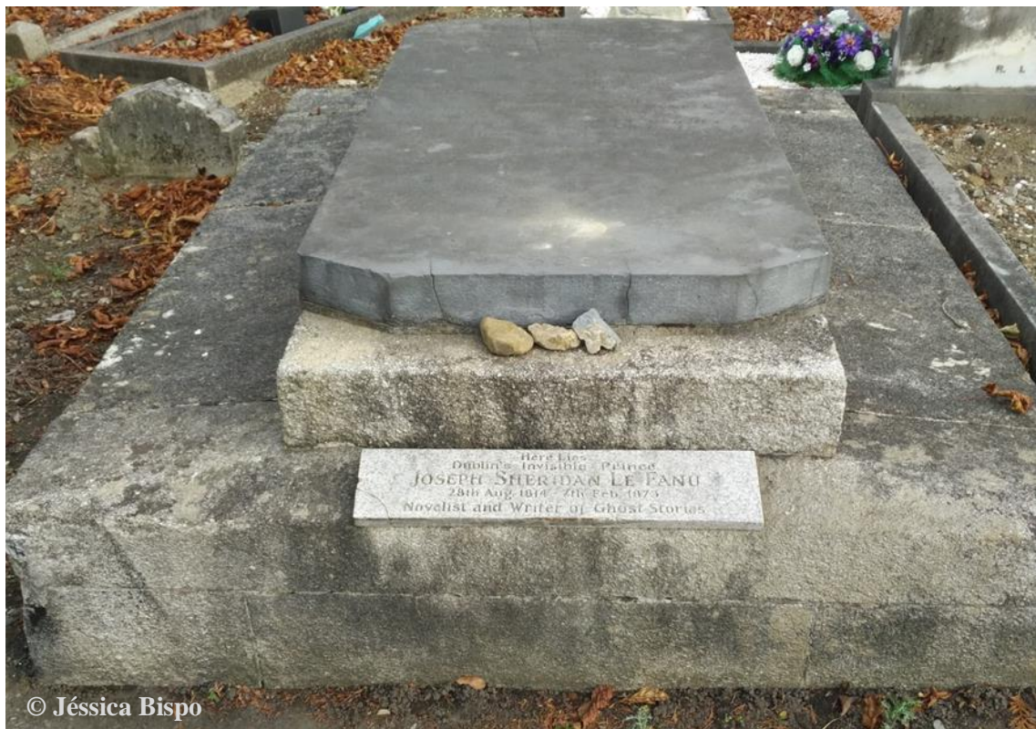
Figura 5 - Sepultura de Joseph Sheridan Le Fanu no Cemitério Mount Jerome em Dublin. Na inscrição é possível ler: “Here Lies Dublin’s Invisible Prince Joseph Sheridan Le Fanu; 28th Aug. 1814 – 7th Feb. 1873; Novelist and Writer of Ghost Stories”.