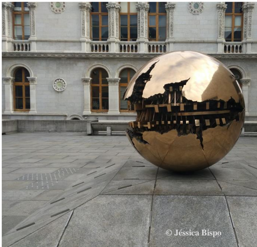
Figura 7 - Escultura localizada no campus do Dublin Trinity College. Joseph Sheridan Le Fanu, Bram Stoker ou Oscar Wilde são algumas personalidades que frequentaram esta universidade.