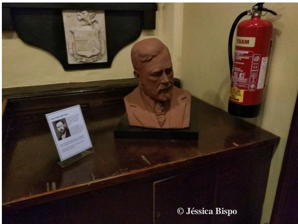
Figura 11 - Busto de Bram Stoker na Igreja de St. Ann, Dublin.