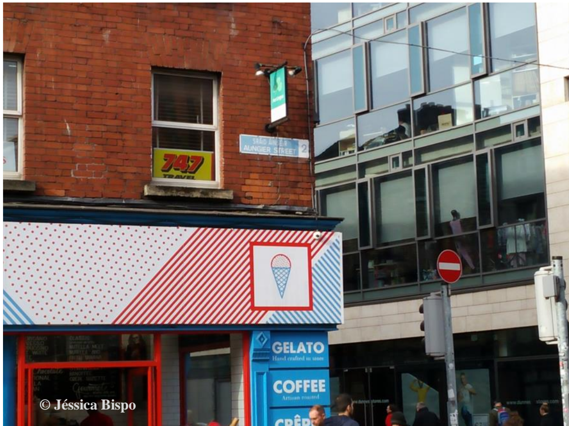
Figura 4 - Placa identificativa em Aungier Street, local retratado no conto “An Account of Some Strange Disturbances in Aungier Street” (1851) de Joseph Sheridan Le Fanu.