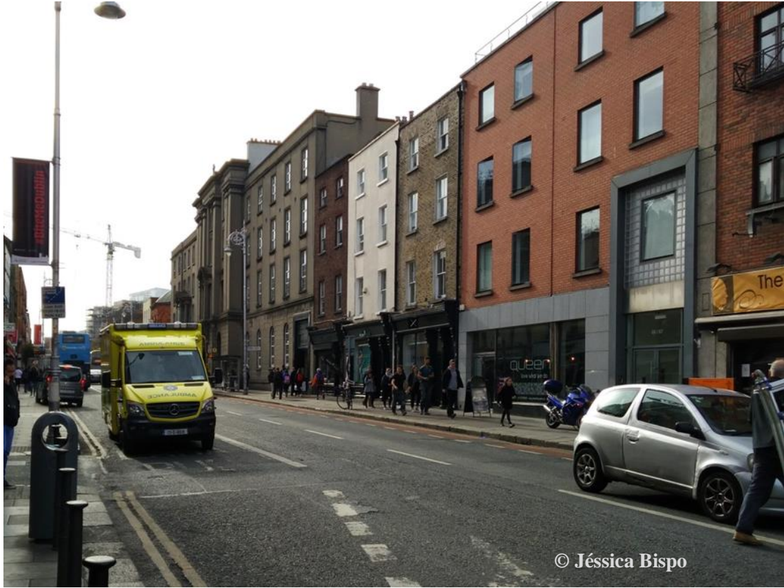
Figura 2 - Inscrição que pode ser lida actualmente naquela que foi a última morada de Joseph Sheridan Le Fanu.