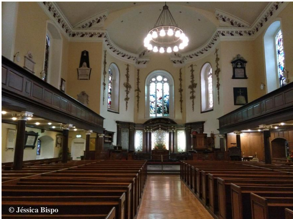
Figura 10 - Interior da Igreja de St. Ann, Dublin.