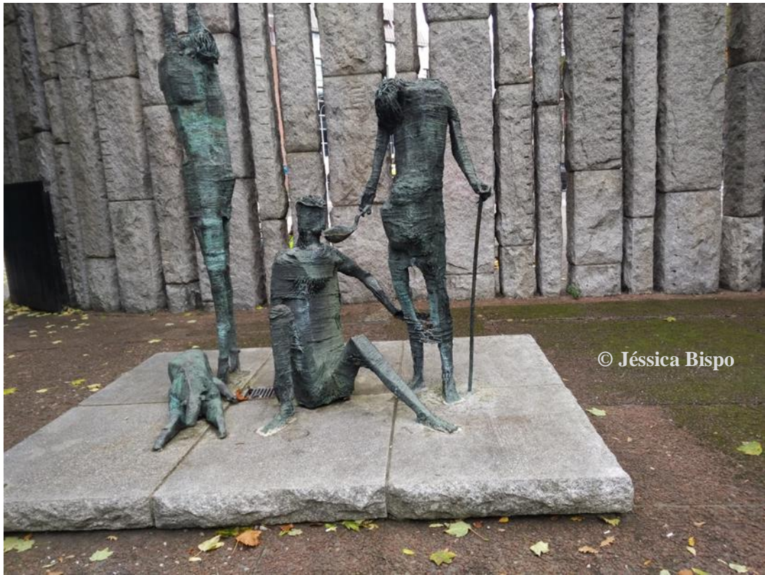
Figura 6 - Famine Memorial, Dublin. Uma das diversas esculturas encontradas na capital da Irlanda realizadas em homenagem às vítimas da Grande Fome de 1845-1849.