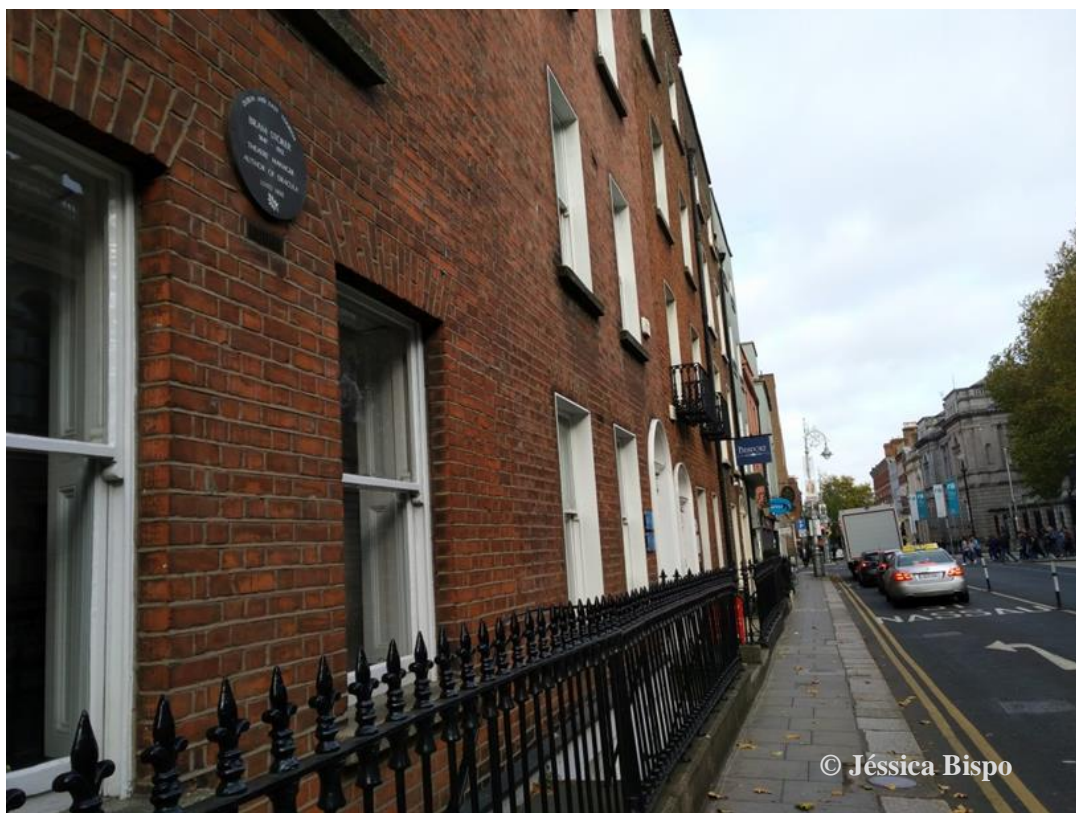
Figura 15 – Kildare Street, Dublin.