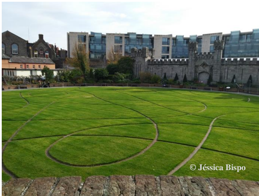
Figura 13 – Jardins do Castelo de Dublin.