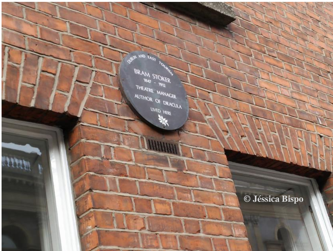
Figura 14 - Inscrição que consta actualmente naquela que foi a residência de Bram Stoker em Kildare Street, Dublin.