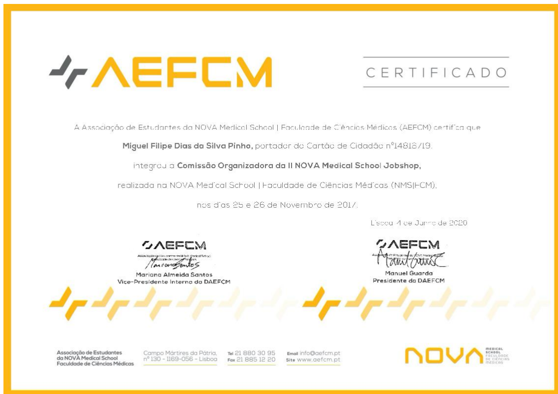
Anexo 3 Certificado de membro constituinte na Comissão Organizadora da NMS Jobshop.