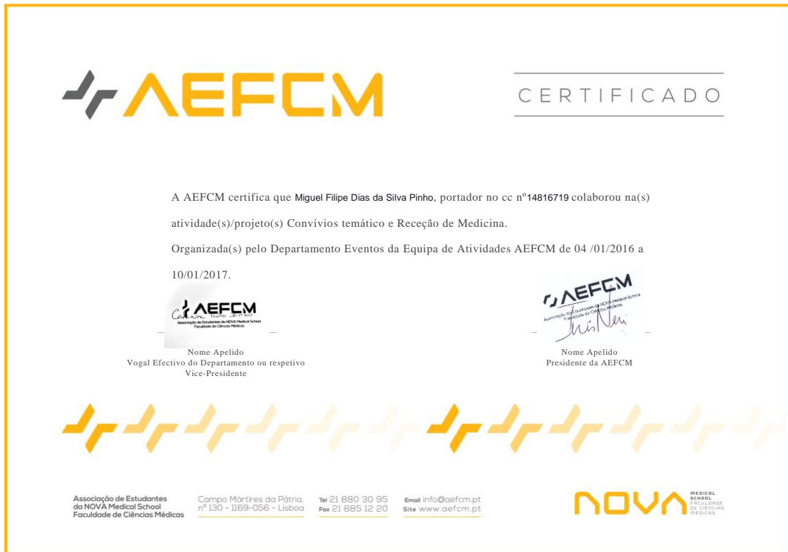
Anexo 2 Certificado de participação na equipa de eventos da AEFCEM | 2016-2017.