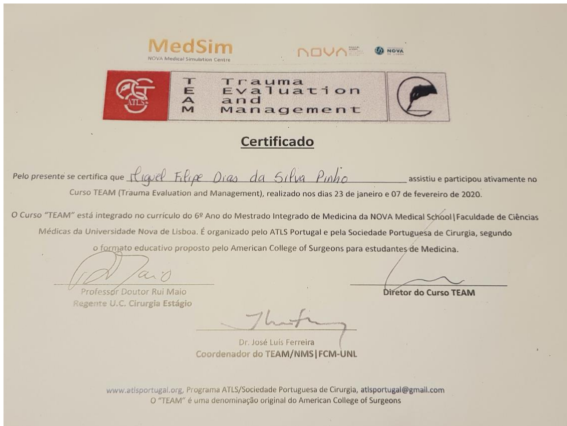
Anexo 14 Certificado de participação no curso TEAM.