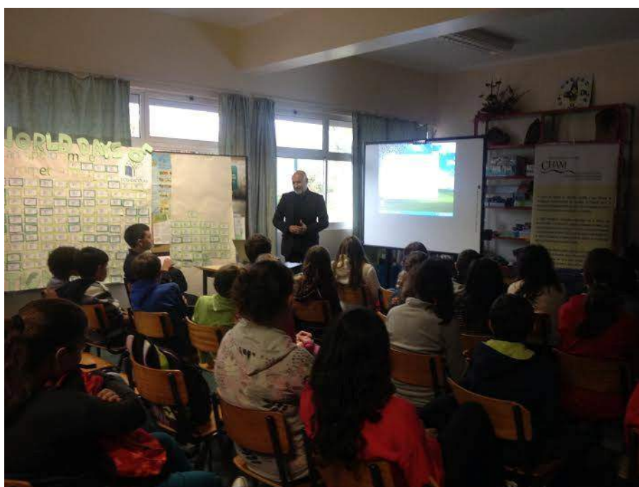
Módulo de Património Cultural.

A História Local principia como base introdutória de ligação, entre as transformações socioculturais locais e as restantes áreas do património que deram origem a que esta localidade se revelasse numa das atrações turísticas de Portugal. Durante os módulos de Património Cultural, introduzem-se os primeiros conceitos e tipos de património, com a apresentação de exemplos presentes no arquipélago açoriano. O principal objetivo passa por sensibilizar o público-alvo para a valorização do património cultural e dar a conhecer alguns princípios de base, tanto teóricos como metodológicos, desta disciplina científica auxiliar do conhecimento histórico. São feitas as primeiras demonstrações da relevância do património cultural como veículo de desenvolvimento regional, enfatizando o valor dos vestígios materiais, das tradições orais e das expressões culturais, com demonstrações práticas recorrendo à viola da terra.