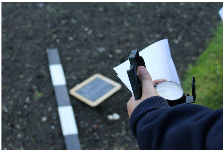
Registo arqueológico durante uma sessão prática do módulo de arqueologia.

Descrever as características físicas distintivas de cada espécie descoberta/recolhida e enquadrar a sua descrição na respetiva cadeia classificativa, com o objetivo de efetuar uma correta catalogação, é o propósito do módulo de “Métodos de Inventário de Património Cultural: material/móvel”. Para além da interação entre os objetos e a noção de “valor patrimonial”, esta etapa do programa pretende ainda, dotar o grupo, de conhecimentos sobre como identificar os principais instrumentos para instauração de um processo de classificação e inventariação patrimonial. Além disso, reforça-se a informação sobre a evolução do conceito de património ao longo da história e neste enquadramento apresentam-se e analisam-se os contextos institucionais e normativos para a salvaguarda do património cultural a nível regional, nacional e internacional, dando a conhecer métodos e sistemas de organização da informação e respetivos planos de classificação. Partindo do princípio que uma das principais características de um bom inventário é a minúcia e pormenores, é fomentado o contacto com contextos de inventário. O exemplo prático passa, por isso, por um contexto de inventário em Artes Plásticas e Artes Decorativas - composto por atividades práticas de preenchimento de fichas de inventário. Nesta fase, a divulgação