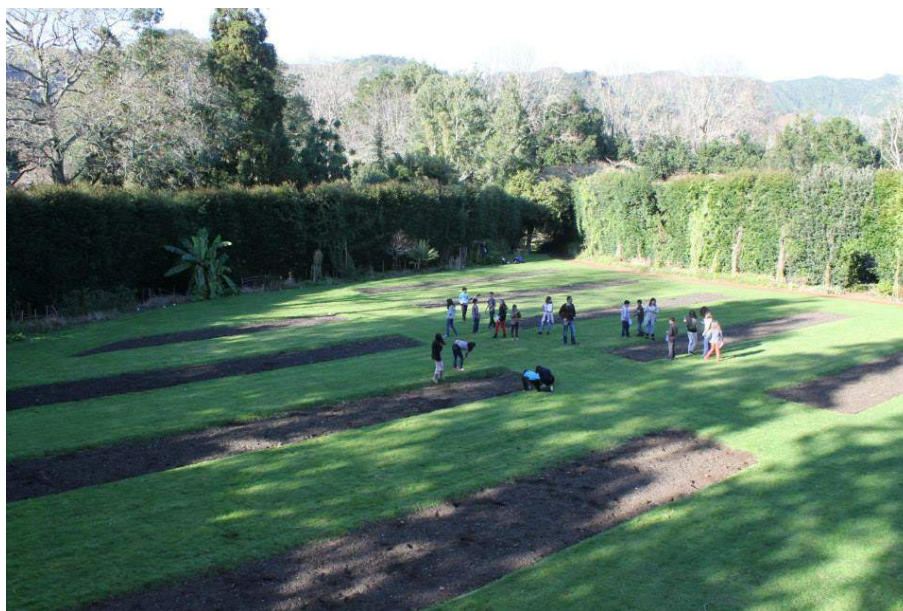
Vista do Parque Terra Nostra no vale das Furnas, durante uma sessão prática do módulo de arqueologia.

Com a aplicação da sessão prática desta disciplina, é possível destacar, ainda, a importância da multidisciplinaridade, recorrendo a exemplos práticos de preparação de projetos através de pesquisa documental, orientação e localização cartográficas (marcação de coordenadas in situ sempre que possível), identificação de características de materiais geológicos, orgânicos e malacológicos (pela recolha de amostras), memória descritiva e registo de achados (elaboração de fichas de sítio descrevendo a envolvente, acompanhada do registo fotográfico do sítio e do achado). Nesta sessão prática, o grupo de trabalho é convidado a participar de uma prospeção para localizar e registar um pequeno conjunto de espólio arqueológico composto por fragmentos de cerâmica e/ou numismático: com recurso a ferramentas e materiais de registo arqueológico; cartografia (carta militar) e meios de orientação em campo (GPS ou apenas orientação cartográfica recorrendo a cálculos de obtenção de coordenadas) e com fotografia aérea. As fichas de sítio, idênticas às utilizadas em projetos de arqueologia, são inicialmente preenchidas em campo e à posteriori, trabalhadas em conjunto, dando lugar à interpretação, à reflexão e ao debate.