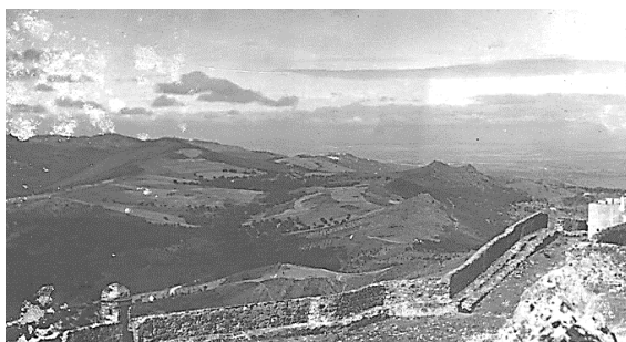
Fig. 2 – Panorâmica dos arredores de Marvão, obtida a partir das muralhas do castelo.

Por vezes as nuvens passam rápidas e encostadas aos telhados. Mas de repente abrem-se e vê-se que por cima estão outras com uma luz deslumbrante. É frequente descerem à terra, ficar cá em cima o castelo cheio de sol no céu azul e, em volta, lá por baixo um mar de nuvens, branco, parado. Então, sopra um vento que, rugindo pela muralha acima, as atira com violência para o céu, em jacto contínuo, como vapor duma caldeira. Mesmo nos dias sem bulir de aragem, atira-se um chapéu para fora da muralha ele volta para trás. (p. 482)