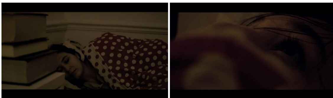
Figura 9: Cena noturna

Se a paisagem muda no filme, sentimos como se fôssemos nós que tivéssemos nos movido. Por isso, os enquadramentos que mudam constantemente dão ao espectador a sensação de que ele próprio se move, da mesma forma que se tem a ilusão de movimento quando um trem na plataforma ao lado começa a deixar a estação. A tarefa verdadeira da arte do cinema é transformar em efeitos artísticos os novos efeitos psicológicos possibilitados pela técnica da cinematografia. (Balázs, 2018, p. 94)