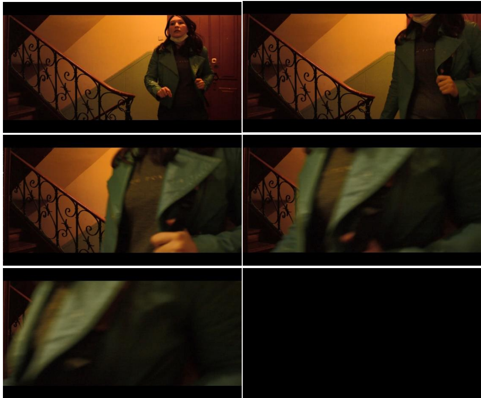
Figura 6: A aproximação de Julia é aproveitada como transição para a tela preta, esta que também funciona como intervalo entre cenas.

Deste modo, as escolhas de corte e montagem foram feitas como forma de transparecer algum tipo de sensação; quando há um aumento de tensão, nota-se planos mais