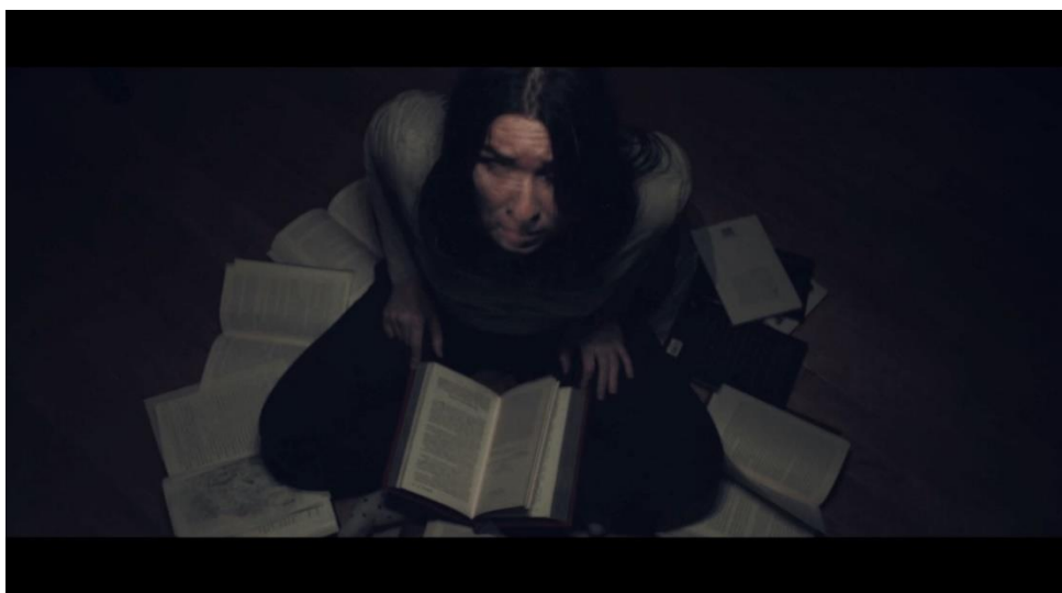
Figura 11: O Pesadelo de Julia.