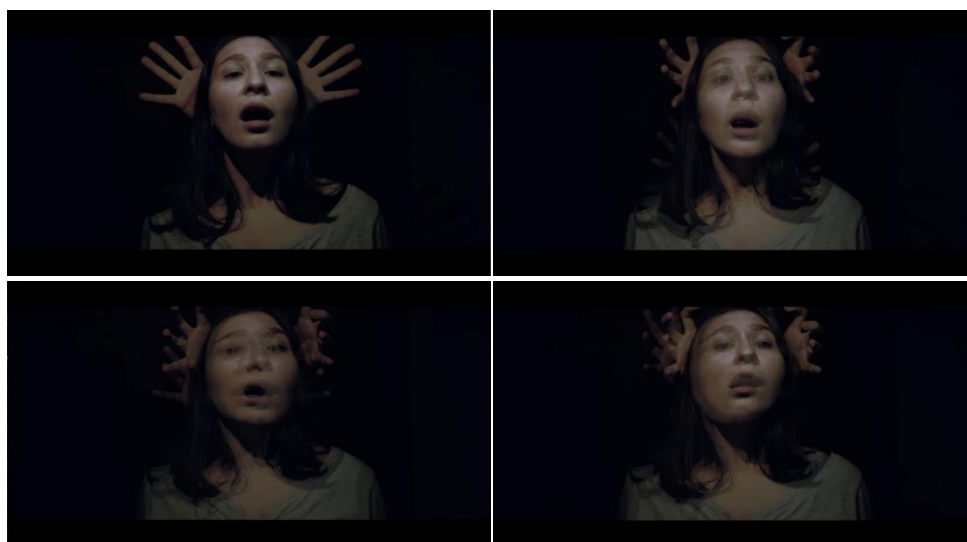
Figura 10: O Pesadelo de Julia.

sutil efeito ghosting , ou seja, de “imagem fantasma”, que consiste em imagens duplicadas e sobrepostas desalinhadamente no tempo – um efeito similar pode ser observado, por exemplo, na televisão analógica quando há algum problema na recepção do sinal. Nesta cena, o desalinhamento foi criado ao sobrepor tomadas diferentes nas quais a atriz realizava a mesma ação. Além disso, as imagens foram aceleradas (entre 300 e 400% da velocidade original). O efeito desejado foi o reforço da sensação de desconforto e desassossego, causando distorções no rosto da atriz, como pode ser notado nos dois exemplos abaixo: