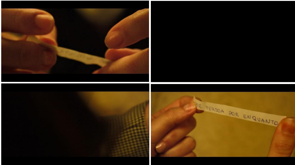
Figura 2: Transição entre o momento em que Julia abre a mensagem e quando o seu conteúdo é revelado.