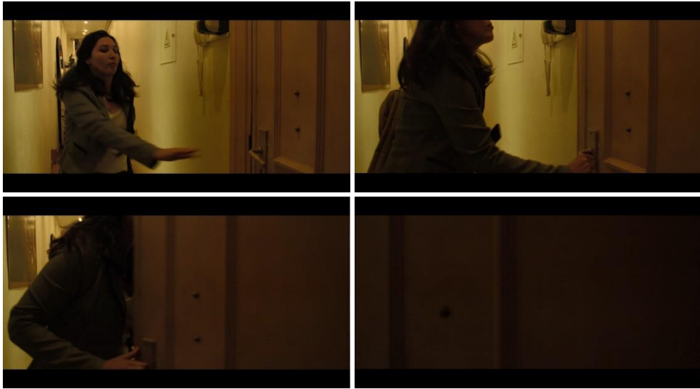
Figura 5: Julia abre a porta e, assim, a aproximação desta em direção à câmera é aproveitada como transição para a tela preta (um intervalo entre cenas).