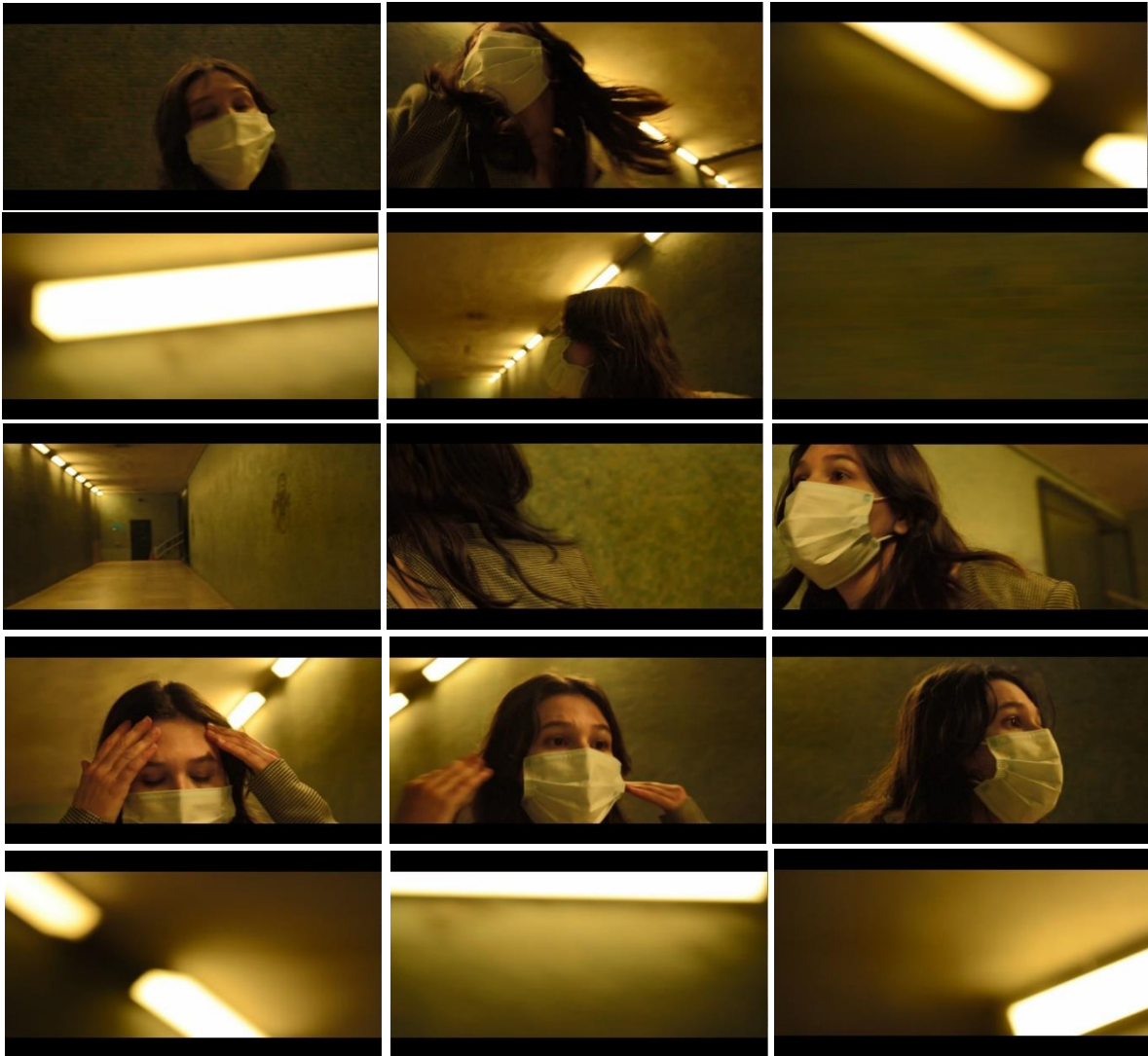
Figura 8: Neste trecho, o estado de tensão e confusão de Julia manifesta-se, também, nos movimentos de câmera e na composição da sequência de planos; a direção pra qual a personagem olha não fica evidente e por vezes, o que vemos está desfocado e confuso.

Uma lógica parecida é aplicada à cena noturna do filme, na qual Julia encontra-se em seu quarto, com uma notória dificuldade para dormir. Sua agitação é evidenciada conforme os planos “saltam” de um movimento para o outro; seu corpo se contorce na cama, sem encontrar conforto e, eventualmente, vagueia pelo quarto, de um lado para o outro, alternando entre duas camas. Nesta cena, há uma preferência por planos relativamente próximos, embora alguns mais abertos tenham sido inicialmente filmados. A escolha pela câmera na mão unida a este tipo de enquadramento, naturalmente produz quadros com movimentos mais bruscos, ao passo que a proximidade não permite que o espectador entenda exatamente aonde a personagem está indo – apenas nota-se que a mesma anda inquietamente de um lado para o