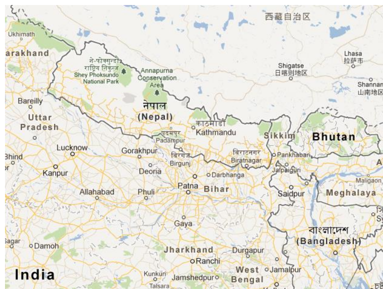
Figura 2. Mapa do Nepal

O Nepal é um país com uma população jovem. Em 2010 13 , a percentagem da população entre os zero e os 14 anos era de 36 por cento. A esperança média de vida à nascença estima-se que se situe, entre 2010 e 2015, nos 69 anos para as mulheres e nos 67 anos no caso dos homens. Para o mesmo período, prevê-se que a mortalidade infantil se situe nos 35,8 casos em cada mil nascimentos (no caso de Portugal é de 4,1, para que se possa comparar). Quanto à educação, não existe escolaridade obrigatória, embora a educação seja gratuita até ao oitavo ano. 84 por cento (86% homens, 82% mulheres) da população possui a escolaridade básica e 43.5 por cento (46% homens, 41% mulheres) possui o nível secundário.