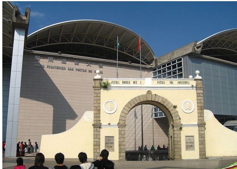
Figura 3. Portas do Cerco, Macau

Em Dezembro de 2012, a região de Macau tinha 582 mil habitantes e uma densidade demográfica de 19.000 habitantes por quilómetro quadrado (GCS Macau, 2013, p. 8). Para se poder comparar, Lisboa tem cerca de 500 mil habitantes e uma densidade de 940 pessoas por quilómetro quadrado 34 . A parte norte da Península de Macau é considerada uma das zonas com maior densidade demográfica do mundo 35 . O movimento de entradas e saídas na RAEM (visitantes) registou também um número impressionante, com um total anual de 28 milhões.