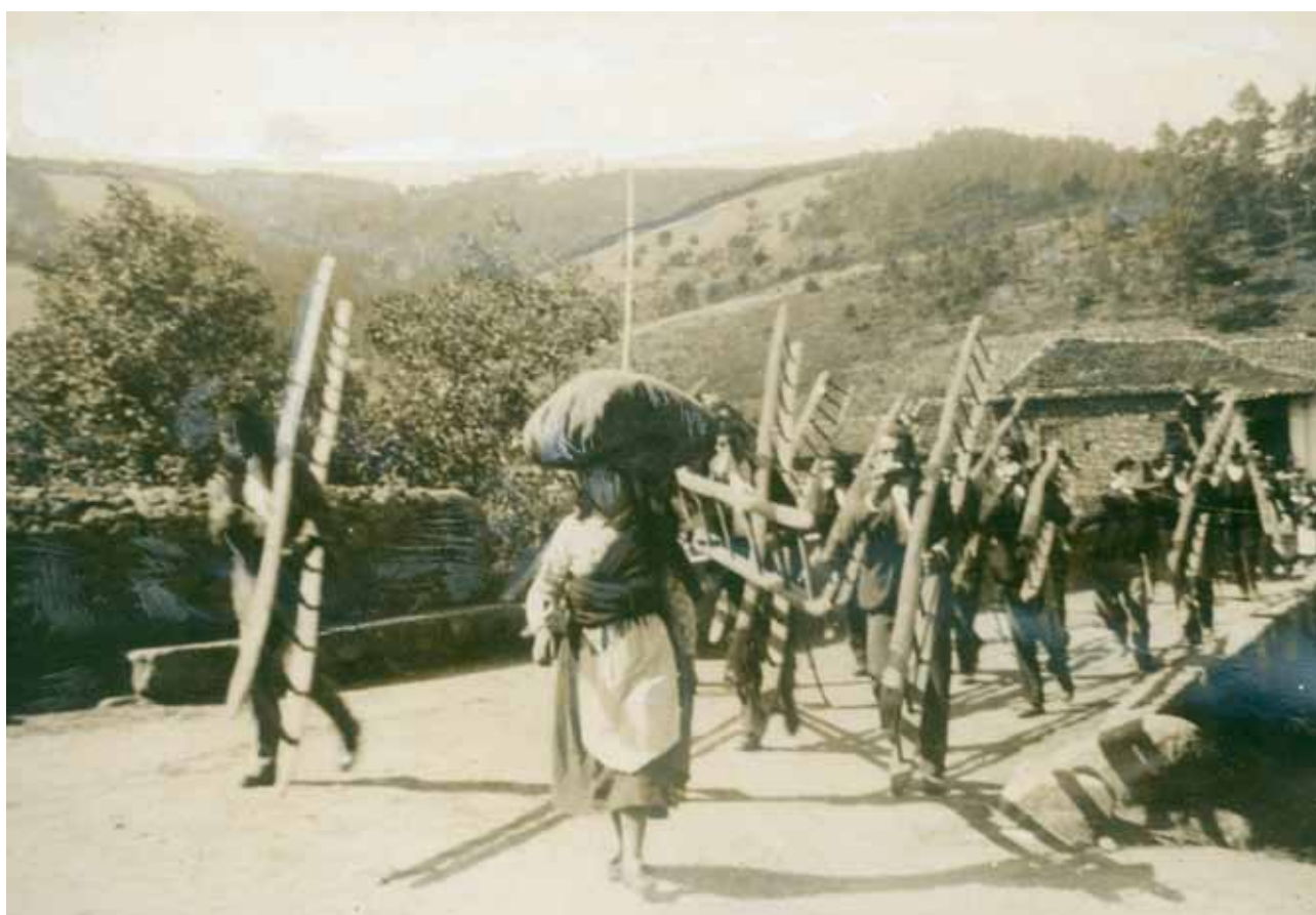
“A CAMINHO DA APANHA DAS AZEITONAS”, MONSANTO, 1938