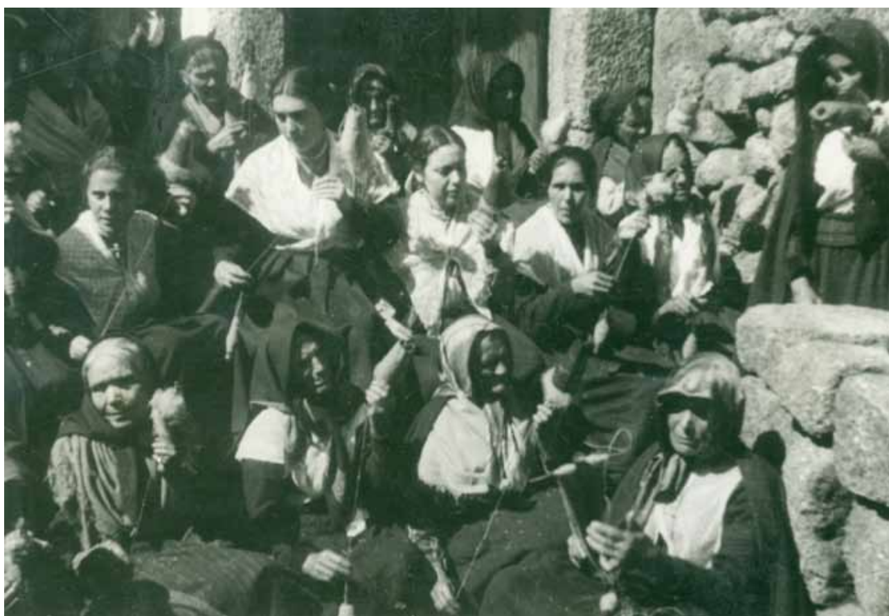
“FIANDEIRAS”, MONSANTO, 1938