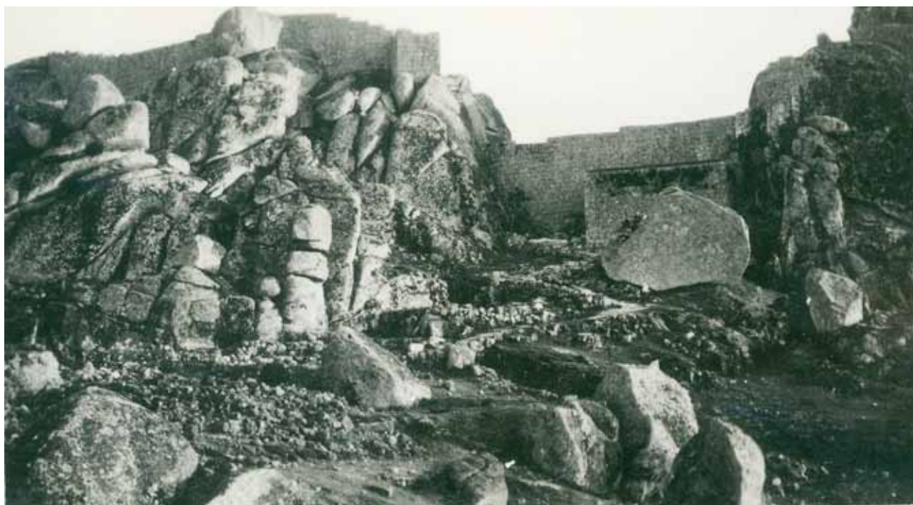
“MURALHAS”, MONSANTO, 1938