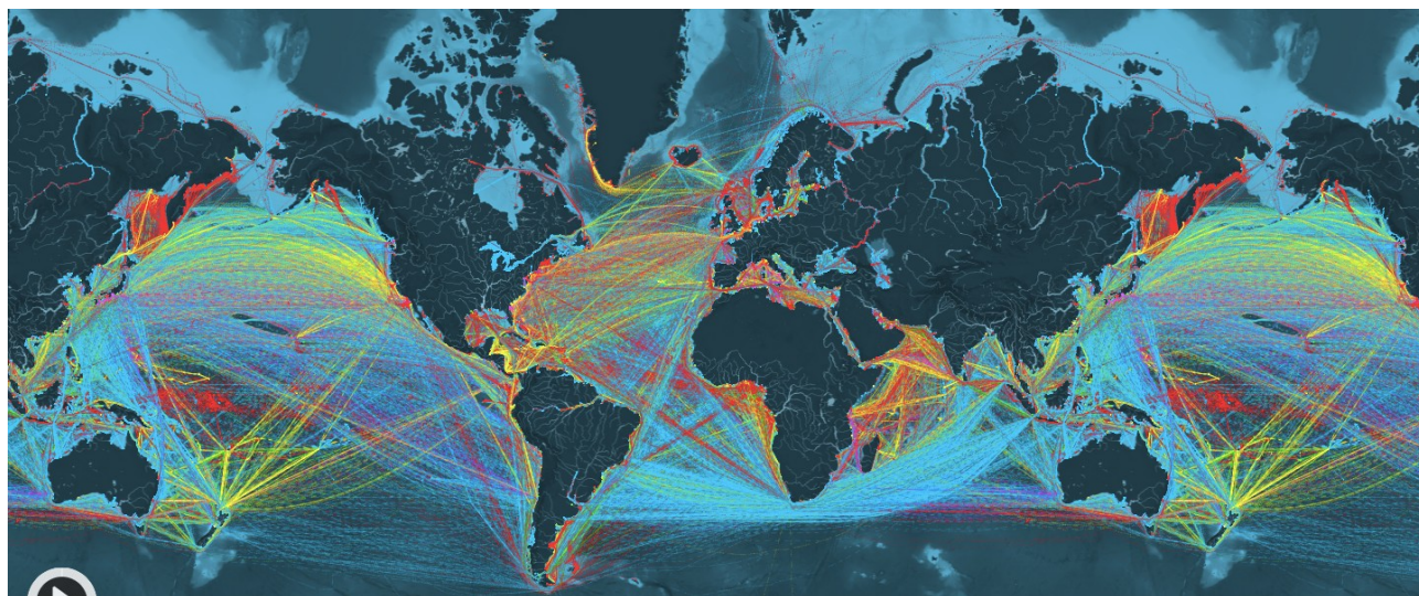
ShipMap. An animated and interactive visualization of global commercial shipping, by Kiln for the UCL Energy Institute.

Nesse sentido, a paralisação das suas atividades adquire um sentido importante a ser considerado: além de deter a capacidade de causar grandes prejuízos às empresas, incidindo de facto na maximização do poder sindical desse grupo profissional e na possibilidade de maior barganha para os direitos desses trabalhadores, do ponto de vista simbólico eles constituem um ponto privilegiado para revelar a interdependência inextricável entre os diferentes setores da sociedade.