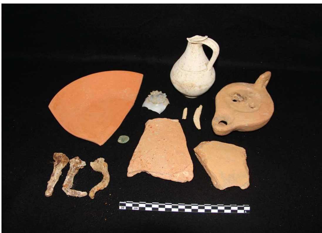
Figura 3 – Conjunto votivo da Sepultura 1, destaca-se à direita em cima o prato em terra sigillata clara africana da forma Hayes 50A/B em C1/2, em cima ao centro uma pequena bilha em pasta regional caulínica, assimilável aos típicos fabricos da olaria da Quinta do Rouxinol.