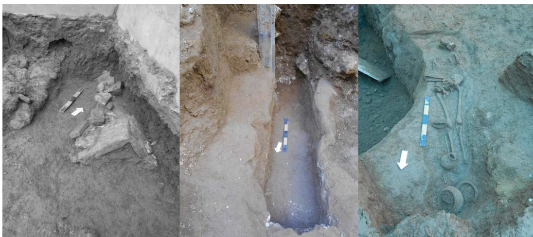
Figura 2 – Tipologia das Sepulturas Estruturadas com cobertura (à esquerda – Sepultura 3 e ao centro – Sepultura 4) e em Covacho (Sepultura 2). Destaca-se ainda a presença de estuque branco nas paredes interiores da Sepultura 4 (ao centro).