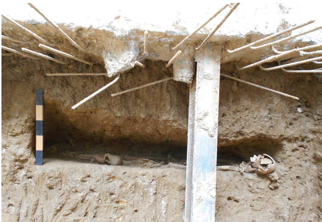
Figura 7 – Plano geral do indivíduo [610] da sepultura 1.