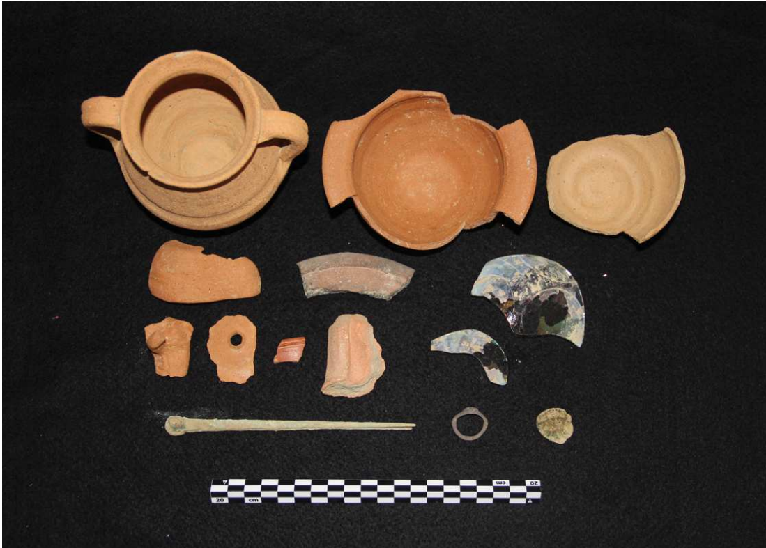
Figura 4 – Conjunto votivo da Sepultura 3.