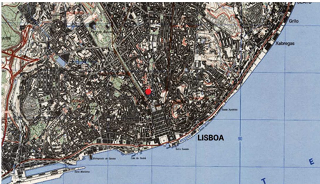
Figura 1 – Localização do Edifício 84 a 90 da Rua das Portas de Santo Antão, Lisboa. Excerto de CMP:431 Esc.: 1:25000.

WASTERLAIN, Rosa Sofia (2000) – Morphé: Análise das proporções entre os membros, dimorfismo sexual e estatura de uma amostra da colecção de esqueletos identificados do Museu Antropológico da Universidade de Coimbra. Dissertação de Mestrado em Evolução Humana . Coimbra: Departamento de Antropologia, Faculdade de Ciências e Tecnologia da Universidade de Coimbra. [policopiado].