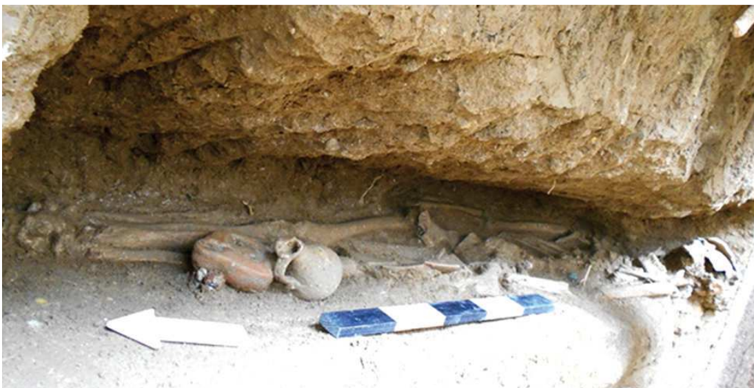
Figura 8 – Indivíduo [610] da sepultura 1 in situ .