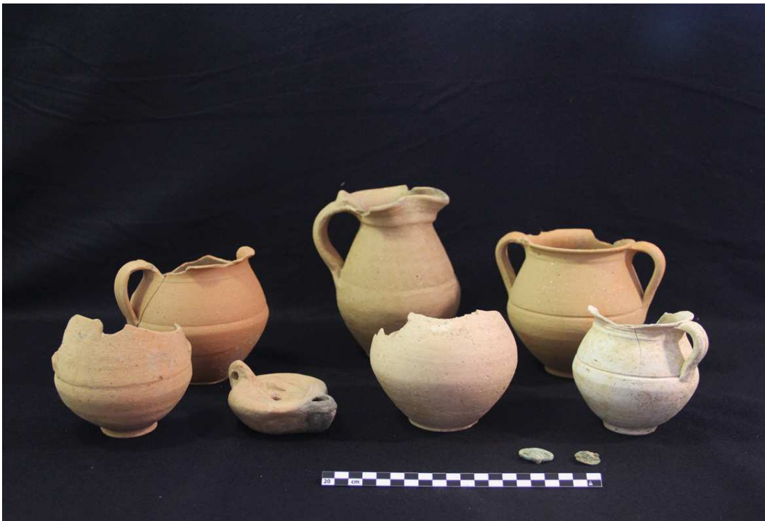
Figura 5 – Conjunto votivo da Sepultura 6.