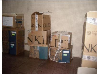
FIGURA 2- Fotos das caixas onde está acondicionado o arquivo BEA