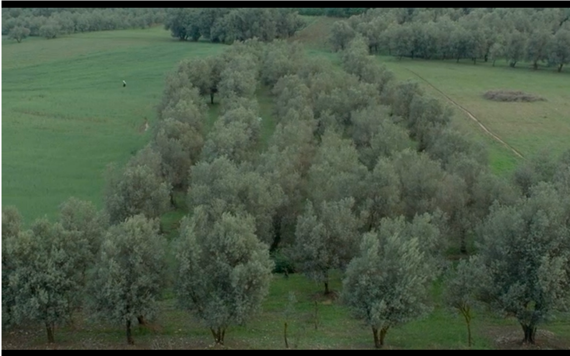
Figura 18 Fotograma de Através das oliveiras .