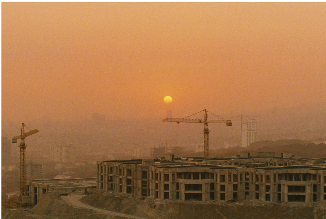
Figura 12 Fotograma de O sabor da cereja .

ele será a evidência de cada plano. Olharemos novamente os tons vermelhos e amarelos do pôr do sol sobre a cidade (ver Figura 12), a lua, e, por fim, o céu da manhã.