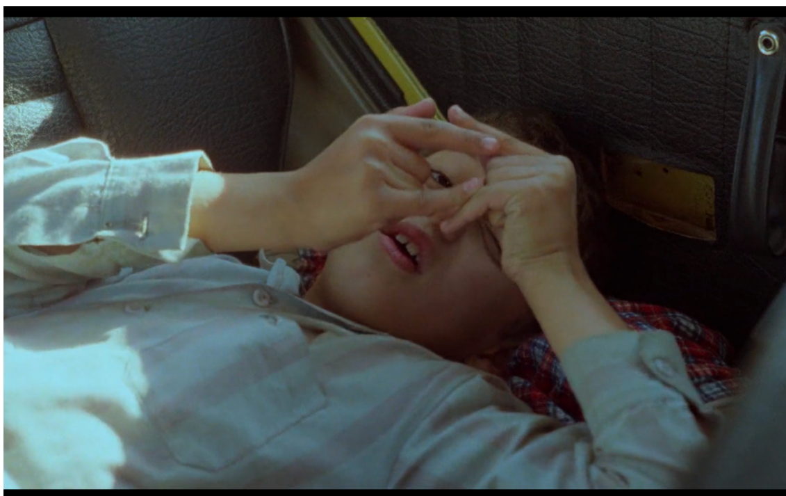
Figura 4 Fotograma de E a vida continua .

Germania anno zero (Alemanha, ano zero, 1948). Ao invés de brotar das ruínas a continuidade da vida, o filme de Rossellini impõe uma imagem de morte na impossibilidade de Edmundo continuar a ver, cujo gesto das mãos encerra os olhos antes do suicídio. 48 Em E a vida continua , antes de nos ser dado a ver na paisagem o rasto de destruição, a criança, deitada no banco de trás do carro, “enquadra” com as duas mãos