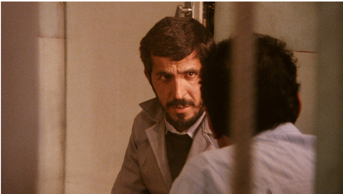
Figura 9 Fotograma de Close-up .

Atente-se na presença – ou será ausência? – de Kiarostami. Após ter descoberto a notícia, o realizador começa um conjunto de entrevistas: ao polícia que prendeu Sabzian, à família Ahankha, a Sabzian, então preso, e, por último, ao juiz, pedindo-lhe autorização para filmar o julgamento, numa outra evidência do simulacro do filme já em curso. Na visita à prisão, vislumbramos pela primeira e última vez a figura de Kiarostami, mas de costas (ver Figura 9). 54