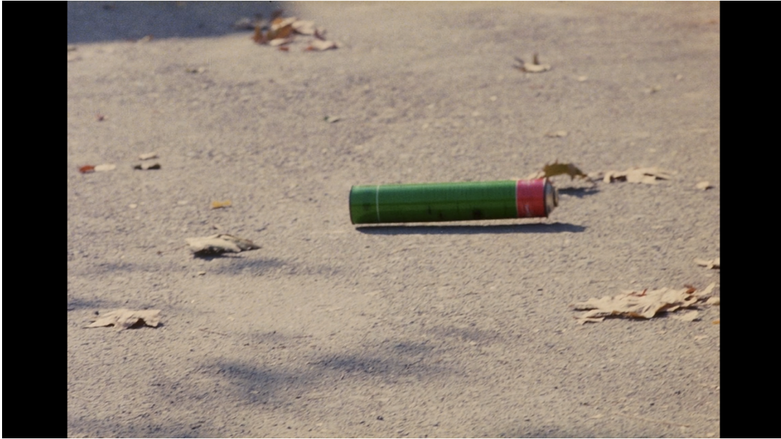
Figura 10 Fotograma de Close-up .

Trata-se possivelmente do gesto de ocultação mais sublime de todo o corpo cinematográfico de Kiarostami. Para lá do que o olhar contempla do visível, o fora-de-campo é imaginado, sentido. Neste linha, Renard fala-nos de uma convocação no espectador de um “campo imaginário” (Renard, op.cit. : 93), como ele é definido por Jean-Pierre Oudard, em comparação com o “campo ausente”. 57 O plano em questão, que se inscreve no realismo poético de Pier Paolo Pasolini – um plano estático sobre um objecto extra-diegético (Pasolini, 2000: 191) – não é senão expulsão, ou melhor, um desvio da atenção do espectador da narrativa, que segue o seu fluxo no fora-de-campo, o qual só podemos pressentir e esperar que, eventualmente, se revele no filme.