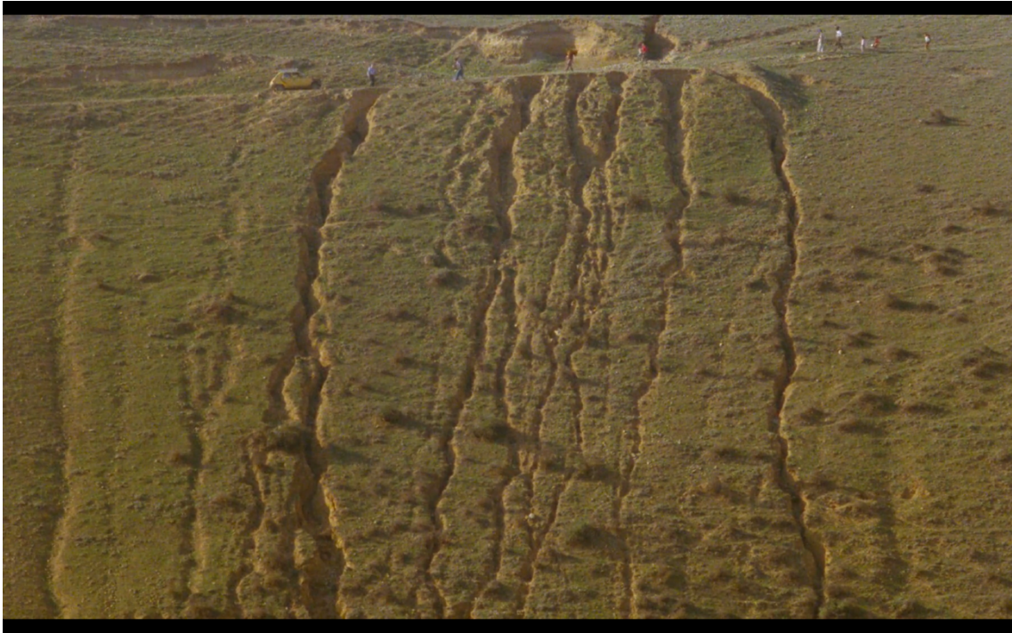
Figura 6 Fotograma de E a vida continua .

tão inultrapassáveis como aquelas das estradas que levam até Koker (ver Figura 6) e que todos insistem estar demasiado danificadas para serem atravessadas pelo carro de Farhad.