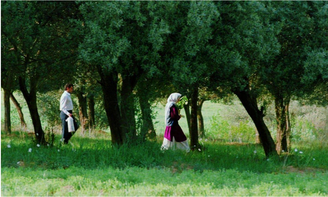
Figura 16 Fotograma de Através das oliveiras .

Tudo se resume a um olhar de Tahereh no cemitério, para o qual Hossein exige uma explicação face ao seu silêncio insuperável. Hossein detém-se e Tahereh avança por um caminho que se revela, em vários planos gerais, em forma de ziguezague. Ao escapar-lhe novamente do olhar por detrás de uma árvore que se encontra no cimo da colina, Hossein parte novamente atrás Tahereh e um grande plano restitui ao último filme a imagem-síntese dos dois filmes anteriores – a totalidade do caminho em ziguezague que irrompe por uma colina até ao cimo assinalado pela presença de uma só árvore (ver Figura 17).