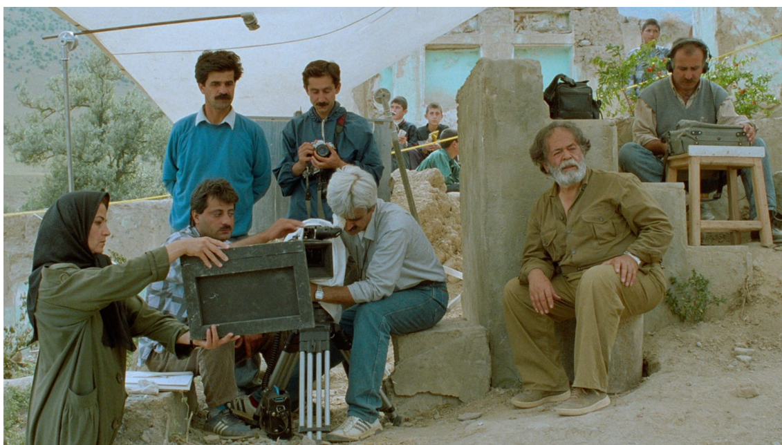
Figura 7 Fotograma de Através das oliveiras .