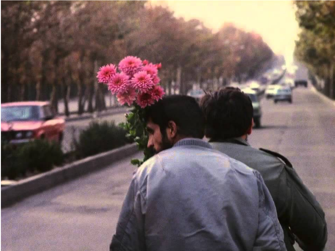
Figura 11 Fotograma de Close-up .

Os cortes intermitentes de som, que nos ocultam a conversa entre os dois, como se se tratasse de um segredo, invocam a atenção do espectador para o que se mostra – o cinema, o real e o possível num só. Propositados, estes cortes são responsáveis por uma descontinuidade, uma cisão entre o que vemos e o que ouvimos, a partir da qual, paradoxalmente, se cria uma continuidade na atenção do espectador. Neste sentido, como dá conta Renard, a oposição entre ficção e real torna-se um falso problema em Close-up (Renard, op.cit. : 93), porque Kiarostami se liberta das pretensões realistas do documentário, dando lugar ao real que excede a ficção precisamente a partir dela. Nesse momento, ele e Makhmalbaf tornam-se quase indistinguíveis – “Sabzian é e não é Sabzian, ele tornou-se a verdade da sua mentira, ele tornou-se narrativa.” (Comolli, op.cit. : 297). Sem que o saiba, Sabzian concretiza o seu desejo – fazer cinema, ser cinema – e “a realidade só se torna real na medida em que realiza o seu desejo” (Stiegler, op.cit. : 47), na medida em que se torna cinema.