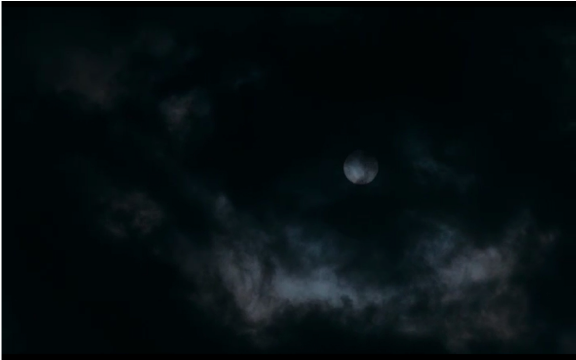
Figura 15 Fotograma de O sabor da cereja .

Voltemos a nossa atenção para o filme Através das oliveiras , cuja sequência final, a par de E a vida continua e O sabor da cereja , se tornou um dos mais paradigmáticos finais abertos, designação pela qual ficaram conhecidos os fins sem final , o “acabar sem acabar” na obra de Kiarostami, porque ambíguos, irresolúveis e enigmáticos. Terminadas as filmagens, gera-se o problema do transporte de regresso a casa. No tempo de espera por uma solução vinda da equipa, Tahereh decide caminhar até casa. Imóvel e angustiado pela possibilidade de não voltar a ver Tahereh, Hossein tenta alertar a equipa enquanto olha Tahereh desaparecer do seu campo visível. Incitado pelo realizador, Hossein parte atrás da sua jovem amada, desaparecendo também ele do campo visível do realizador. Através das oliveiras , Hossein persiste na obtenção de uma resposta ao pedido de casamento, para “viverem juntos, de mão dada”, diz-lhe (ver Figura 16).