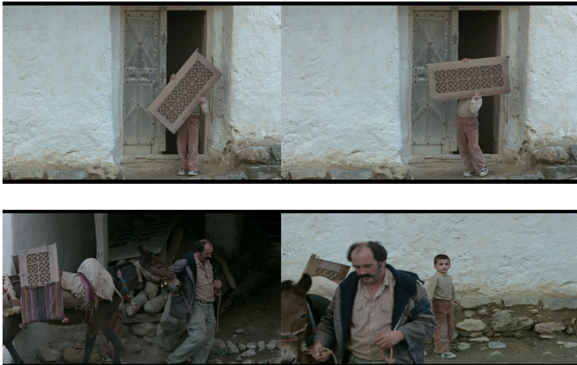
Figura 2 Fotogramas de Onde fica a casa do meu amigo? .

plano-sequência que une o anseio de Ahmad e o do espectador na obstinação de descobrir a morada de Nématzadeh. De regresso a Poshteh, Kiarostami oculta-nos propositadamente a cara de uma criança que traz vestidas calças da mesma cor que o amigo de Ahmad. Num primeiro momento, com uma porta de madeira e, depois, com um burro, para finalmente revelar outro menino que não o procurado (ver Figura 2).