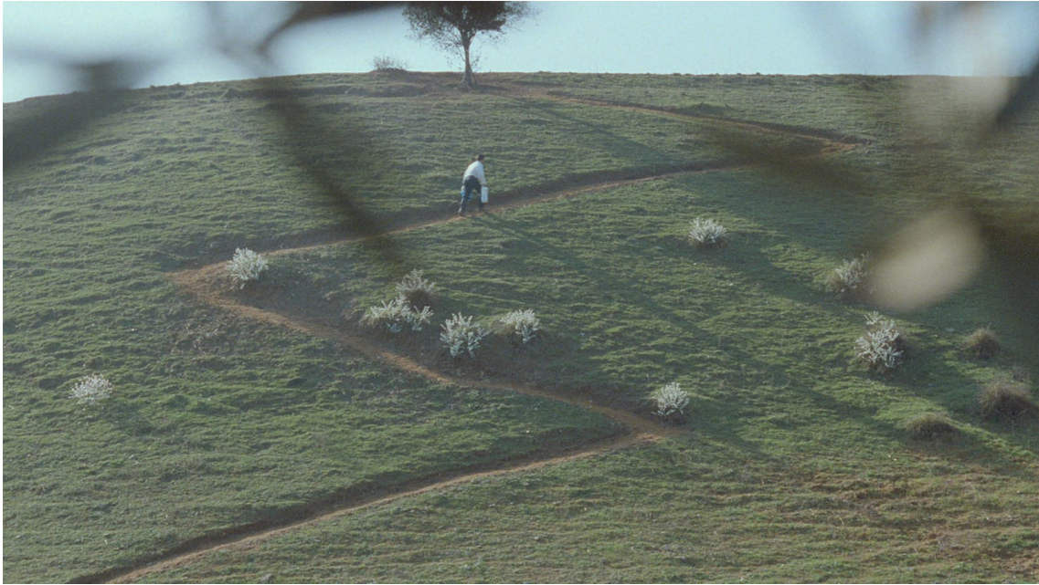
Figura 17 Fotograma de Através das oliveiras .

Desde o início da sequência que descrevemos, o final das filmagens, até à chegada de Hossein ao cimo da colina, a montagem em campo/contra-campo mostra um jogo de olhares entre o visível – no plano – e os seus limites – o que excede, ultrapassa o plano ao sair dele. À semelhança de E a vida continua , o plano final é um “imenso [leia-se pleno] plongée ”. A câmara imobiliza-se no cimo da colina “e num imenso e inadjectivável plano geral” (Bénard, op.cit. : 807) retém-nos na observação, à medida da distância, as figuras de Hossein e Tahereh tornarem-se mais pequenas, “mais longe, cada vez mais longe, eles sempre móveis, a câmara sempre imóvel.” ( Ibid. : 807) (ver Figura 18).