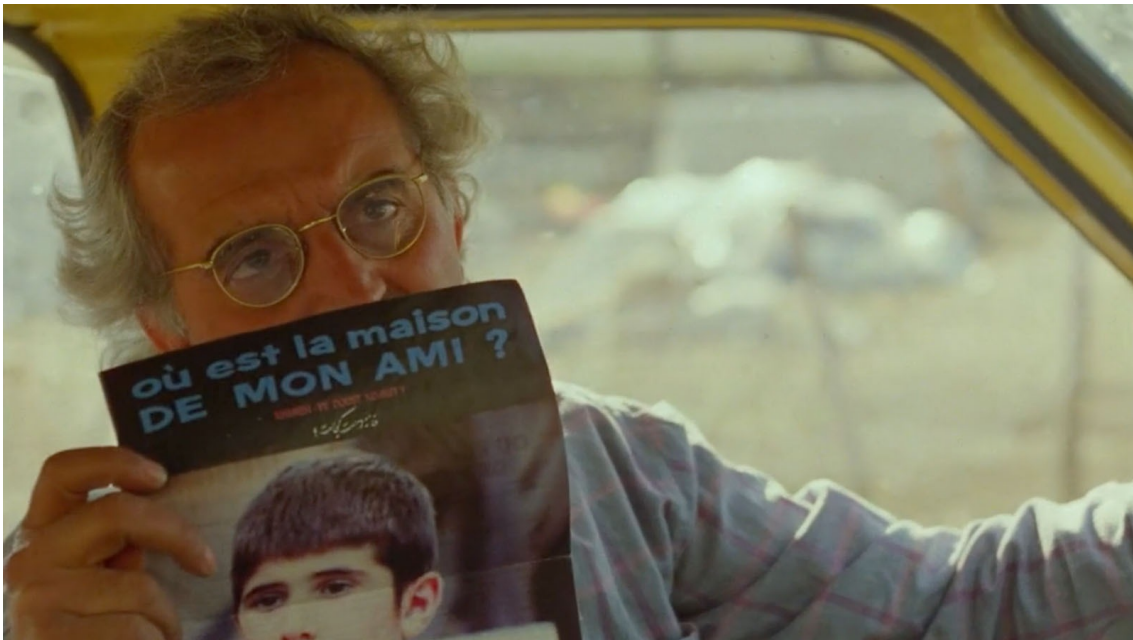
Figura 5 Fotograma de E a vida continua .

Kiarostami demora-se a revelar-nos o seu motivo (o mesmo acontece em O sabor da cereja ), precisamente trinta e quatro minutos, momento no qual Farhad Kheradmand, no papel de Kiarostami, e Puya (Buba Bayour), interpretando o filho, mostra a um transeunte o cartaz de Onde fica a casa do meu amigo? (ver Figura 5) e pergunta-lhe se este saberia o que aconteceu a Ahamd e Nématzadeh com o sismo – o primeiro filme repete-se, então, incessantemente no segundo através da auto-referência ou da citação.