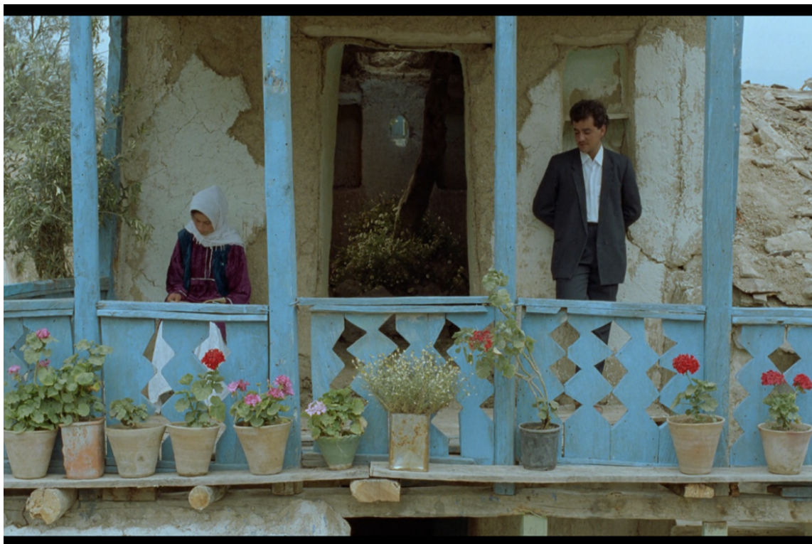
Figura 8 Fotogramas de Através das oliveiras .