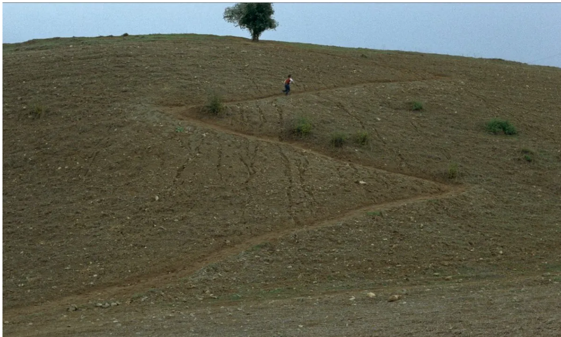
Figura 1 Fotograma de Onde fica a casa do meu amigo? .

duas localidades como a imagem-síntese da procura desesperada de Ahmad (ver Figura 1) 46 .