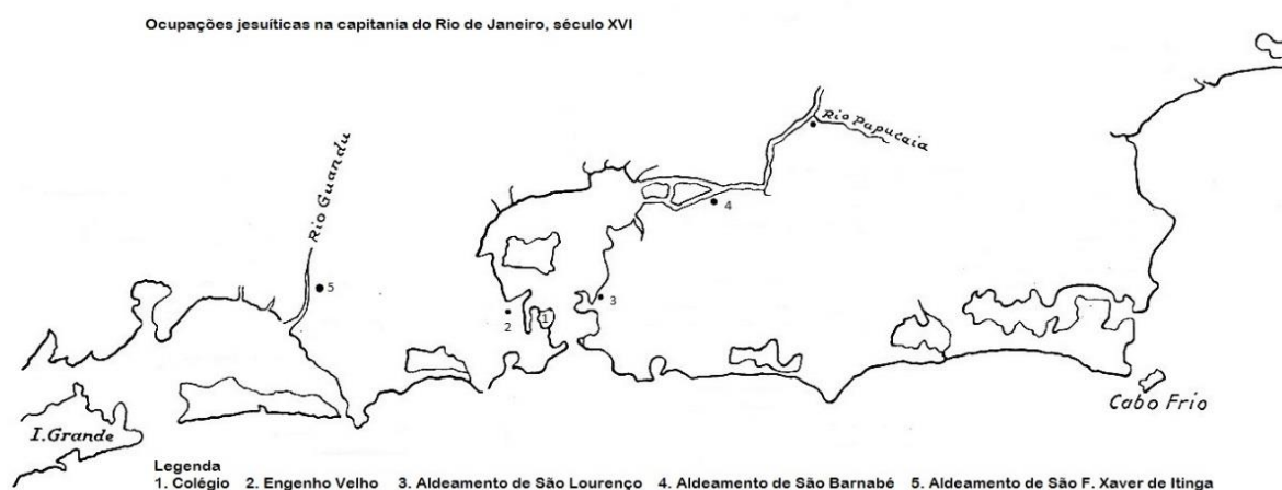
Mapa 1 – Localização do Engenho Velho, século XVII

O Engenho Velho, primeira unidade agrária inaciana em terras da capitania do Rio de Janeiro, foi uma espécie de laboratório onde os padres colocaram em prática decisões e administrações que já estavam sendo testadas em suas terras da Bahia há alguns anos e por meio dele, tentavam criar condições financeiras favoráveis aos seus interesses. Entretanto, no Rio de Janeiro, assim como na Bahia ou em qualquer outra capitania, os engenhos jesuíticos fugiam ao padrão das demais estruturas agrárias locais. A quantidade de terras que formavam essas propriedades e o número de seus escravos é quase sempre muito maior do que o do restante dos vizinhos. 58