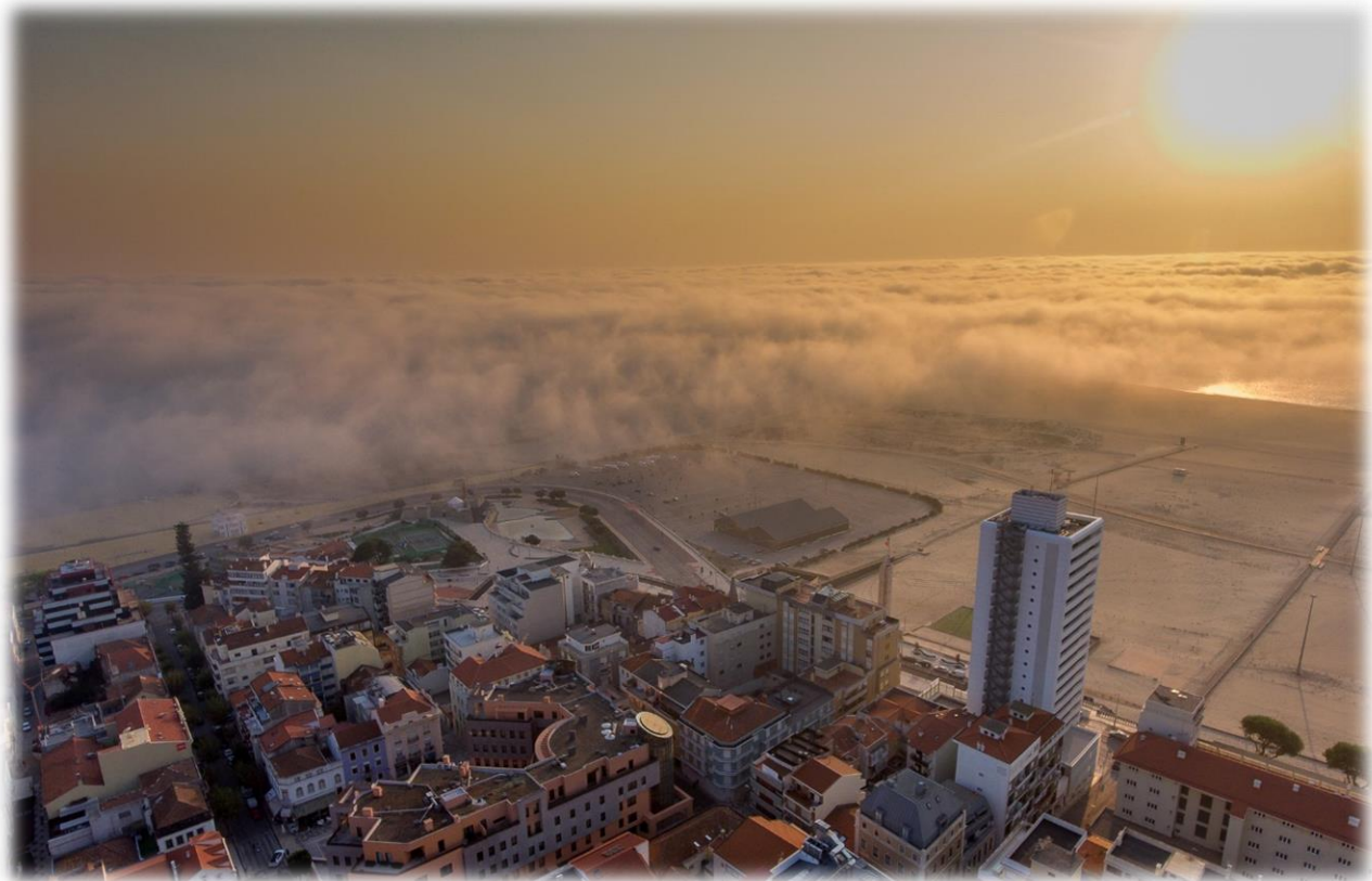
Fotografia de Nuno Vicente, “Figueira from the sky”

“Vaidade” de Florbela Espanca, in "Livro de Mágoas"