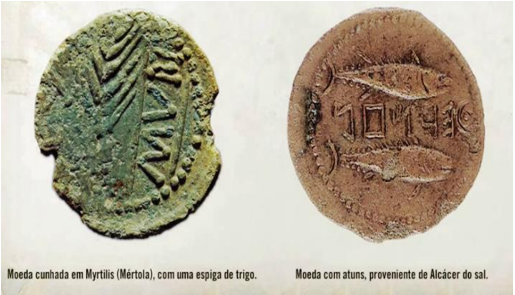
Moeda cunhada em Myrtilis (Mértola), com uma espiga de trigo.