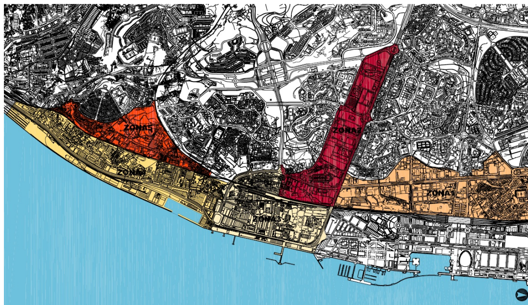
Figura 2: Zonamento proposto pelo DEMZRO.

Importa salientar que a área de estudo se insere nas zonas 4 (Santa Apolónia-Braço de Prata) e 5 (área entre as linhas férreas). Para estas zonas, o DEMZRO veio preconizar as seguintes orientações: (i) reconversão de áreas industriais obsoletas, promovendo novas atividades de comércio, serviços, indústrias criativas e logística urbana; (ii) articular a reabilitação das áreas históricas habitacionais com a reconversão de áreas industriais; (iii) valorizar o Eixo Cultural Santa Apolónia/ Largo David Leandro da Silva; (iv) valorizar a estrutura ecológica, articulada com a criação de novos equipamentos; (v) reabilitação do núcleo antigo de Marvila e a reestruturação da área habitacional junto ao Bairro da Madre de Deus (Câmara Municipal de Lisboa, 2008a).