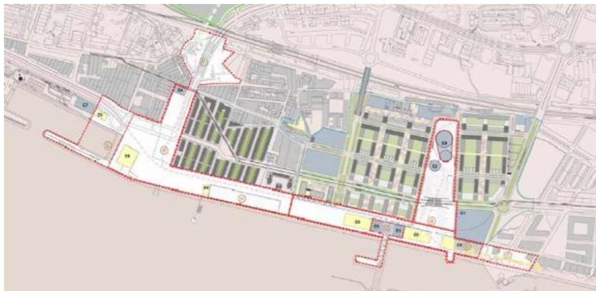
Figura 4: Área de intervenção do DEPRO.

Atendendo às importantes transformações preconizadas para a área ribeirinha da Matinha, Braço de Prata e Doca do Poço do Bispo (i.e. o Loteamento Jardins Braço de Prata, o Loteamento da EDP e o PP Matinha), o DEPRO veio reconhecer que este processo constitui “uma oportunidade única de renovação de uma área substancial do tecido urbano oriental da cidade de Lisboa” (Câmara Municipal de Lisboa, 2011). Neste contexto, em consonância com as orientações estabelecidas pelo “Plano Geral de Intervenções da Frente Ribeirinha de Lisboa” e com o PP Matinha, este documento estratégico veio propor a criação de um parque urbano na frente ribeirinha da Matinha: Parque Ribeirinho Oriente (Figura 4).