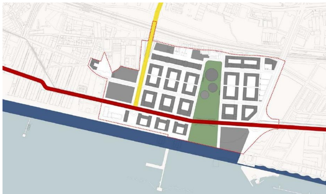
Figura 3: Estrutura urbana proposta pelo PP Matinha.

Especificamente no se refere à parcela de terreno da Matinha “libertada” das funções portuárias, foi então proposta a criação de um parque urbano/passeio ribeirinho, em estreita articulação com a intervenção preconizada pelo PP Matinha. Note-se que este instrumento de planeamento territorial, publicado em 2011 (Aviso n.º 7127/2011), assumiu vários objetivos, entre os quais: (i) reverter a área para usos mistos, privilegiando o uso predominante da habitação; (ii) estreitar as relações funcionais e visuais com a frente de rio; (iii) assegurar que o projeto da catedral tenha em conta a proximidade do rio e que se articule a Sul com uma praça, que deverá ter tratamento paisagístico de verde público; (iv) estabelecer sistemas de continuidade urbana, quer para Norte (Parque das Nações), quer para Sul (Matinha e Braço de Prata); (v) criar ligações francas à cidade alta, através do prolongamento da Avenida dos Estados Unidos da América (Risco, 2010). A estrutura urbana proposta para a área de intervenção é sistematizada na Figura 3.