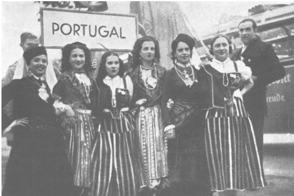
Figura 1 - Grupo Folclórico que representou a FNAT no “Congresso Força pela Alegria”, Hamburgo, 6/1939