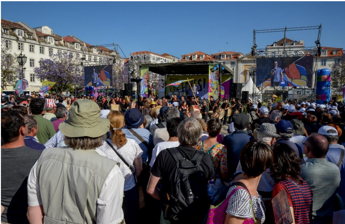
Figura 6 – Encontro final de todas as famílias de “foles” na Praça do Rossio