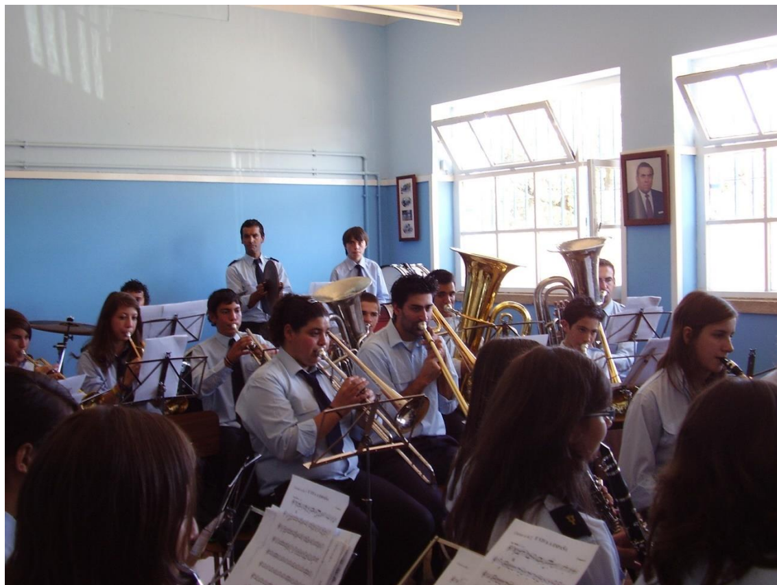
Figura 5 – Audição da Banda de Tourais, Distrito da Guarda, Projeto Visitas Técnicas