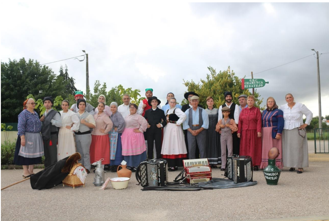
Figura 7 – Grupo de Danças e Cantares da Chamusca do Ribatejo. Trabalho de Campo.