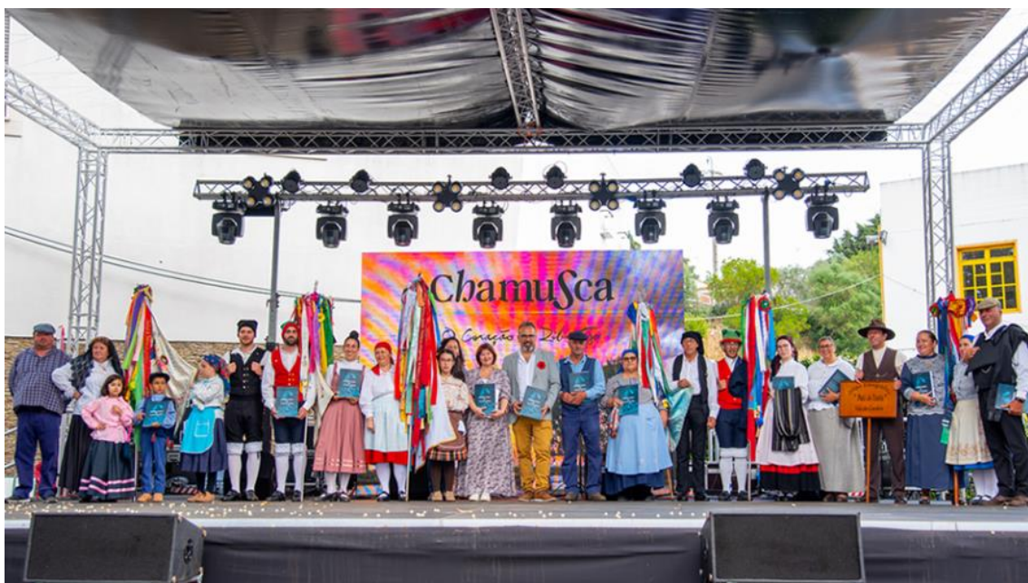
Figura 8 – Apresentação do Livro “Costumes e Tradições” na Festa da Ascensão.