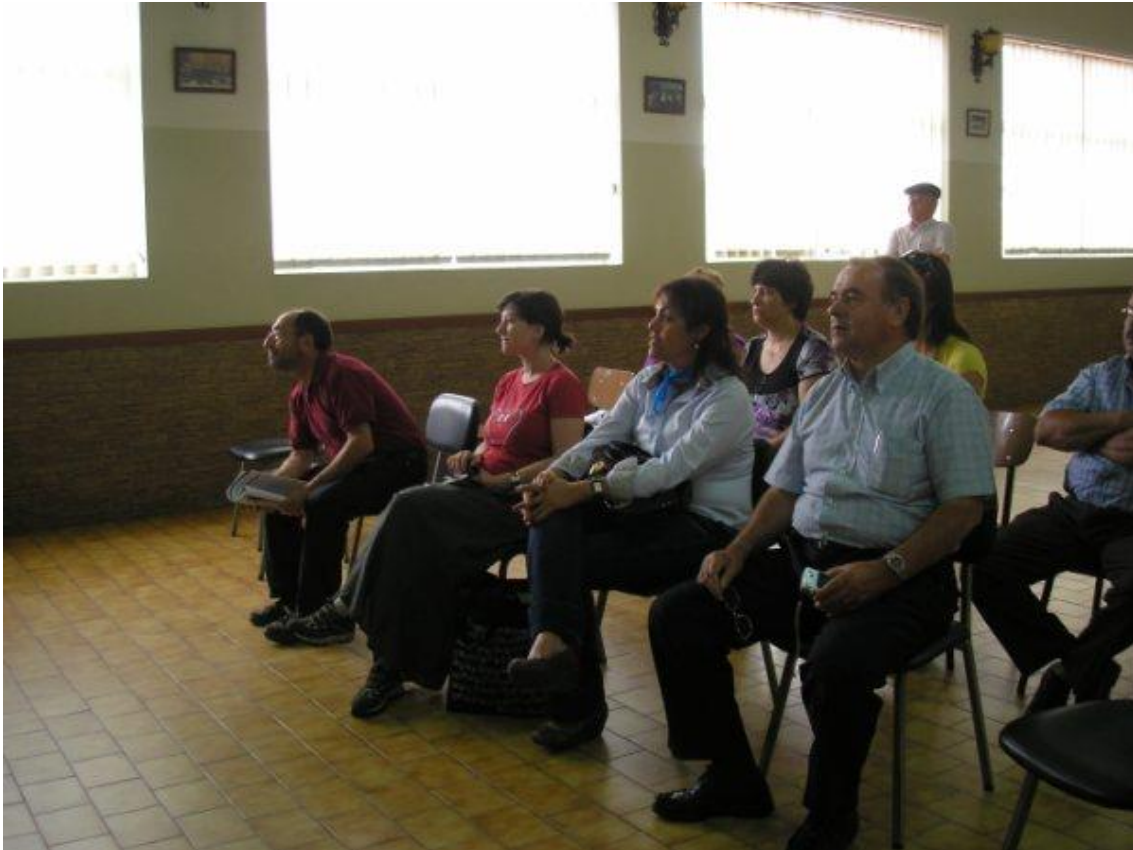
Figura 4 – Audição da Banda da Casa do Povo de Águeda, Distrito de Viana do Castelo, Projeto Visitas Técnicas, 2010