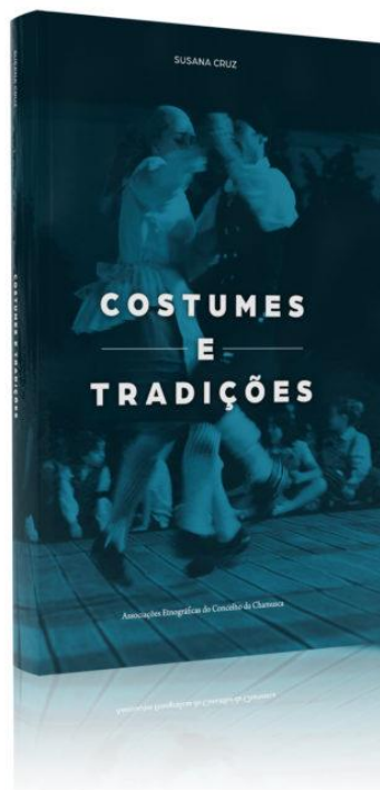
Figura 7 – Capa do Livro Costumes e Tradições – Associações Etnográficas do Município da Chamusca