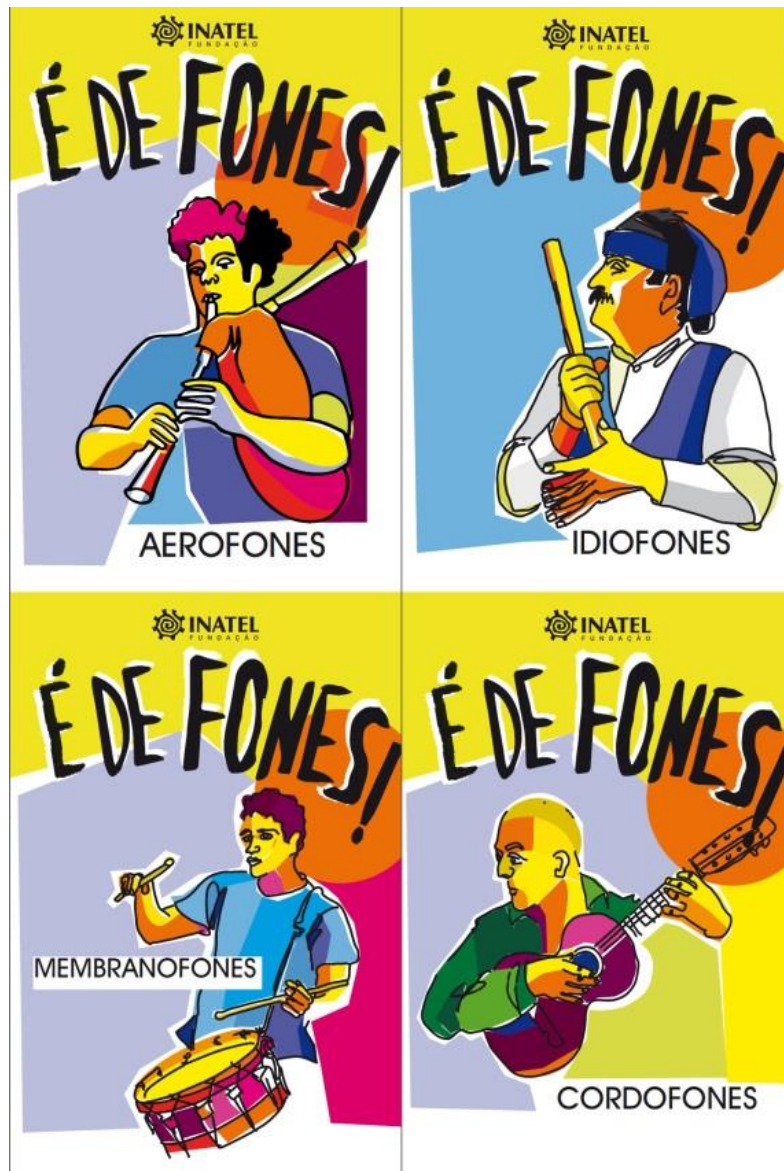
Figura 4 - Design dos estandartes identificativos de cada família de instrumentos do projeto É De Fones.