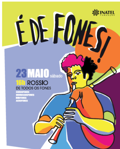
Figura 6 – Folhetos da iniciativa É de Fones.