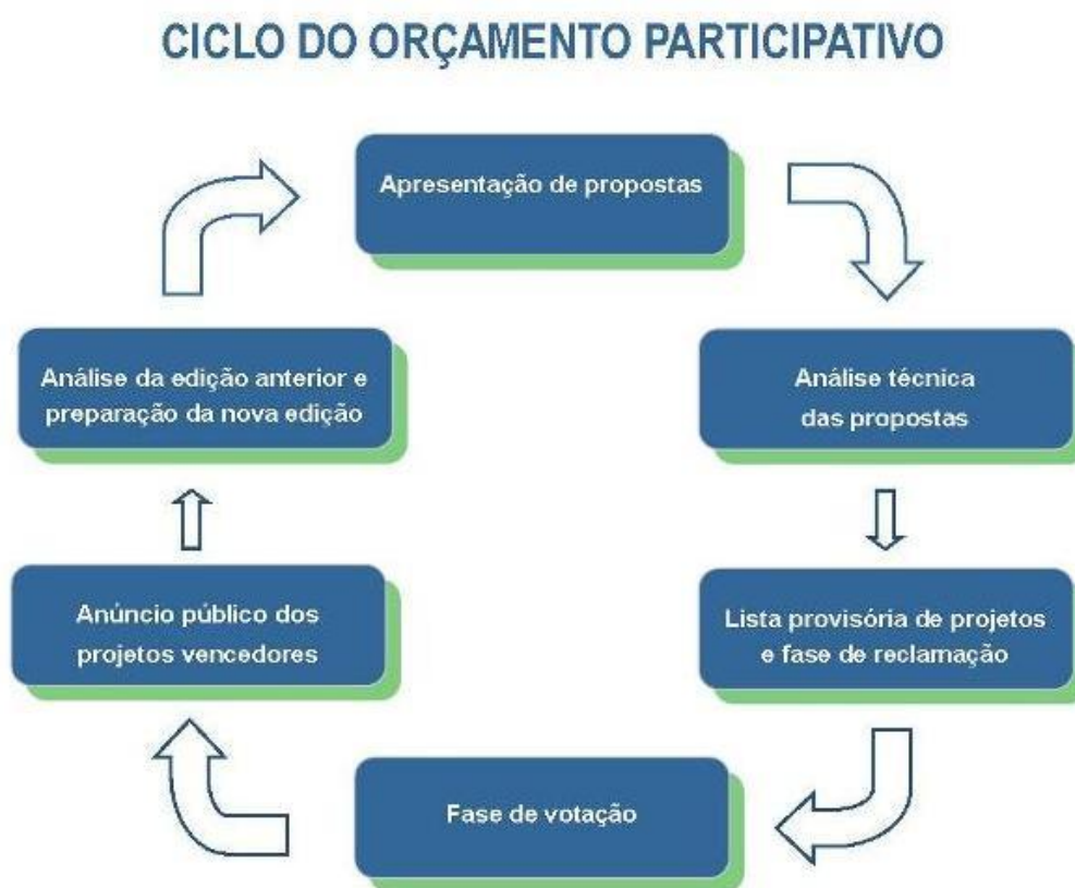
Figura 01: Ciclo do OP 2011.

O processo do Orçamento Participativo de 2011 é resultado do aperfeiçoamento do processo de OP que vem sendo testado em Lisboa desde 2008. O ciclo do OP no referido ano configurou-se da seguinte maneira: