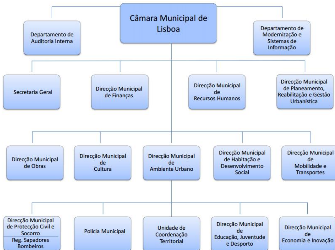
Figura 02: Organograma geral da Câmara Municipal de Lisboa. Fonte: Site da CML. Acesso em 11 Dez. 2011.