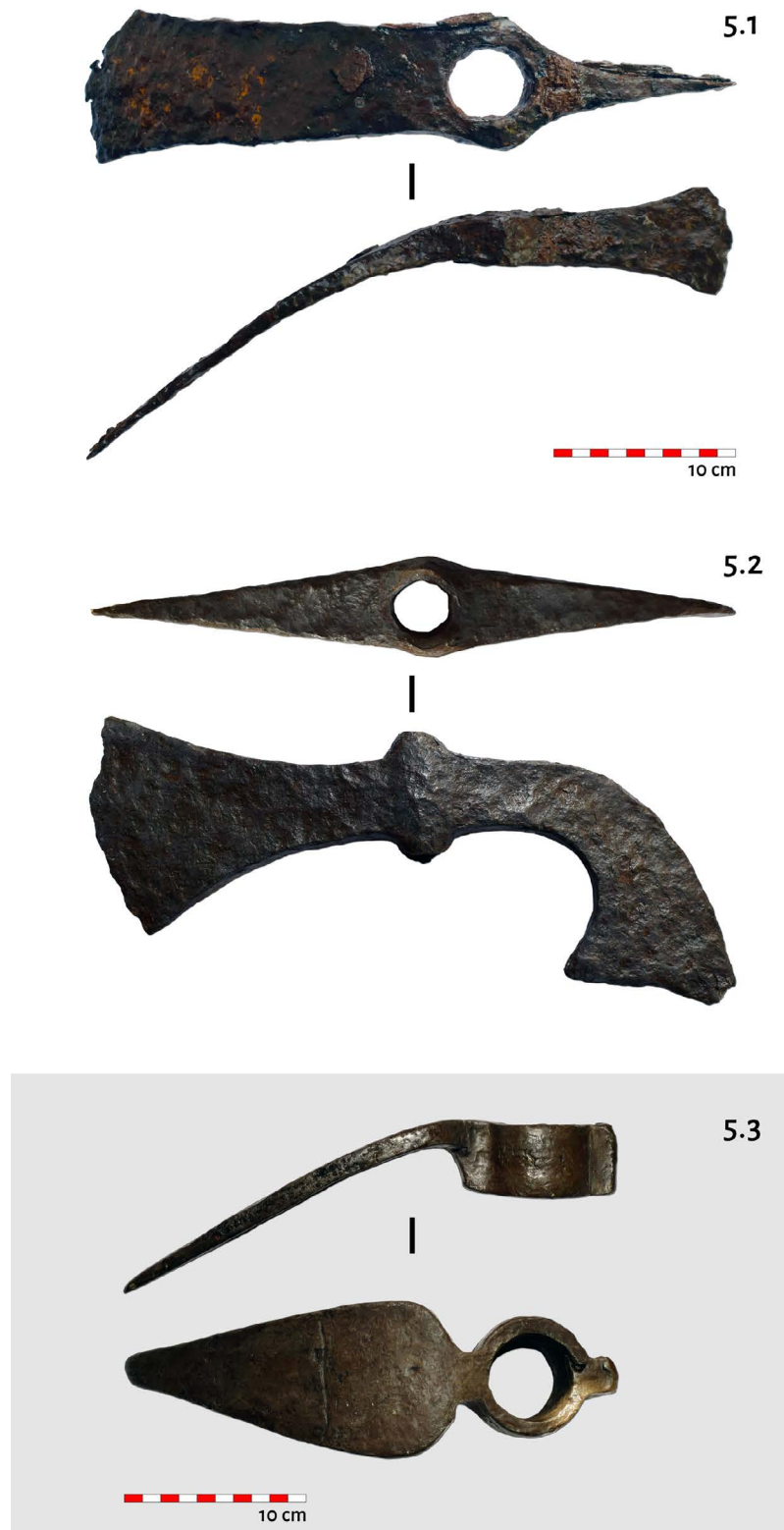
Figura 5.1. Azuela-hacha recogida en las inmediaciones de la estructura del Sítio 1 / VB2 en 1994. 5.2. Hacha doble localizada en 2020 en la loma donde se sitúa el Sítio 6 de Vale da Bexiga. 5.3. Azada (?) procedente del interior del horno cerámico de la villa de Mosteiros (Póvoa e Medas, Castelo de Vide).