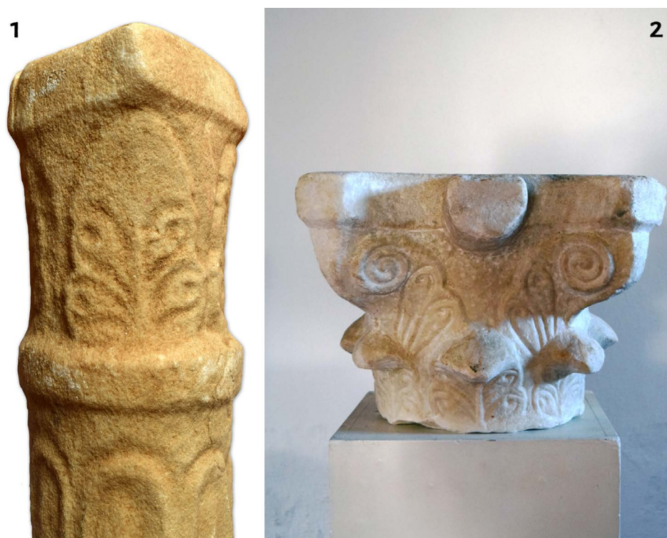
Figura 4: 1. Detalle del capitel de la columnita recuperada en el Vale da Bexiga; 2. Capitel tardoantiguo, supuestamente procedente de la villa de Mosteiros (Póvoa e Meadas, Castelo de Vide). (Fotografías F. Cuesta-Gómez).

1982 (Figura 5.3; Monteiro 2011: 42–45). Aunque pueden existir dudas respecto a la cronología de esta tercera pieza, las otras dos son aperos agrícolas y artesanales de época romana / tardoantigua. Es especialmente llamativo el caso del hacha doble de carpintero, rara pieza cuyos paralelos más próximos se encuentran en el impresionante ajuar de la Sepultura I de la Necrópolis del Camino (Fuentespreadas, Zamora) 11 , datada entre finales del s. IV y algún momento del siglo V (Caballero 1974: 37 y ss.); y en los fondos del MNAR (CE02182; Sabio 2012: pieza 22.2), aunque su extremo acodado no está completo, pieza posiblemente procedente de la excavación del solar del teatro emeritense.