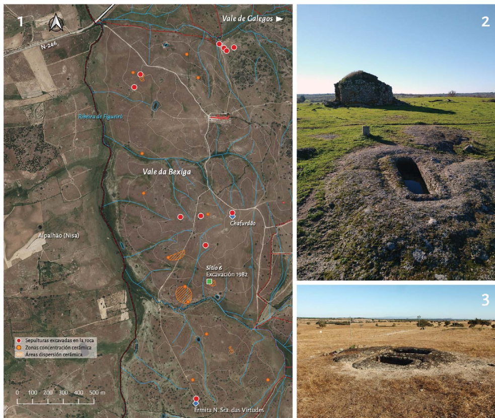
Figura 2: 1. Área del Vale da Bexiga, en la margen derecha del arroyo Figueiró; 2. Sepultura excavada en la roca, junto al chafurdão existente en esta propiedad; 3. Pareja de sepulturas en un mismo afloramiento (Cartografía sobre ortoimagen SNIG-Direção-Geral do Território 2018; fotografias F. C.-G.).