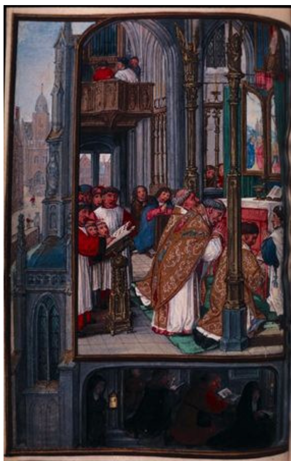
Pormenor dos cantores - Livro de Horas dito de D. Fernando , oficina de Simão Bening (atrib.), c. 1520-30