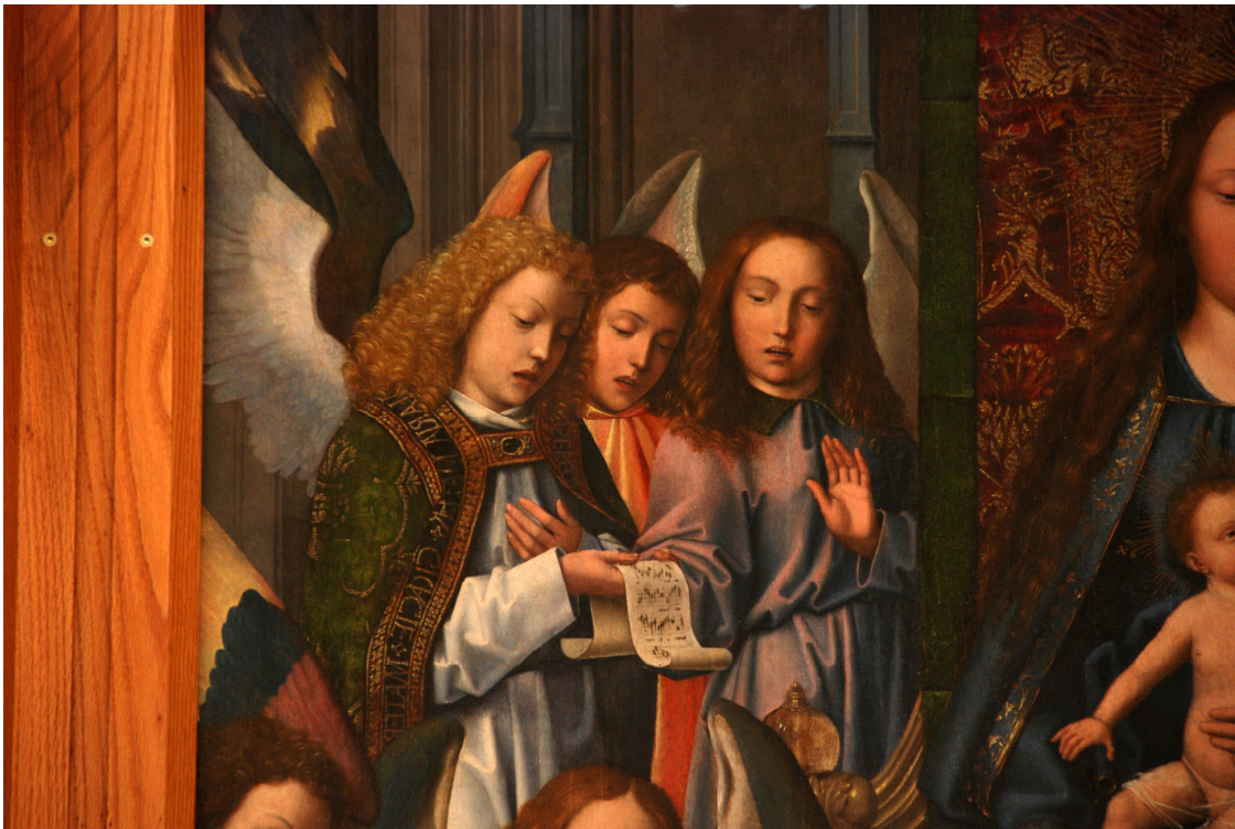
Pormenor dos anjos cantores de Nossa Senhora em Glória , 1490-1500 – círculo de Gerard David, Museu de Évora, Inv o ME 1501