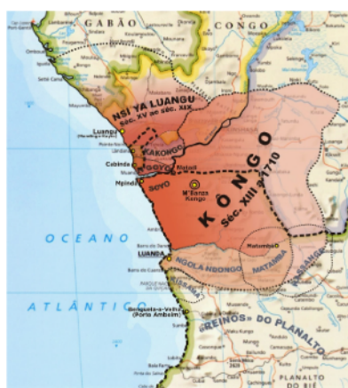
Imagem I – Reinos do Congo, do Ndongo, da Matamba e o território de Cassange 21

Mesmo com limites imprecisos, passamos a incluir duas ilustrações de duas fontes diversas, onde podemos apreciar onde estariam localizados estes territórios, que mostram como as respectivas fronteiras são ainda apresentadas de forma difusa na atualidade: