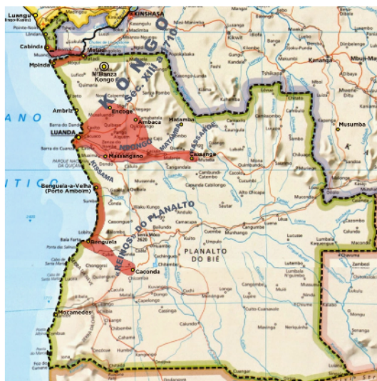
Imagem III – Territórios sob controlo português no século XIX e terras tradicionais do Ndongo, Matamba e Cassange 57

No seguinte mapa vemos quais os territórios onde ficariam tradicionalmente as áreas da Matamba. Vale isto a dizer que, de maneira análoga ao que se indicou nos mapas anteriormente mostrados no presente trabalho 56 , os limites territoriais nesta ilustração também são imprecisos, desde que as fronteiras não nos são totalmente conhecidas com exactitude.