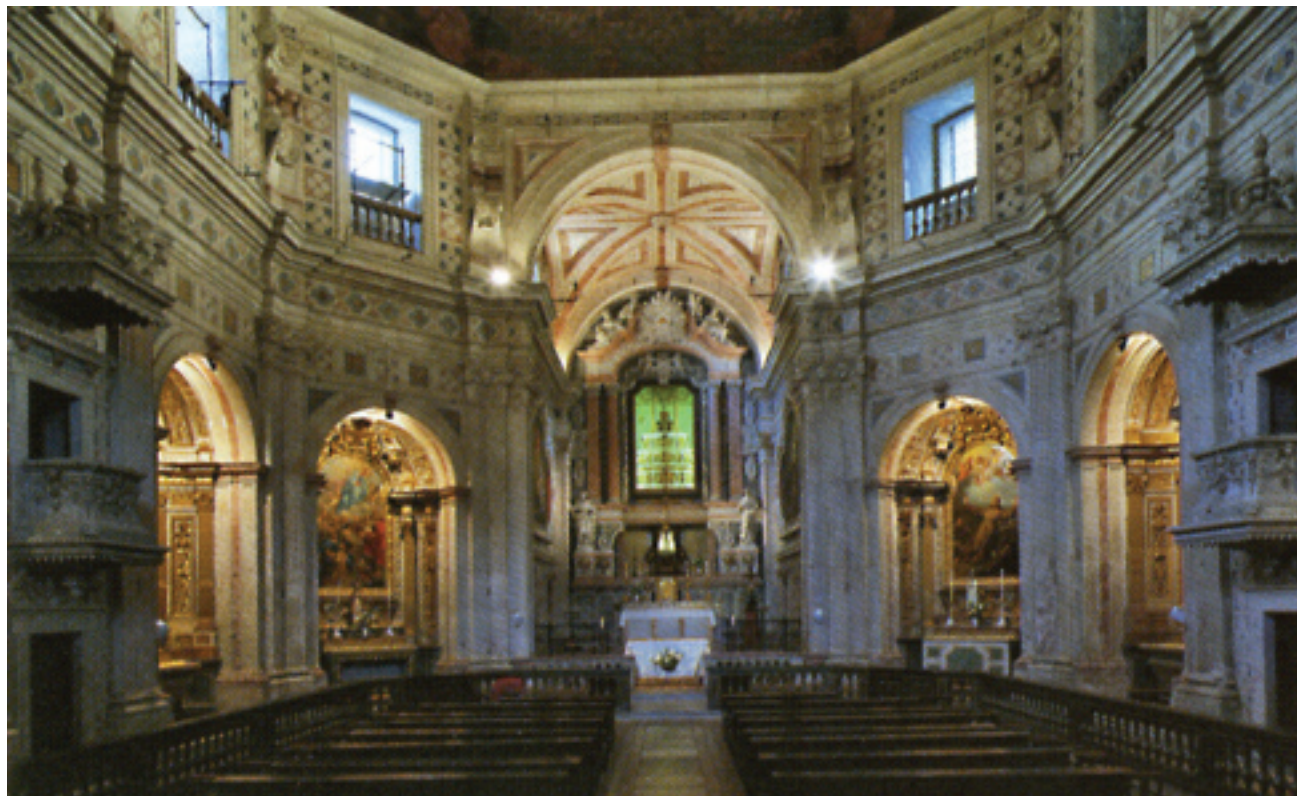
FIG.3 JOÃO NUNES DE ABREU, INTERIOR DA IGREJA DO MENINO DEUS, LISBOA, C. 1738. © CML/DMCRU. FOTOGRAFIA DE HENRIQUE RUAS.

Contudo, numa descrição mais detalhada podemos dizer que todo o tecto (...) está como que suspenso numa intrincada mas bellissima rede de madeira de eucalipto que forma a grande altura várias “estrelas” entrecruzadas (...) a parte plana é formada por uma caixa-de-ar, ou seja, uma estrutura dupla de madeira, com tábuas corridas formando soalho, separada por frequentes e grossas traves ou barrotes de madeira das tábuas inferiores onde está colada a tela e executada a pintura. Estas últimas