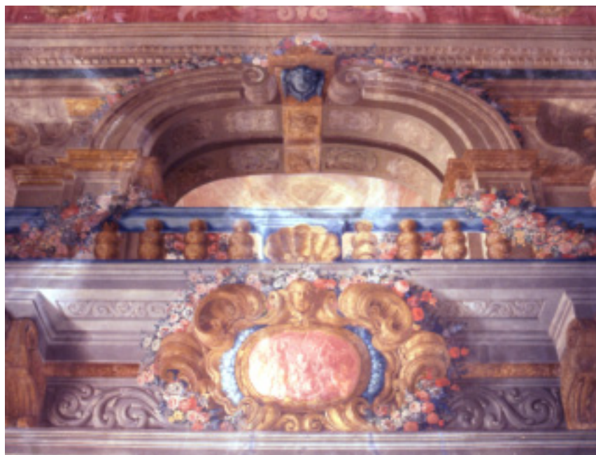
FIG. 4 VINCENZO BACHERELLI, PORMENOR DA CARTELA E ARCO DO TECTO DA PORTARIA DO MOSTEIRO DE S. VICENTE DE FORA, LISBOA, 1710.