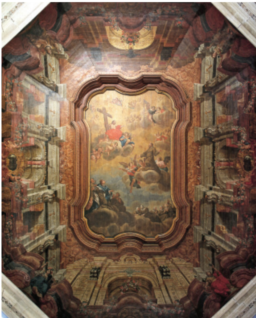
FIG.1 JOÃO NUNES DE ABREU, TECTO DA IGREJA DO MENINO DEUS, LISBOA, C. 1738. © CML/DMCRU. FOTOGRAFIA DE HENRIQUE RUAS.

O contacto com a gramática decorativa de Vincenzo Bacherelli na primeira década do século XVIII foi crucial para a sua formação e desenvolvimento da decoração dos seus tectos pintados do tipo arquitecturas fingidas, tornando-se um dos melhores discípulos do mestre florentino. No circuito português, conviveu e participou em trabalhos conjuntos quer com quadraturistas quer com figuristas de grande peso durante as primeiras décadas de Setecentos.