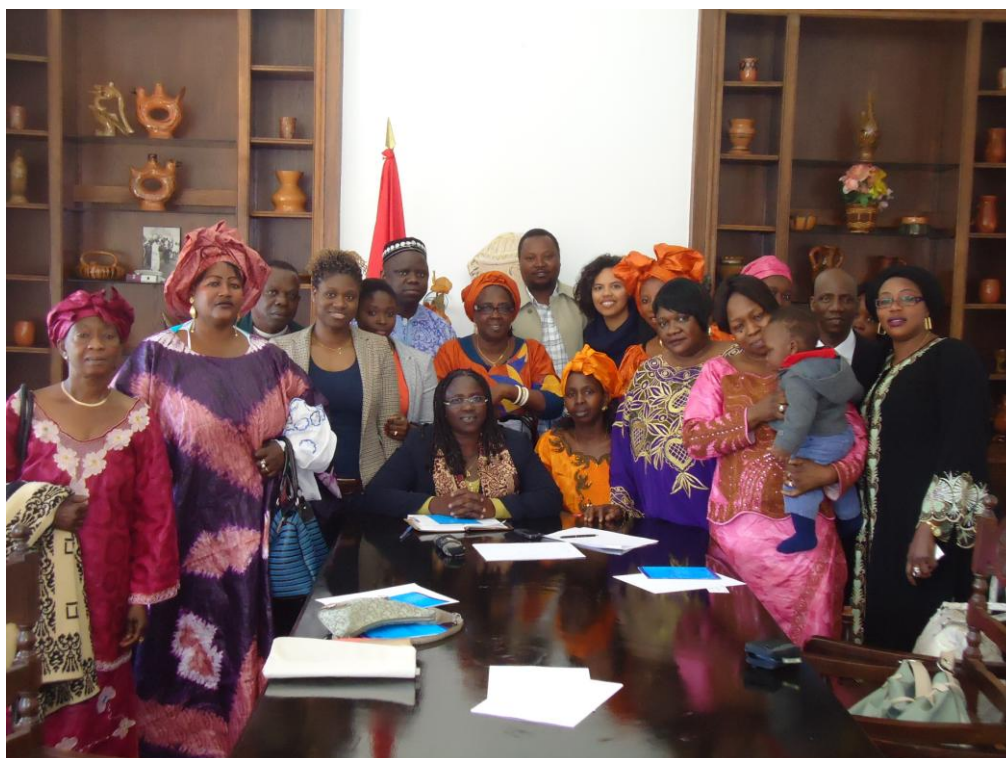
Fig. 4 Participantes da Conferência na Embaixada da Guiné-Bissau em Lisboa a 30.04.2012