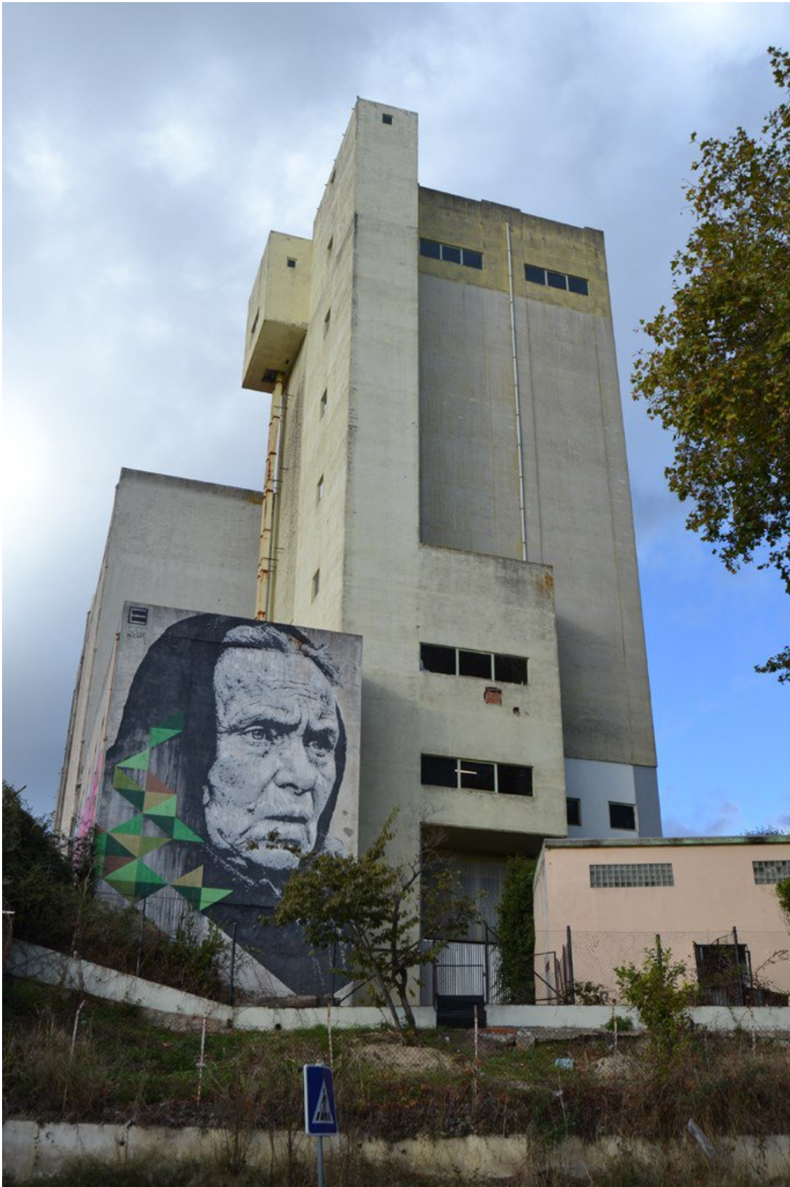
Figura 6 - Silos das Ceres, uma antiga fábrica de moagem de trigo, é hoje um contentor criativo de sete andares e cerca de 5000m 2 que serve de estúdio a vários artistas nas Caldas da Rainha.