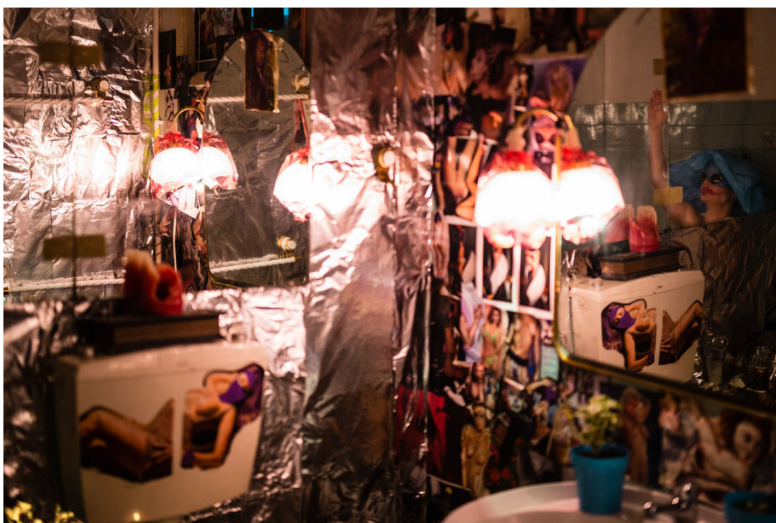
Figura 1 - Uma das instalações numa das casas de habitação que fez parte da décima nona edição de festival Caldas Late Night que se realizou entre os dias 29 e 31 de Maio de 2015.

O evento assinalou o ano passado o seu vigésimo segundo aniversário e contou com mais de cem intervenções, das quais sessenta foram realizadas em casas de estudantes da universidade.