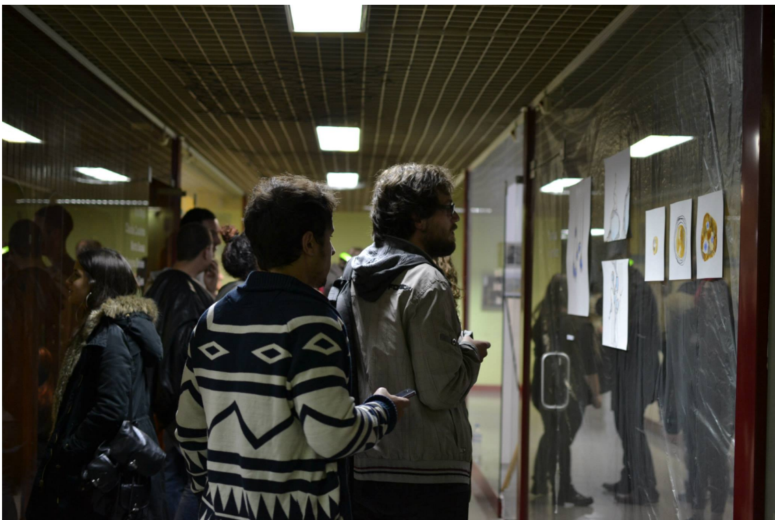
Figura 10 - Exposição Coletiva do 2º ano de Artes Plásticas do ano letivo de 2014/2015 em que os alunos expuseram trabalhos nas lojas desocupadas do Centro Comercial D. Carlos I antes da décima nona edição do Caldas Late Night , iniciativa intitulada de Pré-Caldas .