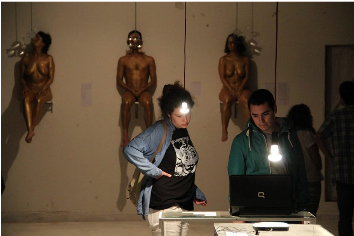
Figura 11 - A performance OPERA III inserida no programa Zero Zeugma , um projeto artístico que decorreu durante a décima nona edição do festival Caldas Late Night e ocupou cinco pisos dos Silos Contentor Criativo – uma antiga fábrica de moagem de trigo.