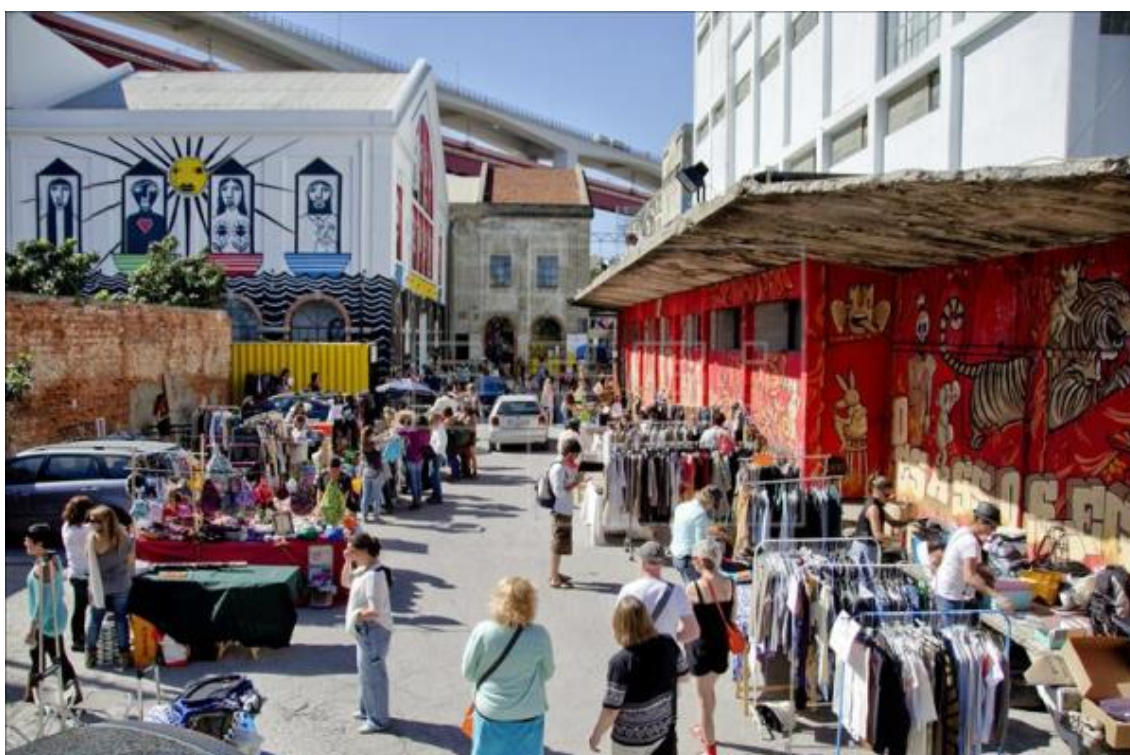
Figura 7 - O lote do Lx Factory em Alcântara, Lisboa.

Em 2005, a MainSide, uma empresa direcionada a investimentos imobiliários, veio a adquirir um destes complexos de fábricas antigas 26 , um espaço antes ocupado pela Gráfica Mirandela, e criou o Lx Factory em 2008. Totalizando um conjunto de onze edifícios, este lote viera a tornar-se num polo de empresas ligadas ao sector criativo, nomeadamente às artes plásticas, ao design , à publicidade, à literatura, à moda e à dança.