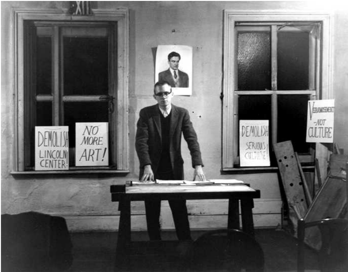
Figura 5 - Henry Flynt recita From Culture to Veramusment num apartamento em Nova Iorque a 28 de Fevereiro de 1963.

Desde então, são vários os artistas que, face a esta realidade, têm vindo a desenvolver métodos de trabalho, de alguma forma, incompatíveis com, ou, pelo menos, que questionam o formato institucional, pretendendo alcançar novos público e novos canais de receção artística.