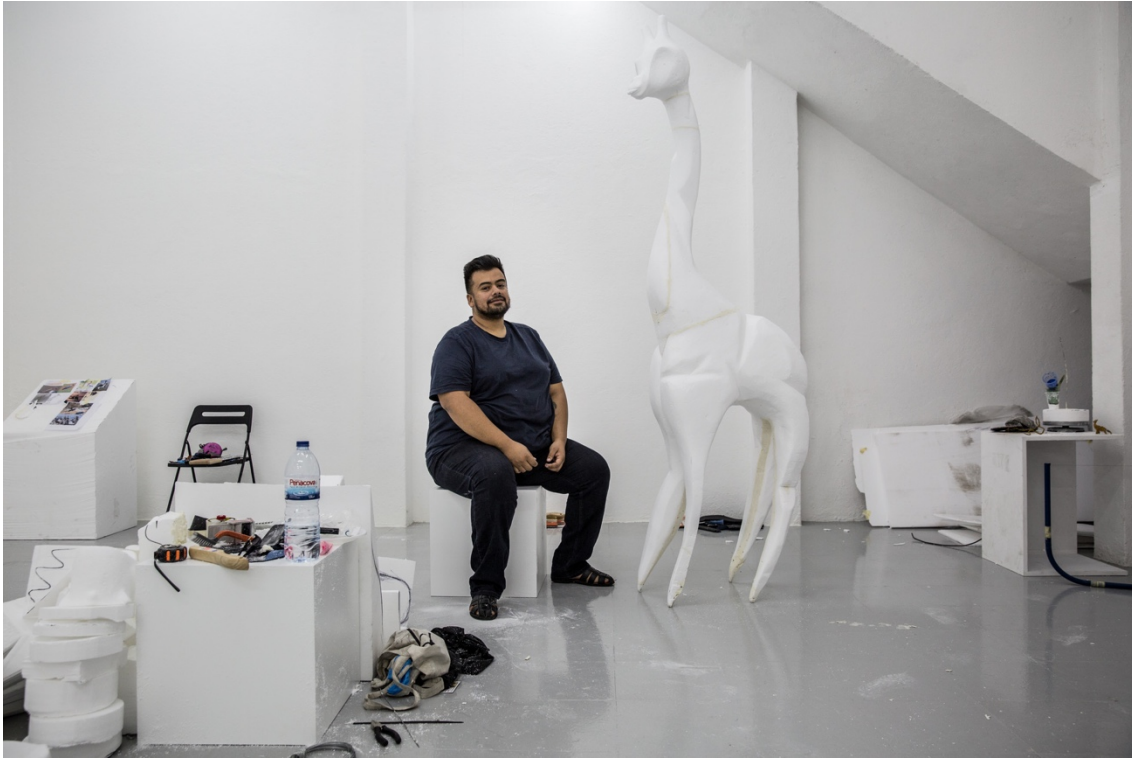
Figura 3 - Naufus Ramirez-Figueroa na preparação da sua exposição Shit Baby and The Crampled Girafe na Kunsthalle Lissabon , onde utilizou a galeria como estúdio até à sua inauguração.

aqui, para além disso, têm um elevado número de artistas femininas a participarem nas exposições, assim como, criadores do médio oriente e da américa latina, ainda com pouca visibilidade em Portugal.