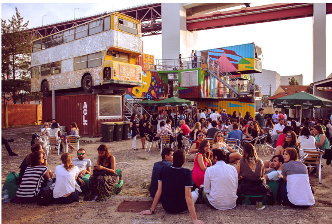
Figura 8 - O espaço do The Village Underground em Alcântara, Lisboa.

sentar ideias e produtos num lugar que é de todos, para todos (LXFACTORY), esta «fábrica de ideias», como Rita Silva Freire lhe chamou numa reportagem dedicada ao espaço 27 , tem vindo a apoiar e a organizar exposições, concertos, workshops e outras atividades nesta zona da cidade desde a sua inauguração, tais como as edições do Lx Open Day . Na mesma reportagem, Filipa Baptista, arquiteta responsável pelo projeto, explica que [os] edifícios têm um enorme valor patrimonial, mas estavam desabitados, à espera de um projeto de urbanização [o] que pode demorar imenso tempo e causa a sua degradação. O que fizemos foi uma forma de os devolver à cidade e aos seus habitantes. Desde o início que a nossa ideia foi ter aqui um polo cultural dinâmico. As pessoas aderiram e quiseram participar (FREIRE, 2009, p.10).