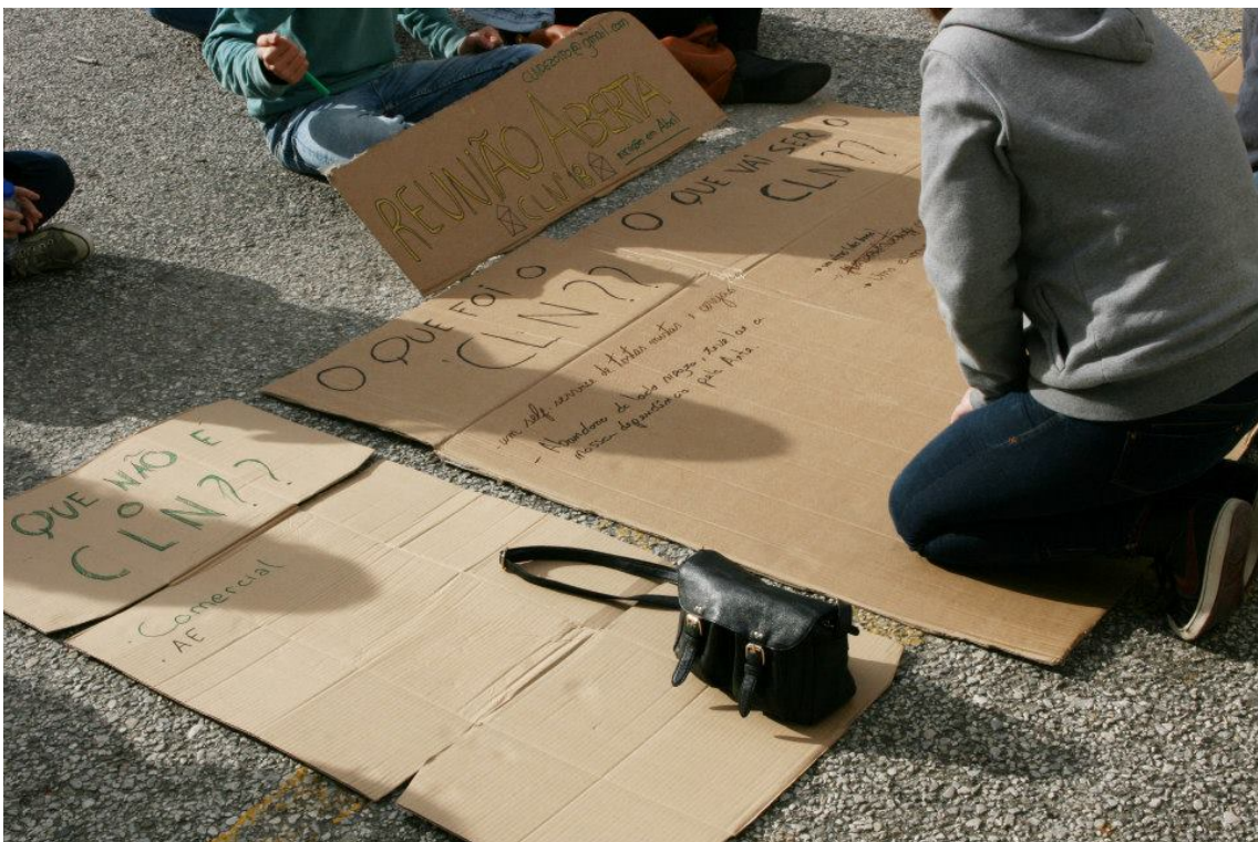
Figura 9 - Jovens artistas, estudantes da Escola Superior de Artes e Design das Caldas da Rainha, reúnem-se na primeira reunião aberta para discutirem a organização da décima oitava edição do festival Caldas Late Night em 2014.