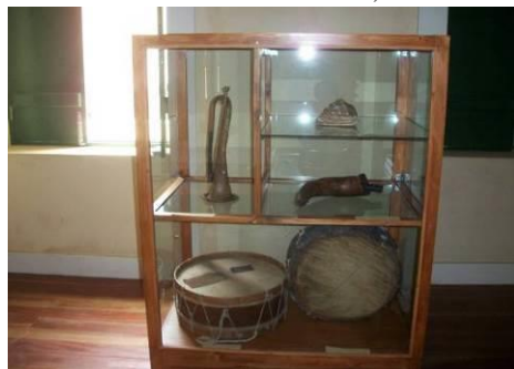
Imagem 5- Objectos tambores, cornetas e búzio/Museu da Tabanca – Sala de Exposição 1