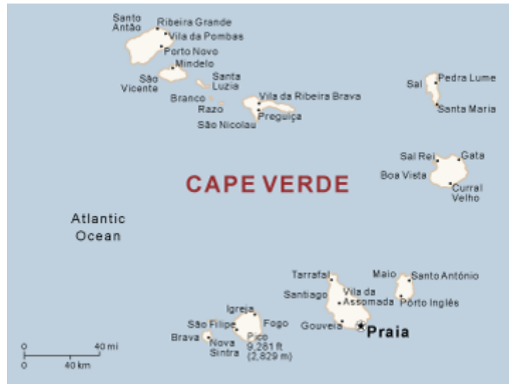
Imagem 6– Arquipélago de Cabo Verde