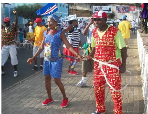
Imagem 2– Desfile da Tabanca (Bandeiras) Imagem 3– Desfile da Tabanca (Ladrões)