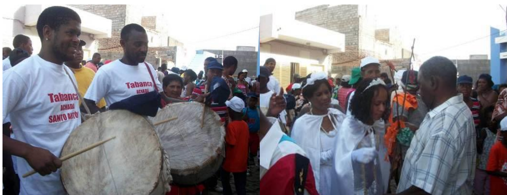
Imagem 1– Beijo da Vara /Tabanca Achada Santo António

De acordo com a tradição, pernoita-se na casa da rainha de agasalho, e a festa é acompanhada do batuco, no entanto se notou que outras danças e músicas tradicionais e não só fizeram parte do convívio.