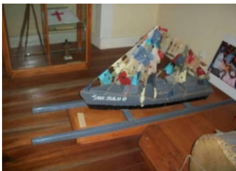
Imagem 4- Barco alegórico /Museu da Tabanca - Sala de Exposição1