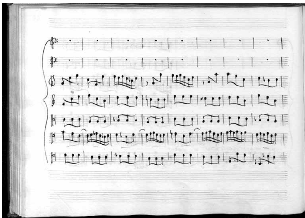
Figg. 2c-d: Brani della partitura La Contesa delle Stagioni , musica di Domenico Scarlatti. Venezia, Biblioteca Marciana, ms. 9769. Vocalizzo dell'aria dell'Autunno cantata da Gaetano Mossi