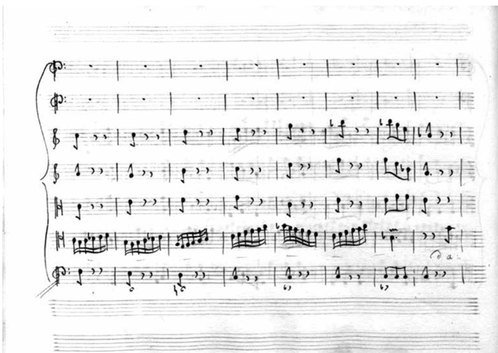
Figg. 2e-f: Brani della partitura La Contesa delle Stagioni , musica di Domenico Scarlatti. Venezia, Biblioteca Marciana, ms. 9769. Vocalizzo dell'aria dell'Autunno cantata da Gaetano Mossi