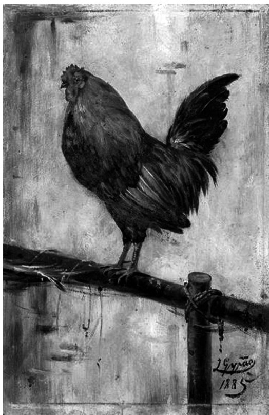
Fig. 6 — José Moura Girão, Galo , óleo sobre madeira, 28,5 x 18,7 cm, 1885, Museu de José Malhoa, Caldas da Rainha [Imagem a cores na página 317]

estudo aturado do comportamento e da anatomia animal remete-nos para os mesmos métodos de observação de base empirista utilizados por Edwin Landseer nos seus quadros animalistas. Tal como o pintor inglês, também Moura Girão se afeiçoava aos animais que retratava e, por conseguinte, recusava-se a matá-los ou a vendê-los, acabando sempre por oferecê-los a amigos.