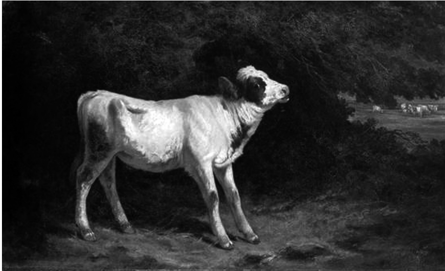
Fig. 4 — Tomás da Anunciação, O Vitelo , óleo sobre tela, 76 x 125 cm, 1873, Museu Nacional de Arte Contemporânea — Museu do Chiado, Lisboa [Imagem a cores na página 316]

referência incontornável na paisagem e na pintura animalista, com as telas, Vista Tirada do Sítio da Amora (1852) e O Vitelo (1873) (Figura 4), respectivamente. No entanto, a sua principal influência seria junto do Grupo do Leão.