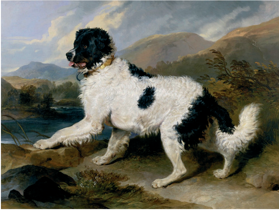
Fig. 2 — Edwin Landseer, Lion: A Newfoundland Dog , óleo sobre tela, 149.8 x 195.6 cm, 1824, Victoria and Albert Museum, Londres