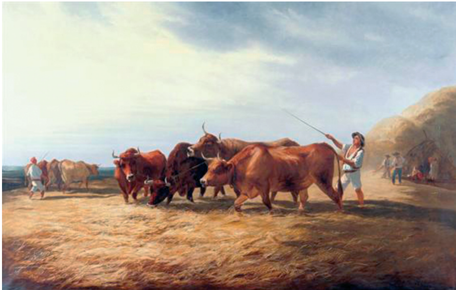
Fig. 3 — Tomás da Anunciação, Na Eira , óleo sobre tela, 123 x 193 cm, 1861, Museu Nacional de Arte Contemporânea — Museu do Chiado, Lisboa