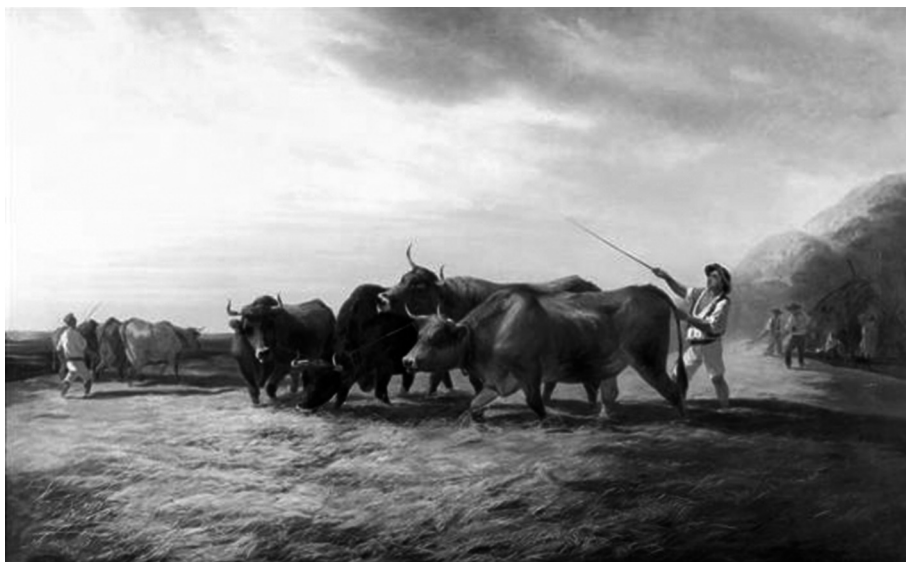
Fig. 3 — Tomás da Anunciação, Na Eira , óleo sobre tela, 123 x 193 cm, 1861, Museu Nacional de Arte Contemporânea — Museu do Chiado, Lisboa [Imagem a cores na página 315]

Neste contexto, a pintura animalista em Portugal traduz-se no retrato da ruralidade e dos costumes populares como, por exemplo, a pastagem dos animais e as colheitas de cereais. Desta forma, o gado bovino, taurino e ovino foi frequentemente representado na pintura animalista portuguesa, já que estas espécies eram utilizadas como animais de carga nas tarefas quotidianas dos meios rurais (Figura 3).