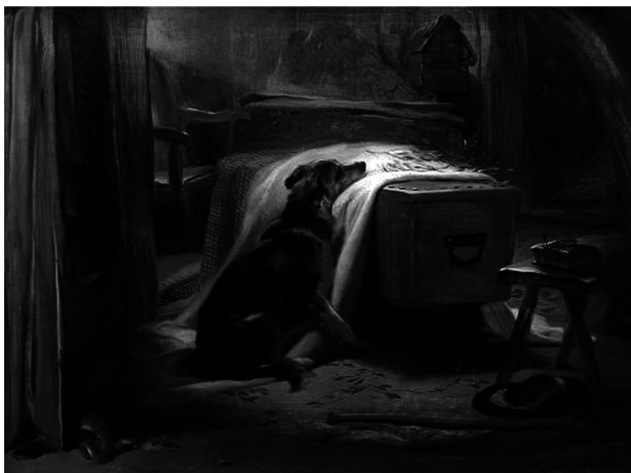
Fig. 1 — Edwin Landseer, The Old Shepherd's Chief Mourner , óleo sobre tela, 45.7 x 61 cm, 1837, Victoria and Albert Museum, Londres. [Imagem a cores na página 313]

Sir Edwin Landseer começou o seu percurso artístico a retratar membros da alta aristocracia britânica. Porém, rapidamente a sua obra seguiu o rumo da pintura animalista, em que o pintor inglês, substituindo, de certa forma, as pessoas pelos animais, colocou estes últimos como figuras centrais dos seus quadros. Tal reconfiguração visava ainda conferir sentimento e emotividade aos animais. O artista vitoriano procurou sempre transmitir a dimensão emocional dos animais retratados, evidenciando a proximidade existente entre o ser humano e as outras espécies, tal como se verifica na tela The Old Shepherd's Chief Mourner , de 1837 (Figura 1).