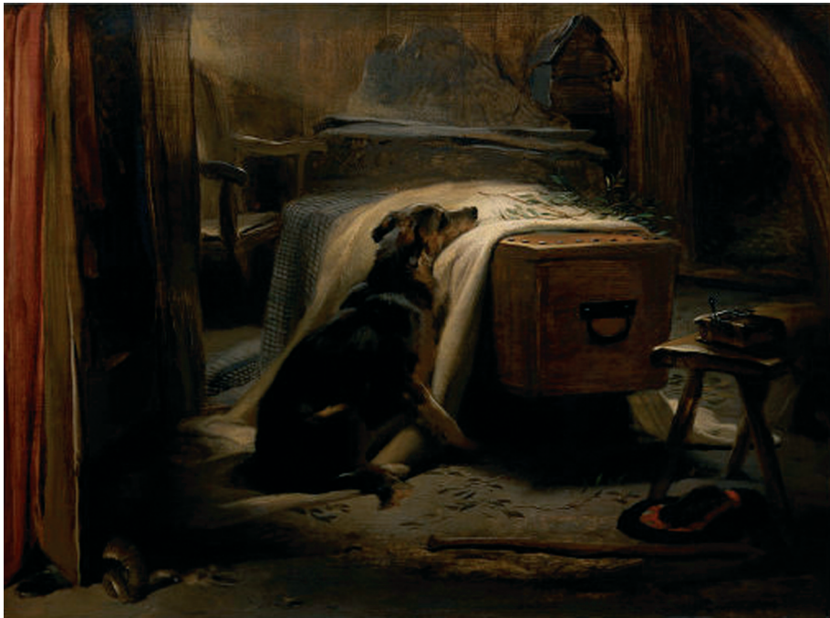
Fig. 1 — Edwin Landseer, The Old Shepherd's Chief Mourner , óleo sobre tela, 45.7 x 61 cm, 1837, Victoria and Albert Museum, Londres © V. & A. Images, Victoria and Albert Museum, Londres.