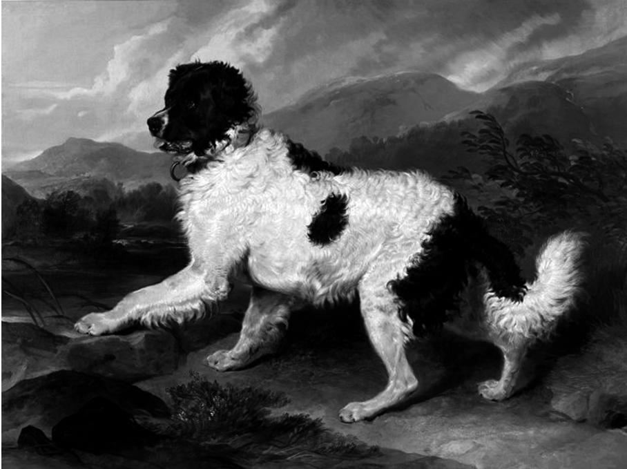
Fig. 2 — Edwin Landseer, Lion: A Newfoundland Dog , óleo sobre tela, 149.8 x 195.6 cm, 1824, Victoria and Albert Museum, Londres [Imagem a cores na página 314]

gestos, expressões e posições dos animais, bem como a textura do pêlo, que foi frequentemente retratada de modo a provocar no espectador aquele impulso básico de querer tocar na tela para sentir o pêlo, como se de algo real se tratasse (Figura 2). Assim, tendo como objectivo desencadear esses desejos e sensações no público, Edwin Landseer pretendia justamente que a sua obra não se destinasse a ser apreciada apenas por uma classe social privilegiada.