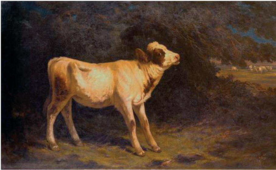
Fig. 4 — Tomás da Anunciação, O Vitelo , óleo sobre tela, 76 x 125 cm, 1873, Museu Nacional de Arte Contemporânea — Museu do Chiado, Lisboa