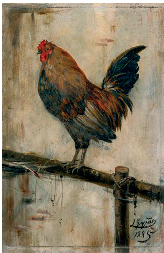
Fig. 6 — José Moura Girão, Galo , óleo sobre madeira, 28,5 x 18,7 cm, 1885, Museu de José Malhoa, Caldas da Rainha