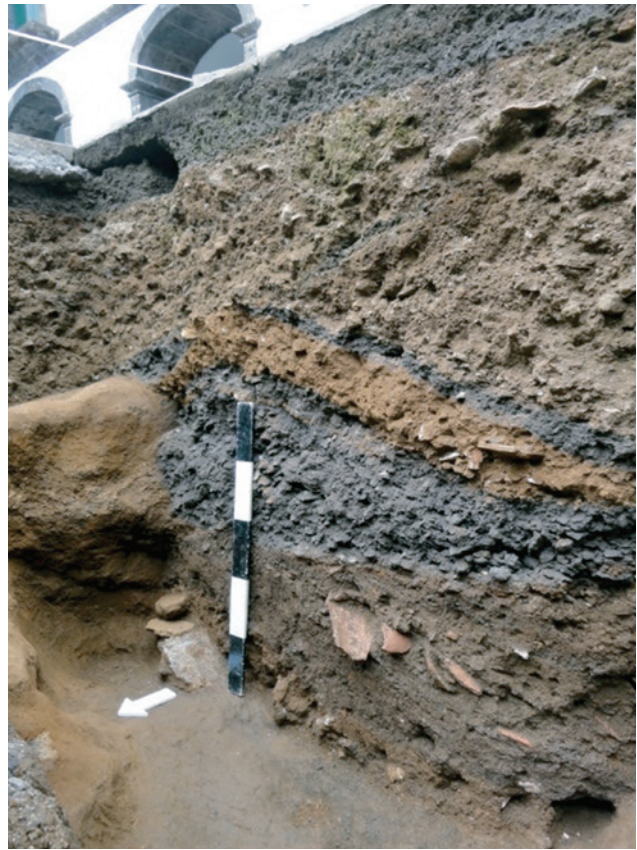
Figura 6 – Corte estratigráfico (este-oeste) da sondagem 03 do claustro.