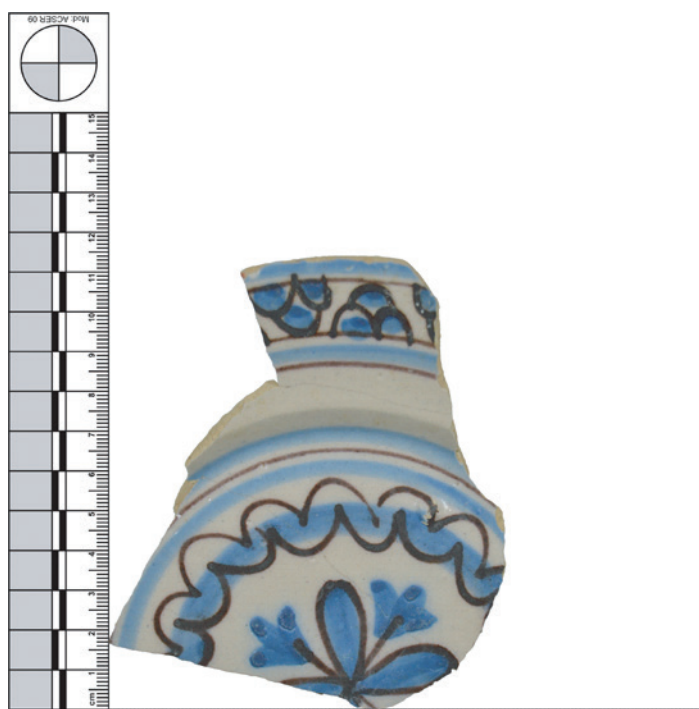
Figura 4 – Prato de faiança portuguesa com decoração a azul e vinoso recolhido na sondagem 02 do setor capela do Senhor Santo Cristo e coro-baixo.