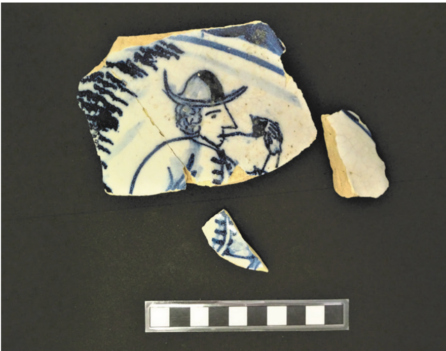
Figura 7 – Fragmento de forma fechada de provável origem holandesa recolhido na sondagem 03 do claustro.