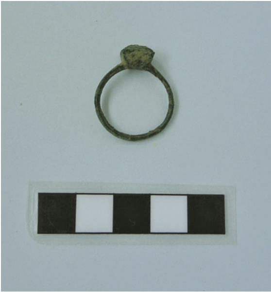
Figura 5 – Anel em liga de cobre recuperado na sondagem 07 do setor capela do Senhor Santo Cristo e coro-baixo.