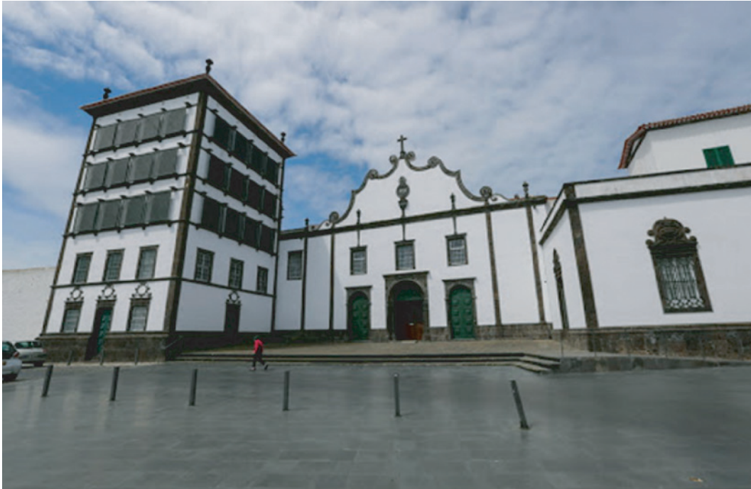
Figura 1 – Convento de Nossa Senhora da Esperança, em Ponta Delgada.