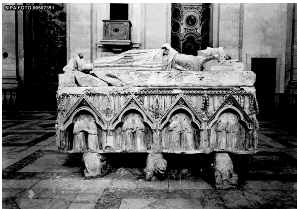
Fig. 3 – Colocação do túmulo do rei D. Diniz no centro da igreja de S. Dinis, Odivelas (de 1938 a 1961). Fotografia SIPA 00507391.

Esquivado o perigo de transferência, o mausoléu permaneceu no arranjo registado por Almeida Garrett até 1938. Nesta altura voltou a ocupar um lugar destacado sendo posicionado no centro da igreja, cuja planta tinha sido já profundamente modificada pelas obras de reconstrução pós-terramoto, desaparecendo então a divisão em três naves e tornando-a numa igreja de nave única com capelas laterais (fig. 3).