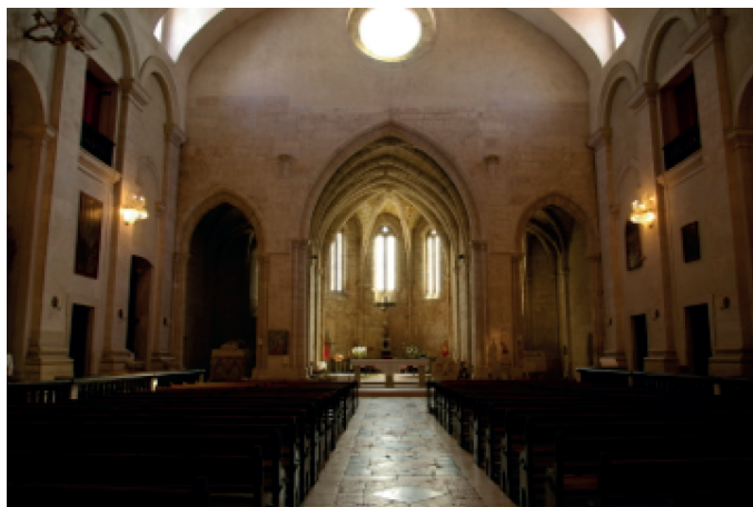
Fig. 1 – Atual colocação do túmulo do rei D. Dinis; capela do Evangelho, igreja de S. Dinis, Odivelas.

No que respeita à sua iconografia, profundamente erudita e embebida na espiritualidade cisterciense, o túmulo do rei D. Dinis atesta-se como um unicum no panorama da arte portuguesa da primeira metade do século XIV e uma peça emblemática da escultura medieval europeia.