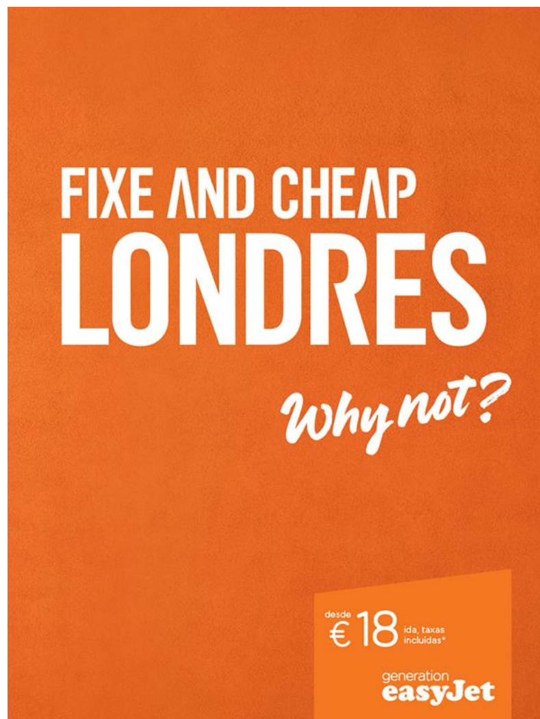
Figura 1 - Anúncio publicitário da EasyJet