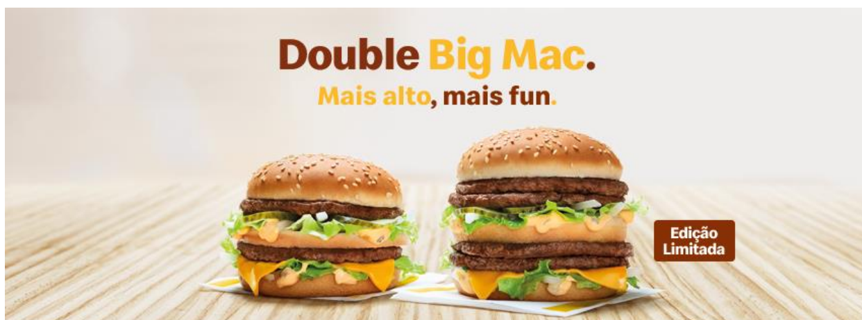
Figura 2 - Anúncio publicitário do McDonalds