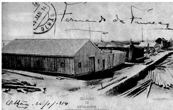
Edifícios do Estaleiro de Olhão, onde trabalhavam muitos carpinteiros

A sede desta associação situava-se na travessa Maria Pia, em Olhão (49) .