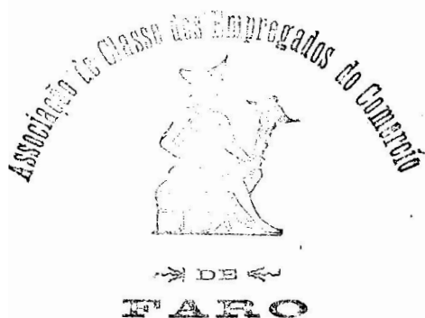
Carimbo da Associação de Classe dos Empregados do Comércio de Faro