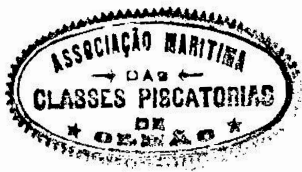
Carimbo da Associação de Classe dos Marítimos de Olhão