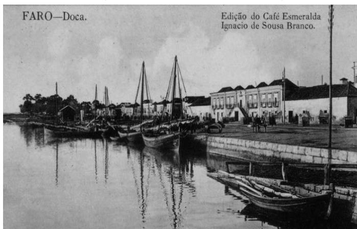
Doca de Faro no início do século XX