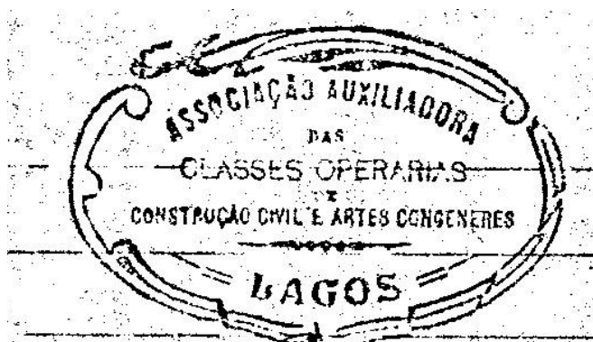
Carimbo da Associação de Classe dos Operários da Construção Civil e Artes Correlativas de Lagos