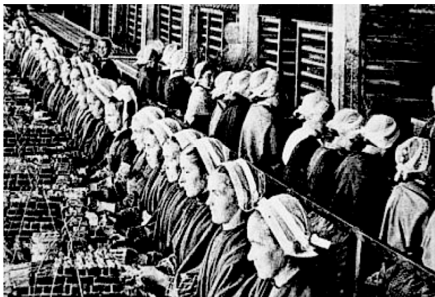
Trabalhadoras numa fábrica de conservas de Lagos nas primeiras décadas do século XX

resto não se encontram na região outras associações de base feminina, embora elas fossem mão-de-obra importante em sectores como as conservas, ou até mesmo a cortiça, mas quase sempre com carácter provisório e eventual, neutralizando portanto qualquer forma de organização associativa. As operárias de Lagos realizam a assembleia-geral em 22 de Dezembro de 1912 onde aprovam os estatutos que