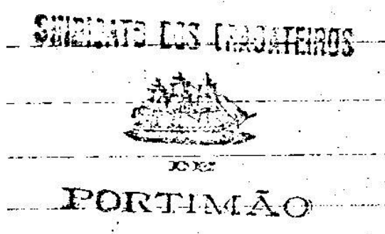
Carimbo do Sindicato dos Fragateiros de Portimão