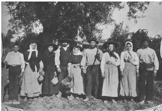
Trabalhadores do Campo Algarve_ILPORT14-02-1910, n208, p. 221