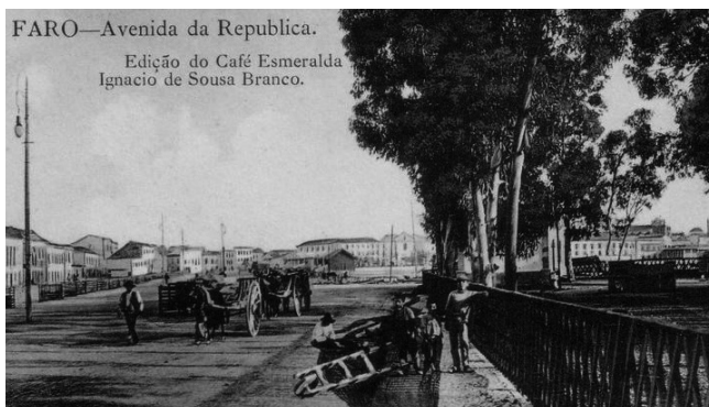
Carroças, na Avenida da República em Faro

Este grupo profissional organiza-se a partir de Junho de 1920, tal como