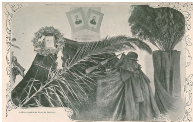
FIG. 1 A Sala do Regicídio no Museu da Revolução. Fotografia. 1911. © Benoiel / Ilustração Portuguesa , 9/1/1911, n.º 255.

retábulos, entre outros), provenientes de diversas casas congreganistas, sendo entregues ao cuidado de Borges Grainha, que os acondicionou paredes-meias com o Museu da Revolução e com o Vintém Preventivo, ocupando também a antiga biblioteca e igreja da Residência jesuíta da Rua do Quelhas, n.º 6. A tarefa de Borges Grainha na organização do Museu das Congregações (Fig. 2) não foi nada simples, quer pela falta de recursos humanos, quer de materiais e financeiros para ultimar os preparativos para a inauguração do museu e possibilitar a sua abertura e manutenção, a que se somou a concorrência de outras instituições pela ocupação dos espaços a si destinados, como a pretensão do Instituto Superior de Comércio, à qual Borges Grainha reagiu de forma enérgica junto do Governo, presidido por António Granjo, conseguindo por fim inaugurar o Museu, no dia 4 de outubro de 1924 (Grainha,