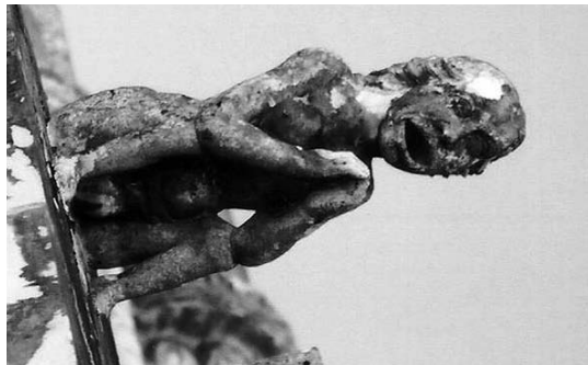
Figura 3 e Figura 4

Gárgula-mulher com um toucado, envergando um vestido rasgado ou descosido que deixa entrever os seios nus (à esquerda) e gárgula-mulher, nua, de mãos postas a rezar (à direita), Capelas Imperfeitas, Mosteiro de Sta. Maria da Vitória, Batalha, finais século XV, inícios da centúria seguinte.