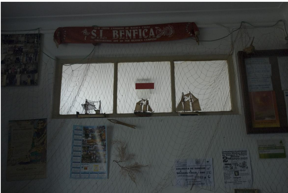
4.2.4. O Mar e o futebol