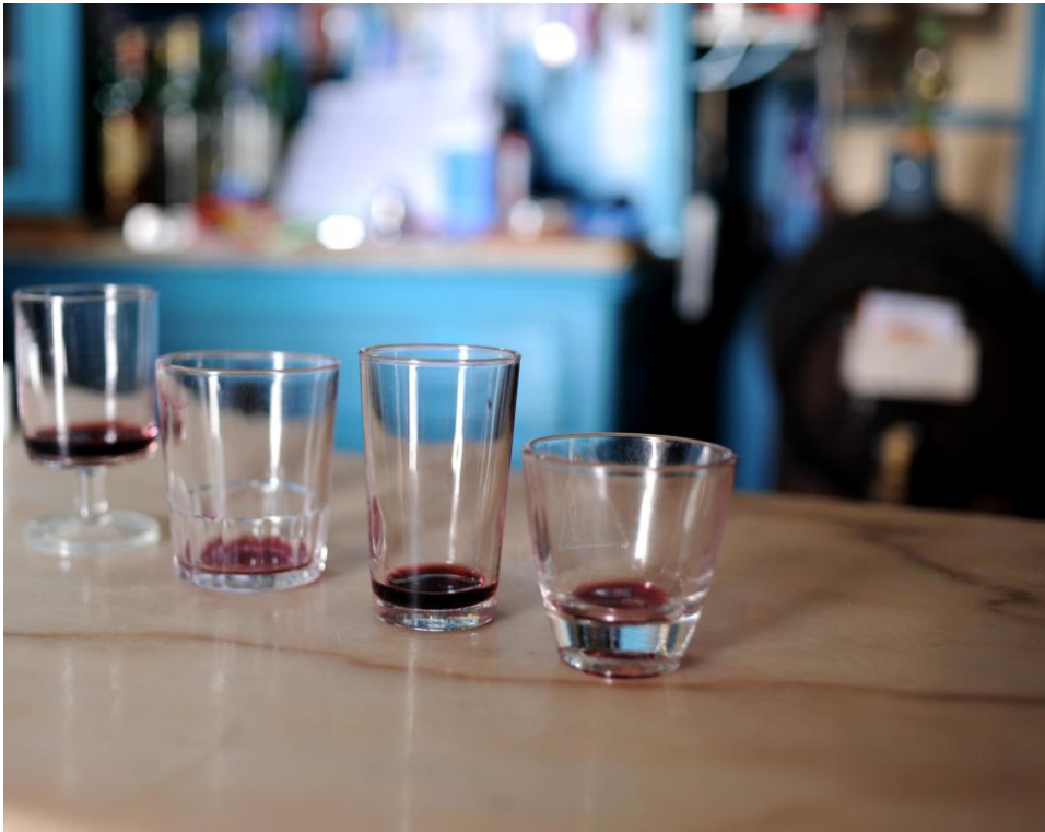
4.1.3. O vinho