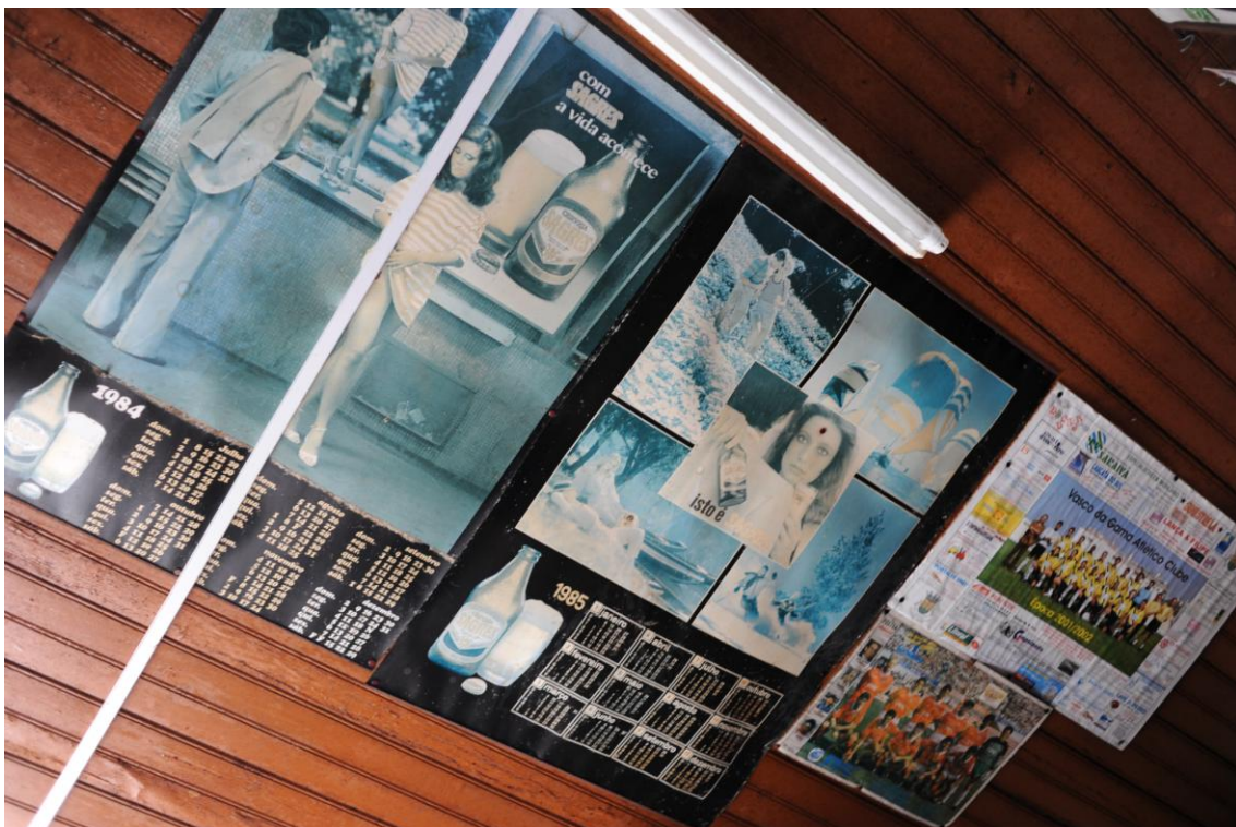
4.1.6. O futebol