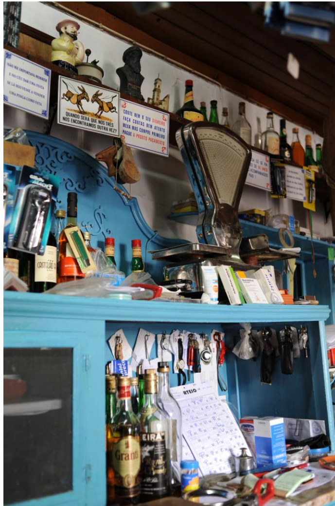
4.1.7. “Sabedoria” Popular