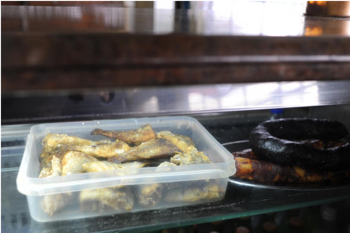
4.5.3. Os petiscos