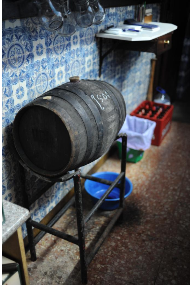
4.4.3. A pipa de vinho