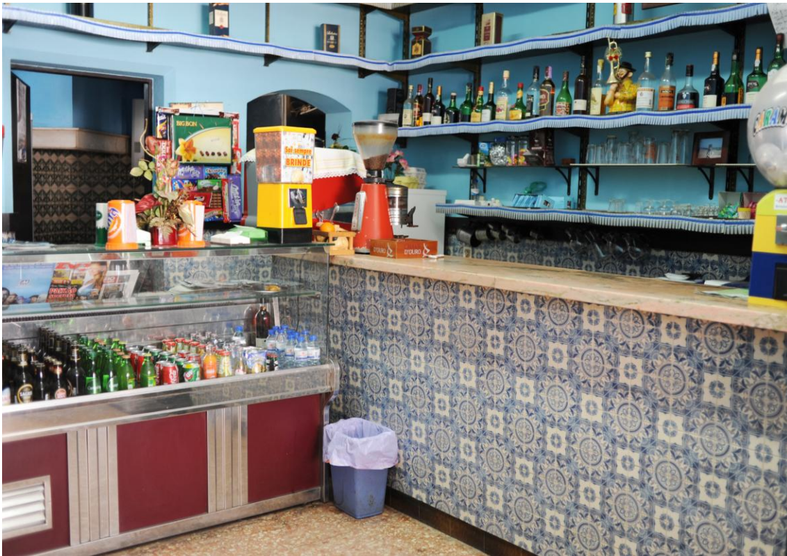
4.4.5 O balcão