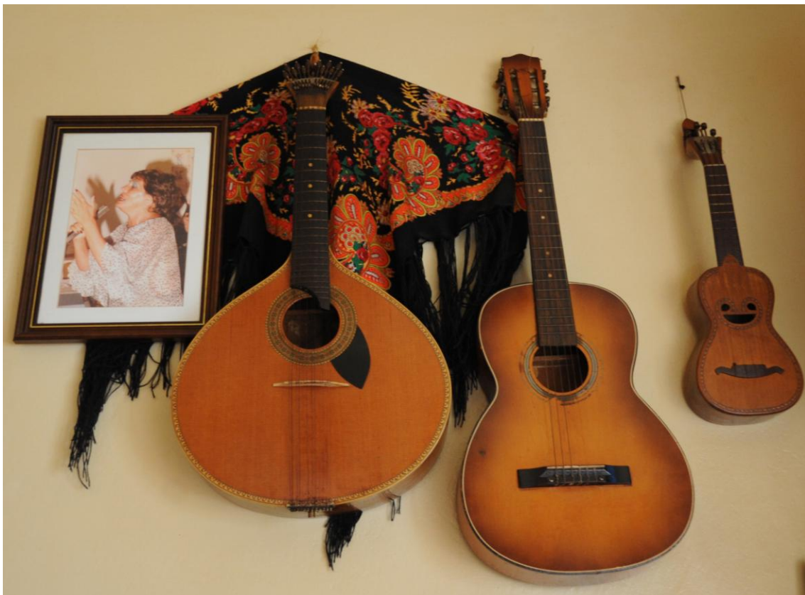
4.3.4. O Fado