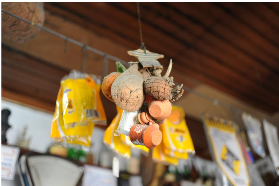
4.1.8. O Alentejo