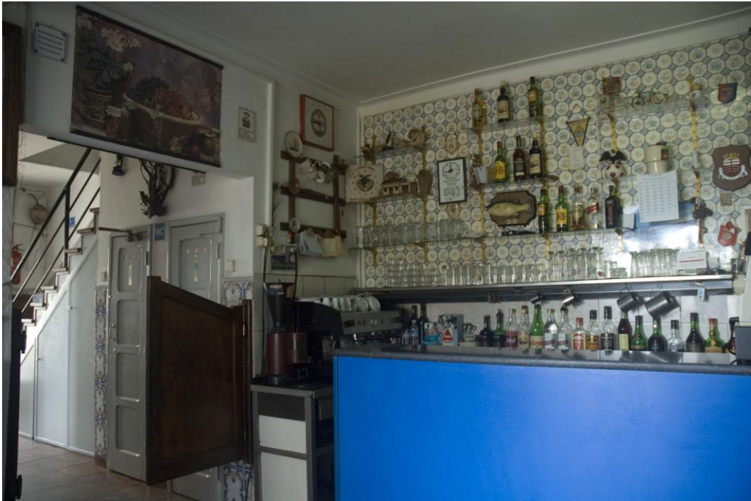
4.2.3. O Balcão