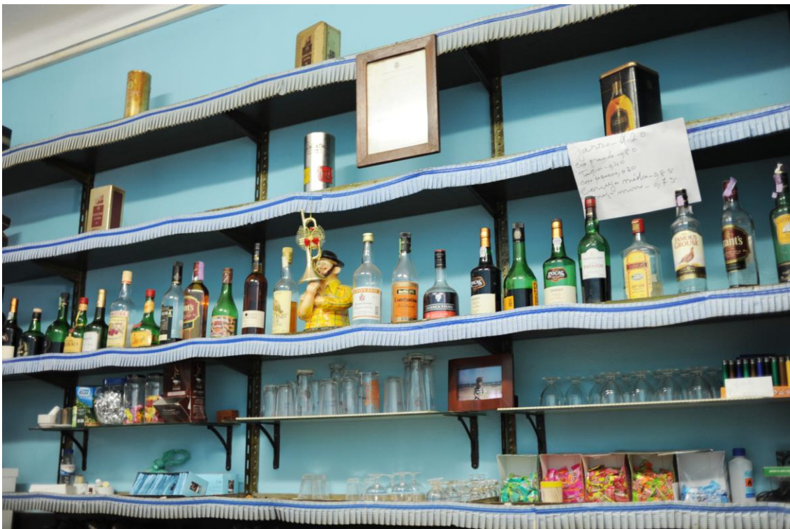
4.4.6. “Zé Povinho”