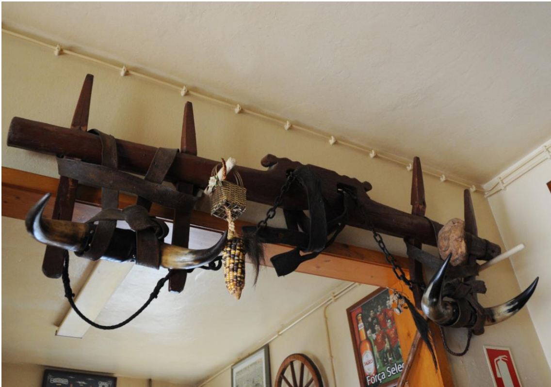
4.3.5. A agricultura