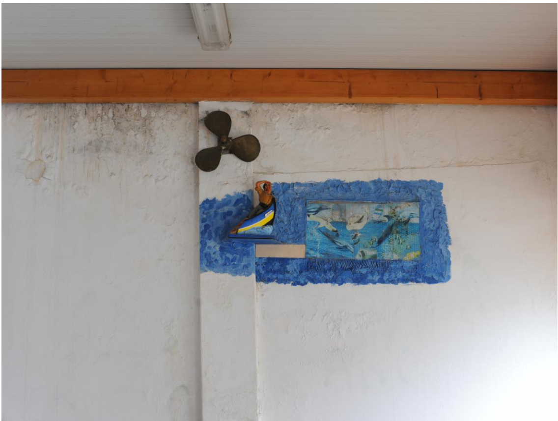
4.3.6. O Mar