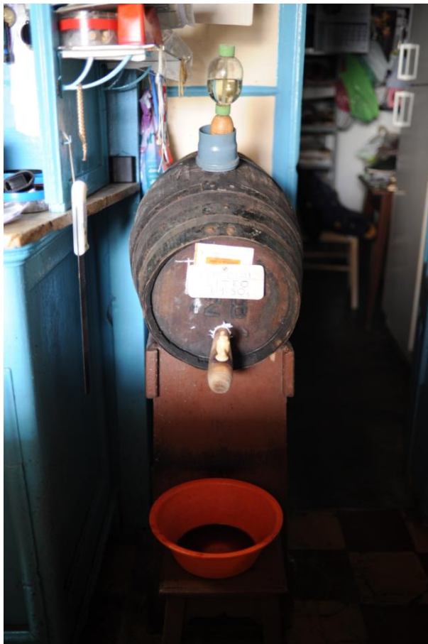
4.1.4. A Pipa de Vinho