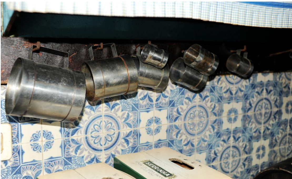
4.4.4. As “medidas”