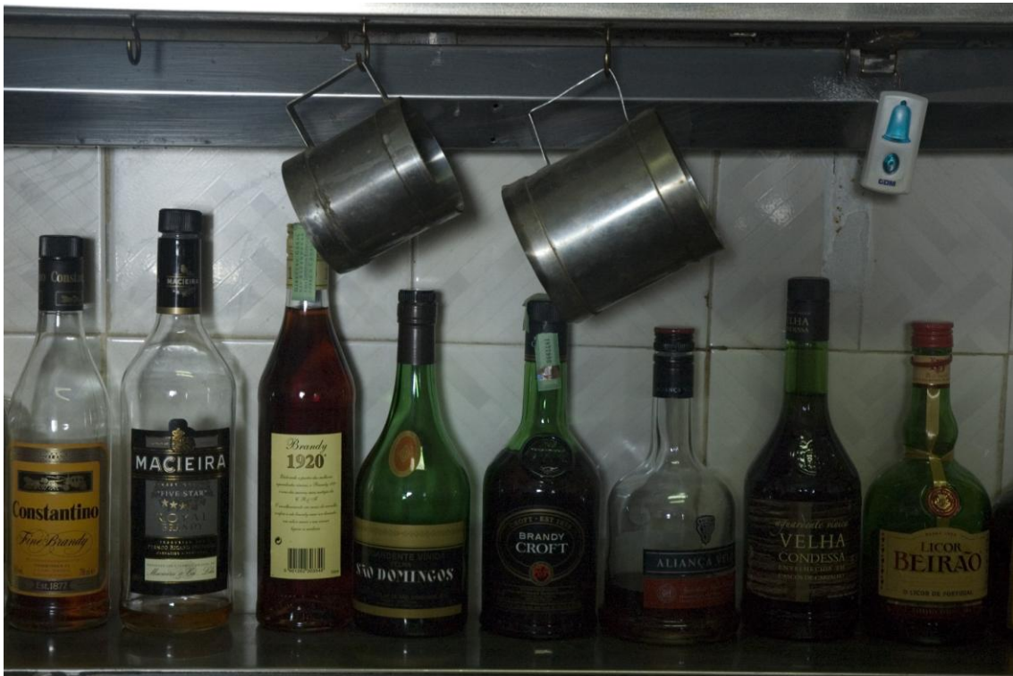
4.2.5. As “medidas”