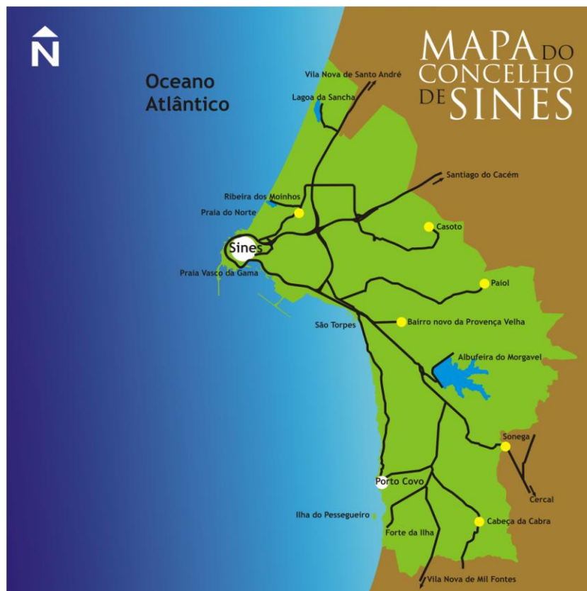
Figura 1.1. Mapa do Concelho de Sines