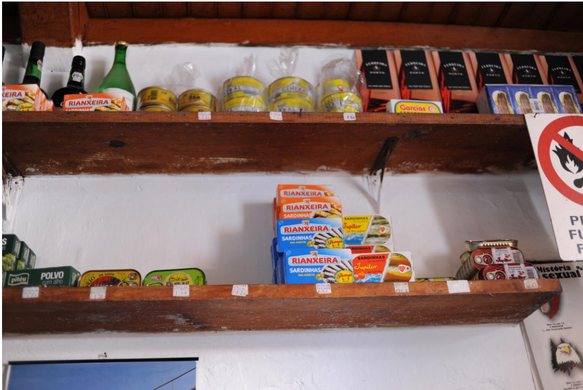
4.1.5. O petisco improvisado