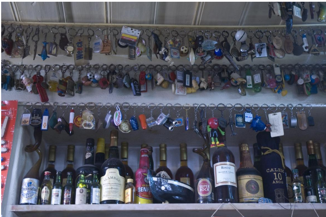
4.2.6. As colecções