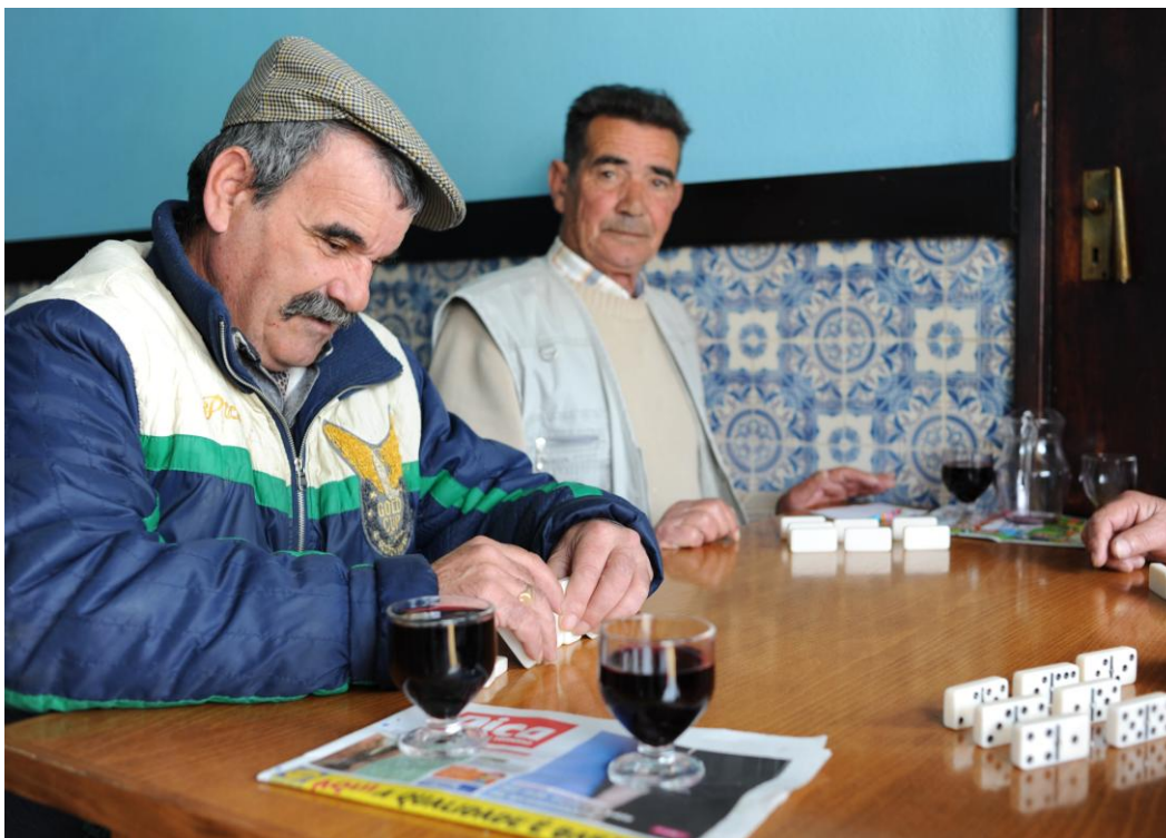
4.4.2. Os clientes