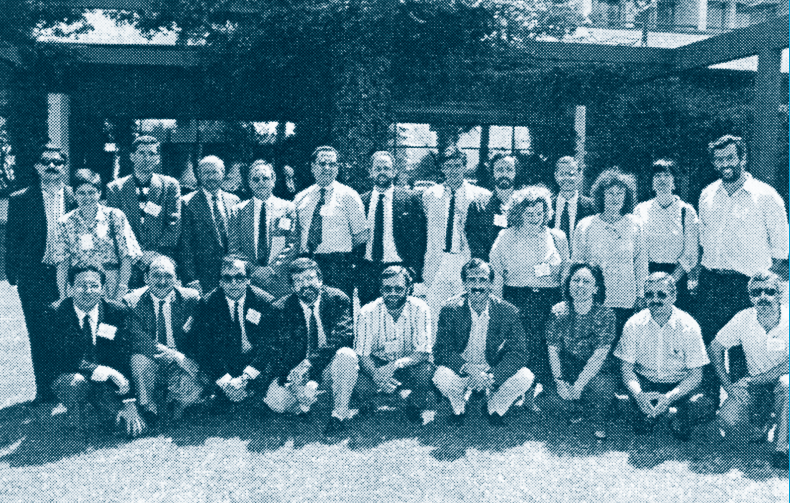
Equipa do Projeto Minerva